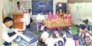
यकतभातः : कार्यक्रमात् खोलताना मान्यवर व उपस्थित शिक्षक