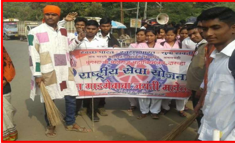
Street Play on 'Swacchta'