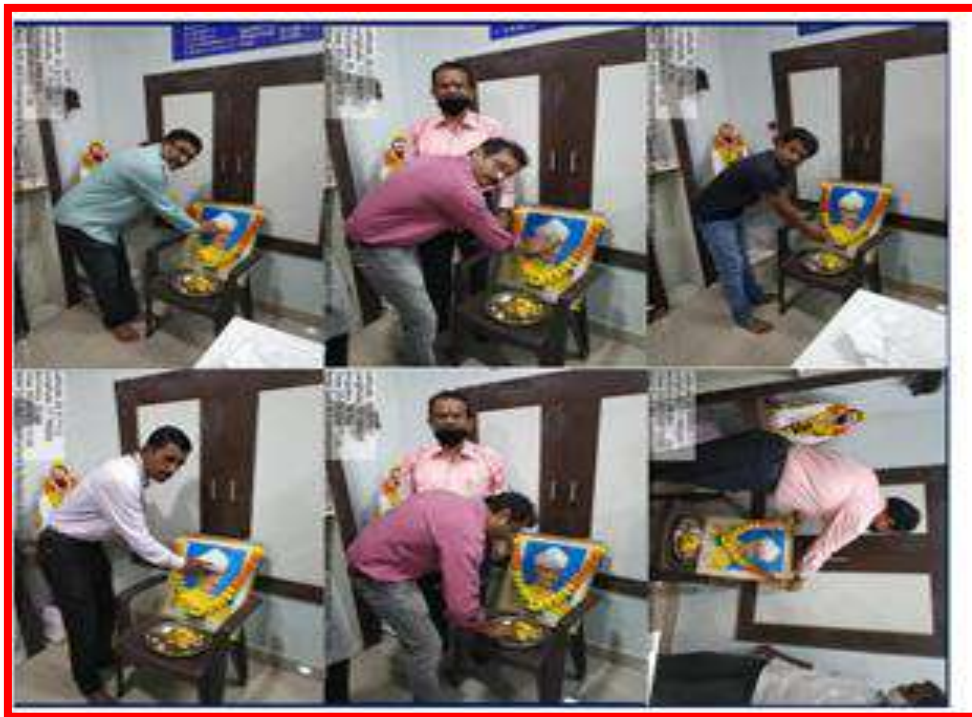
Photopujan of Dr. Sarvpalli Radhakrushnan