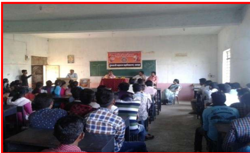
Guidance by Teacher on occasion of Teacher's Day