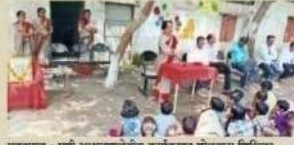
व्यवसाय : मृष्टी आश्रममार्फतेहील कार्यक्रमात योश्रमाना शिषियत.