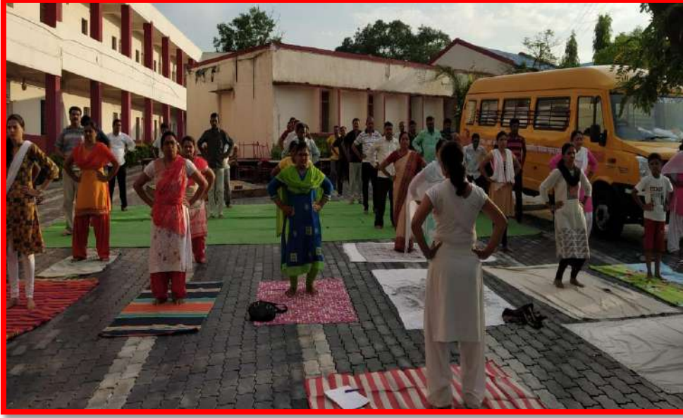
Staff Doing Yoga