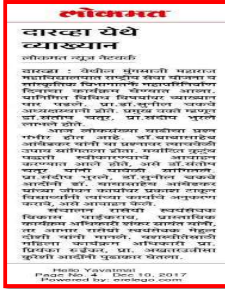
'Maharinirvan Din News Published in 'Lokmat'