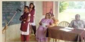
सचिवमाल : वसन्तराव नाईक विद्यालयगत मनोगत व्यक्त करताना विद्यार्थिनी.