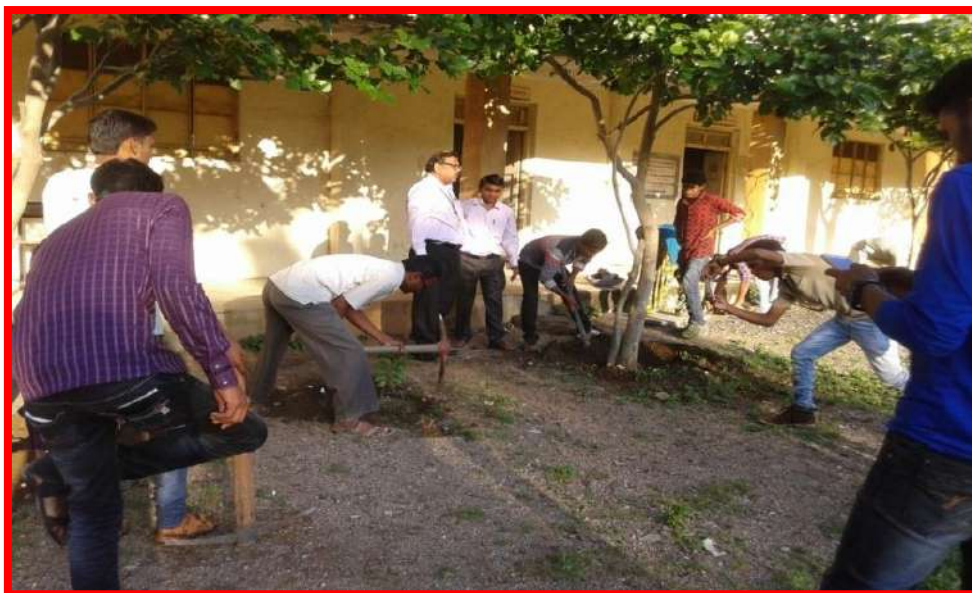
Swachhata Abhiyan on occasion of Ghandi Birth Anniversary