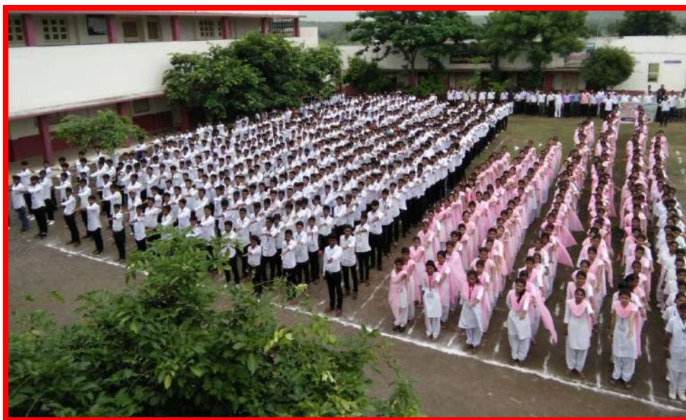
Student taken 'Cleanliness Pledge'