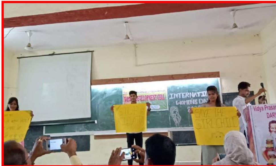
Short Play by the Students on 'Save Girl Child'