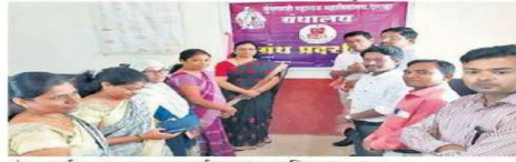
ग्रंथ प्रदर्शनाच्या उद्घाटन कार्यक्रमात उपस्थित मान्यवर.