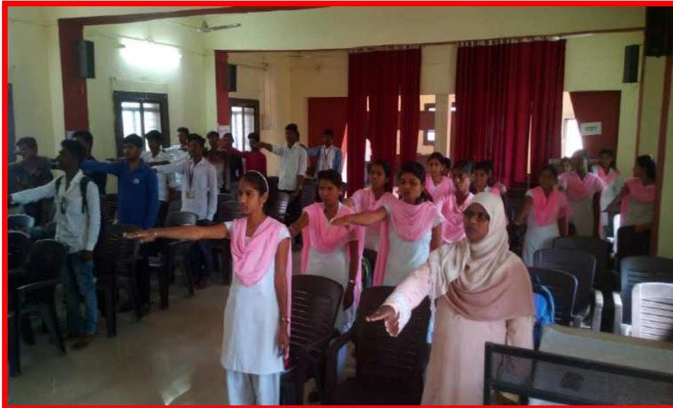
Students taken 'Constitution Pledge'