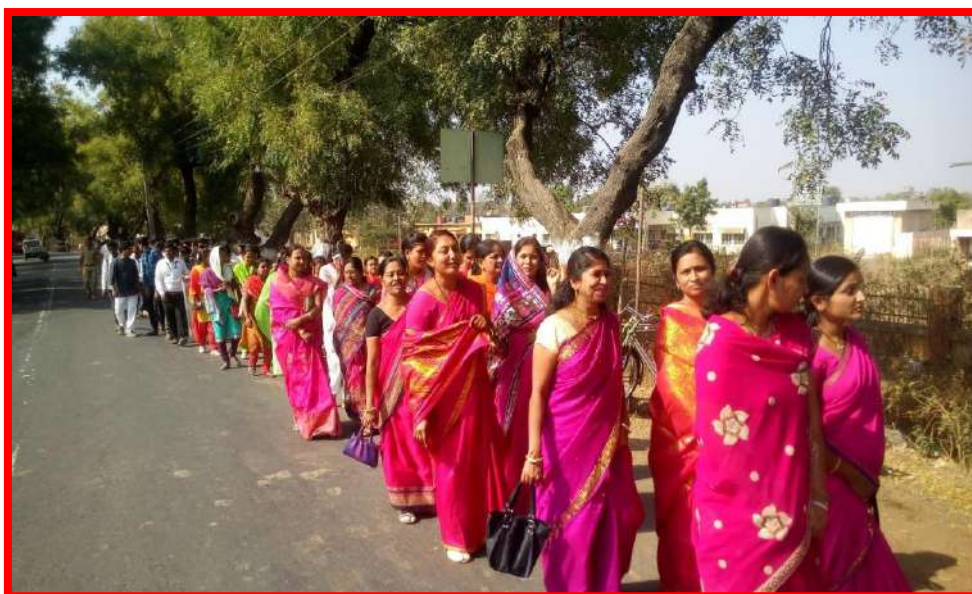
Participation of Women in 'Jijau and Vivekanand Rally'