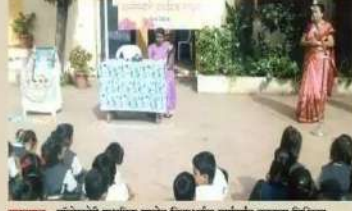
यवतमाळ : मॉन्टेसोरी प्राथमिक शाळेत विद्यार्थ्यांना मार्गदर्शन करताना शिक्षिका.