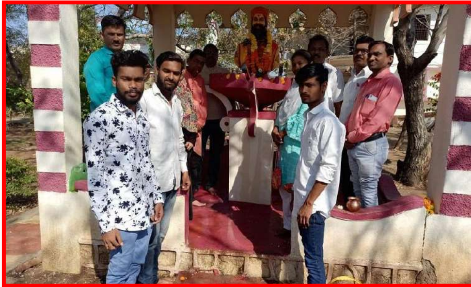
Celebration of Shiv Birth Anniversary