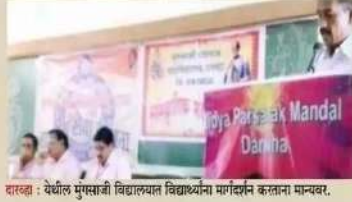
दारव्हा : येथील मुंगसाजी विद्यालयात विद्यार्थ्यांना मार्गदर्शन करताना मान्यवर.