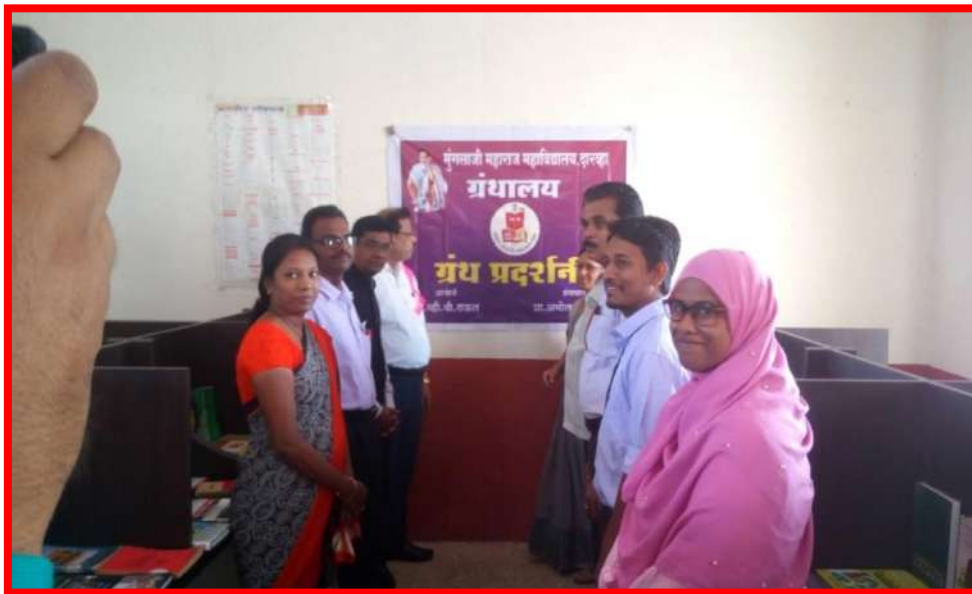
Book Exhibition On 'Reading Inspiration Day'