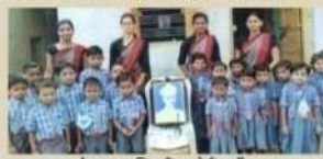
अवलम्ब्य : कापीकमाला उपस्थित विद्यार्थी.