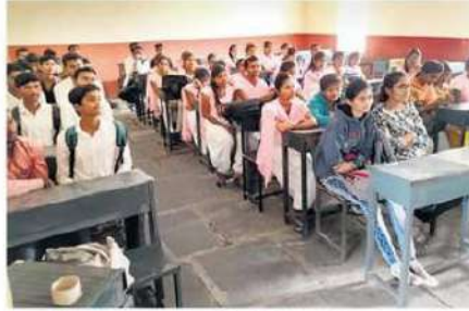
मुंगसाजी महाराज महाविद्यालयात रेड रिबन क्लबची स्थापना.