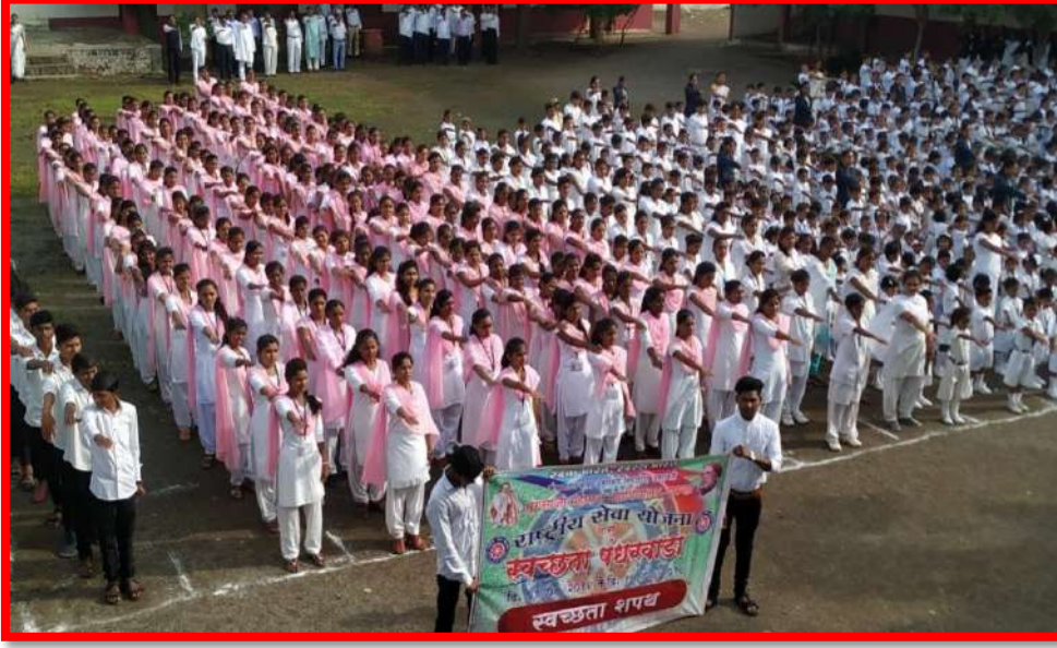
Student taken Swachata Pledge on