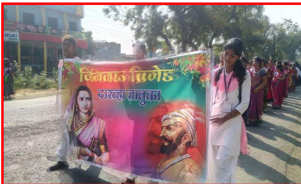
Students participation in 'Jijau And Vivekanand Rally'