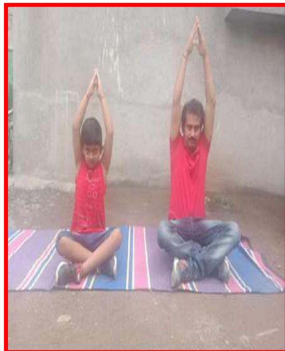
Staff and family members doing Yoga