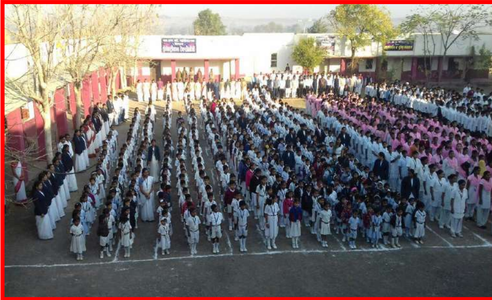
Participation Students in 'Republic Day'