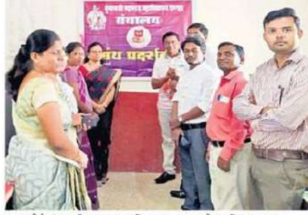
दारव्हा येथे मुंगसाजी महायज्ञ महाविद्यालयात वाचन प्रेरणा दिन उत्सवित.