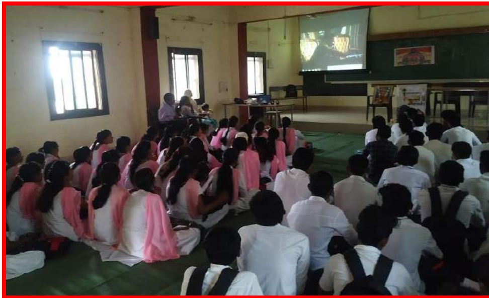
Celebration 'Kargil Victory Day'