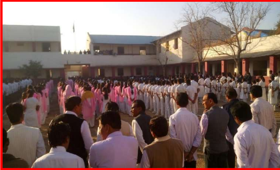
Participation Students in 'Republic Day'