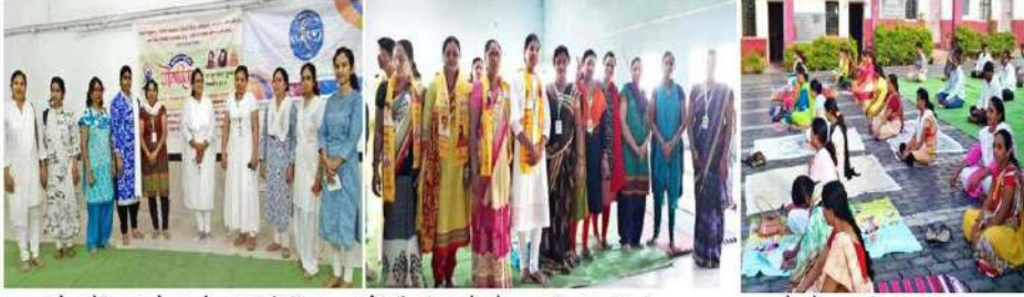
यवतमाळ : नेहरू स्टेडियमचा झालेल्या कार्यक्रमात सहभागी तनिष्का सदस्य. नेर : झेंडा संकुलत योगासने काताना तनिष्का सदस्य व इतर.