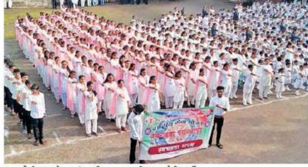
स्वच्छतेची शपथ घेताना मुंगसाजी महाराज महाविद्यालयाचे विद्यार्थी.