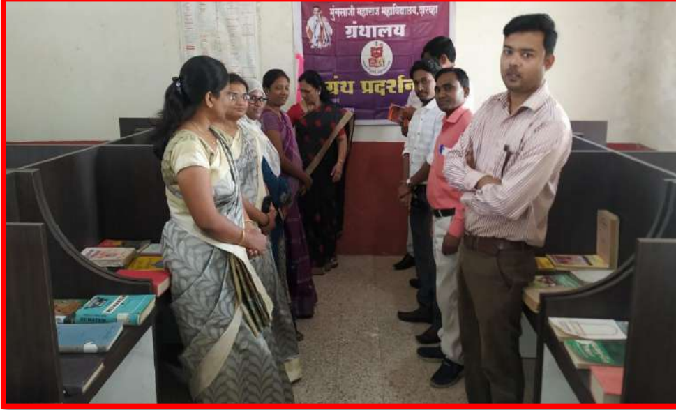
Book Exhibition on Reading Inspiration Day & A.P.J Kalam Birth Anniversary