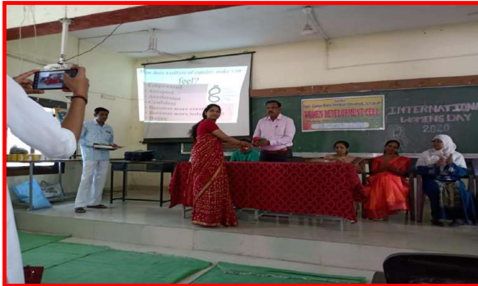
Celebration of International Women Day