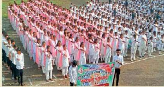
दारव्हा : स्वच्छतेची शपथ घेताना महाविद्यालयीन विद्यार्थी व प्राध्यापक वगैरे.

स्थानिक मुमुसाजी महाराज महाविद्यालय येथील राष्ट्रीय सेवा योजना विभागातर्फे स्वच्छता पंधरवड्यात फोटो प्रेझेंटेशनचे