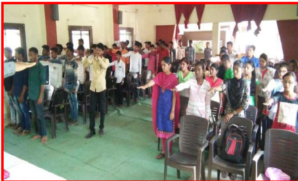
NSS Volunteer taken 'National Intergration Pledge'