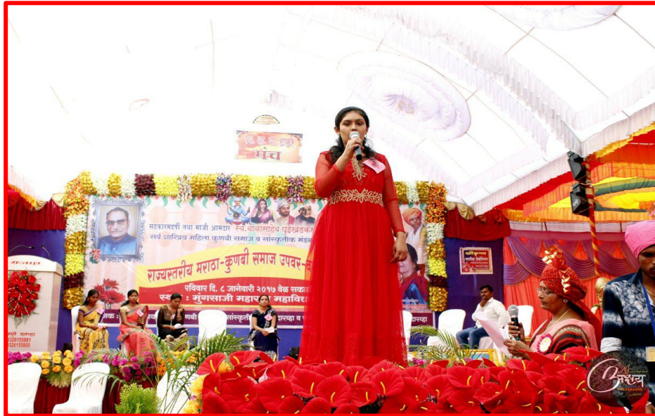
Kunbi Samaj Melava. Vadhu and Var giving their introduction