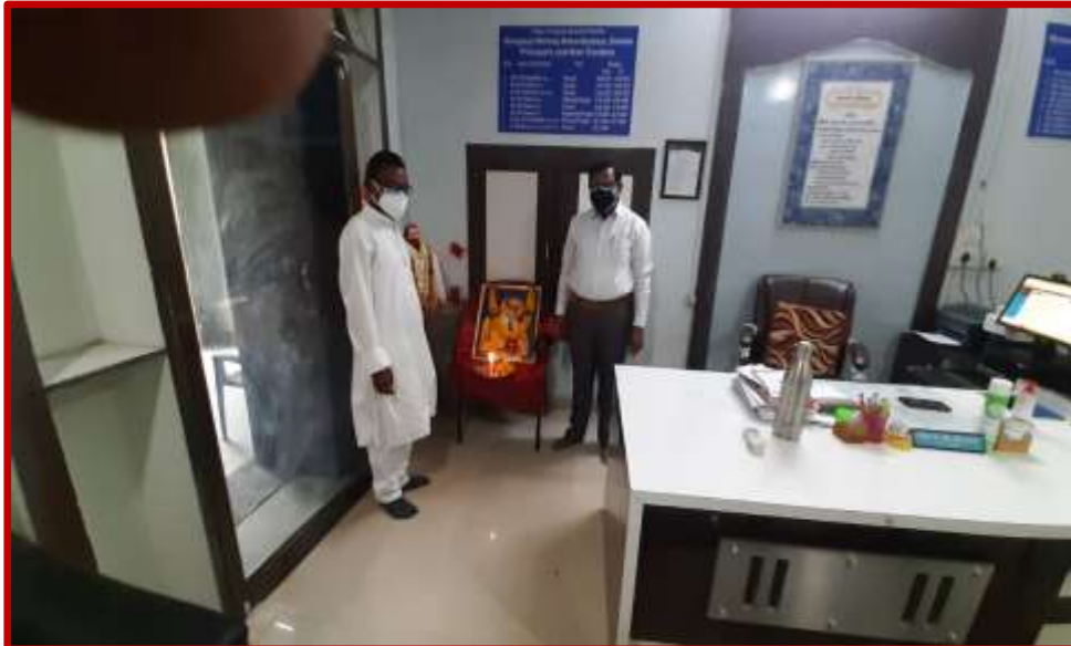
Dr Babasaheb Ambedkar's Mahaparinirwan Day