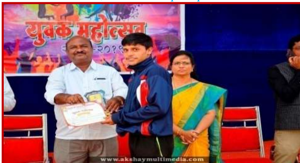
Prize Distribution to participant