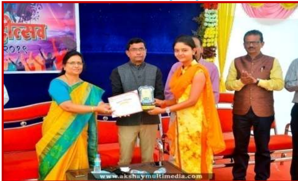
Prize Distribution to participant