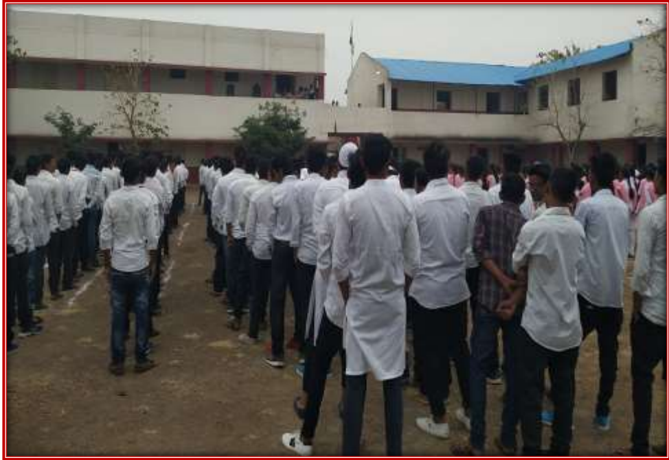
Republic Day celebration