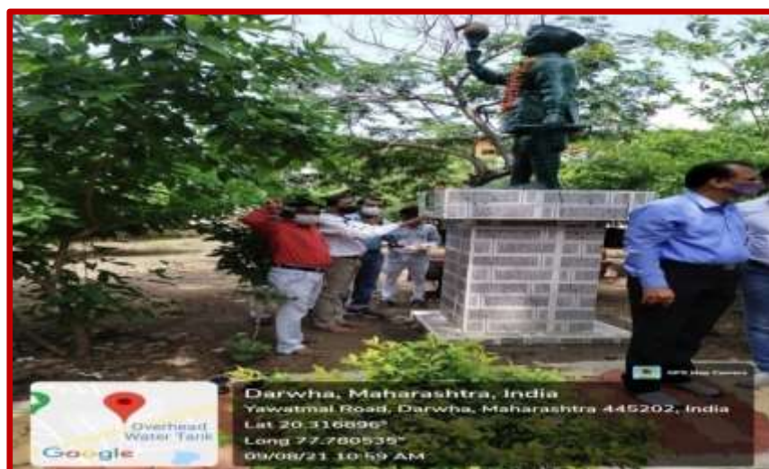
Celebration of August Kranti Day