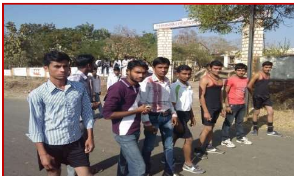
Participation of students in running competition