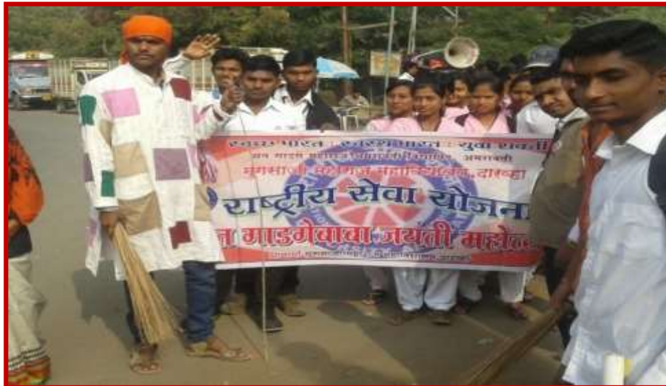
Cleanliness Awareness Rally Participation of students in Youth Festival (Games & Sports)