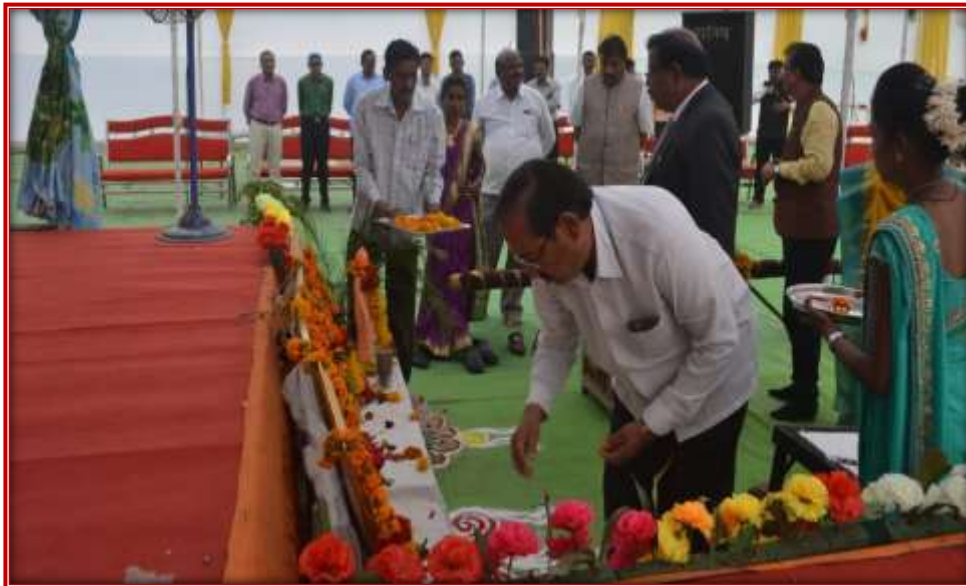
Swami Vivekanand & Rashtramata Jijau birth Anniversary