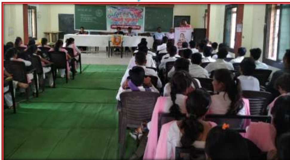
N.S.S. Day celebration