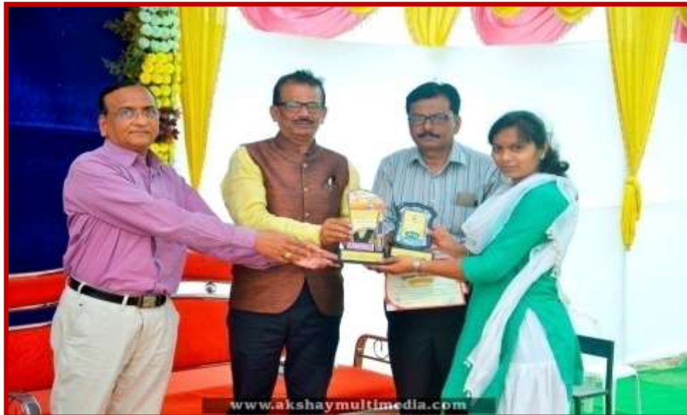
Prize Distribution to participant