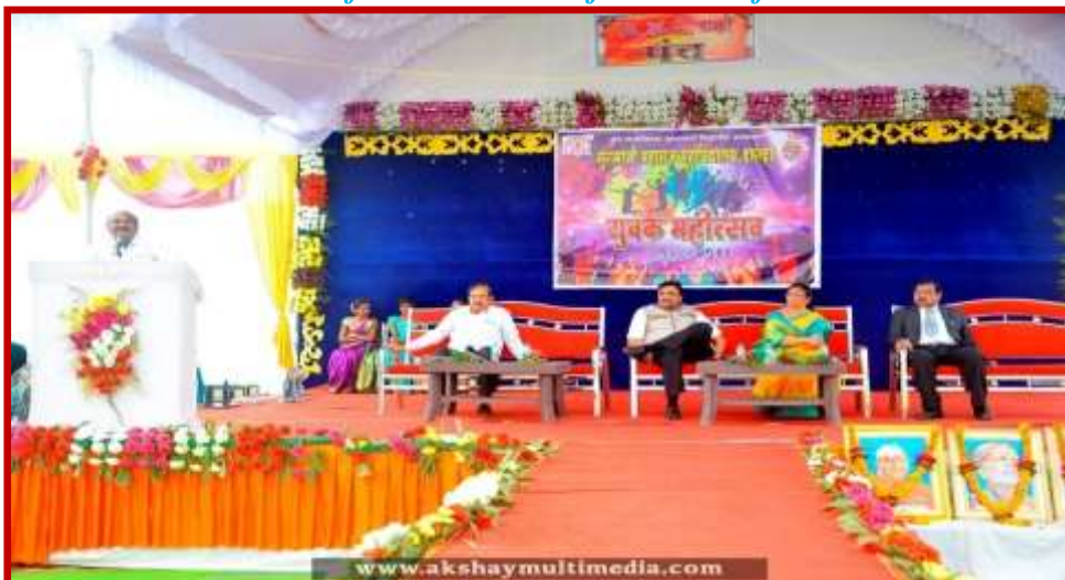
The Guest for the felicitation function