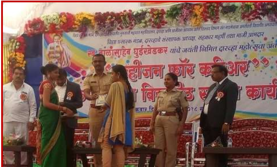
Prize distribution ceremony of the participants of Youth Festival