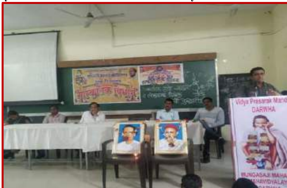
Lokshahir Annabhau Sathe Birth Anniversary & Death Anniversary of Lokmanya Tilak