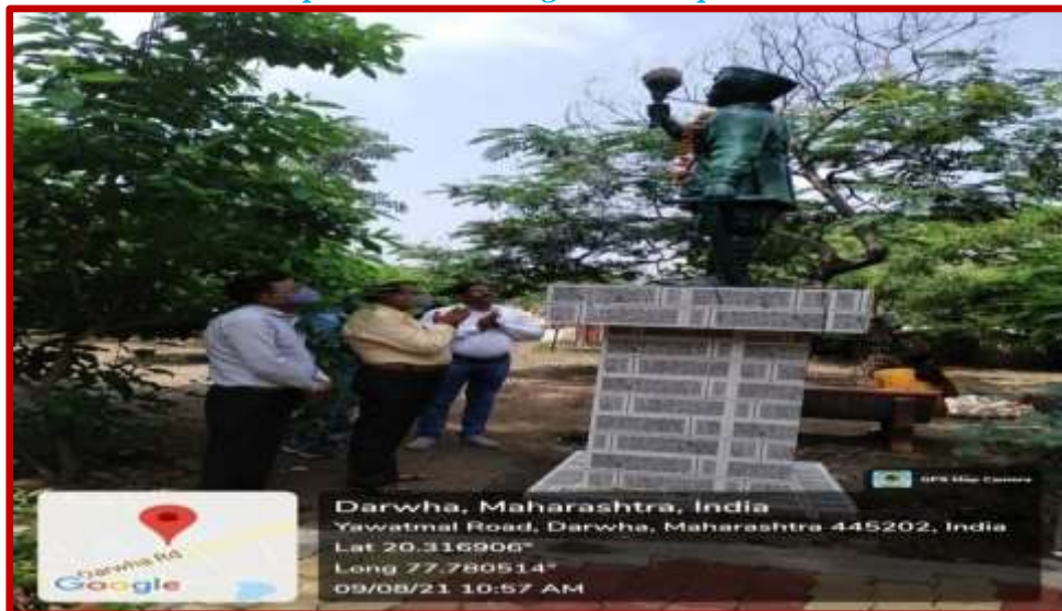
August Kranti Day celebration (Netaji Subashchandra Bose)