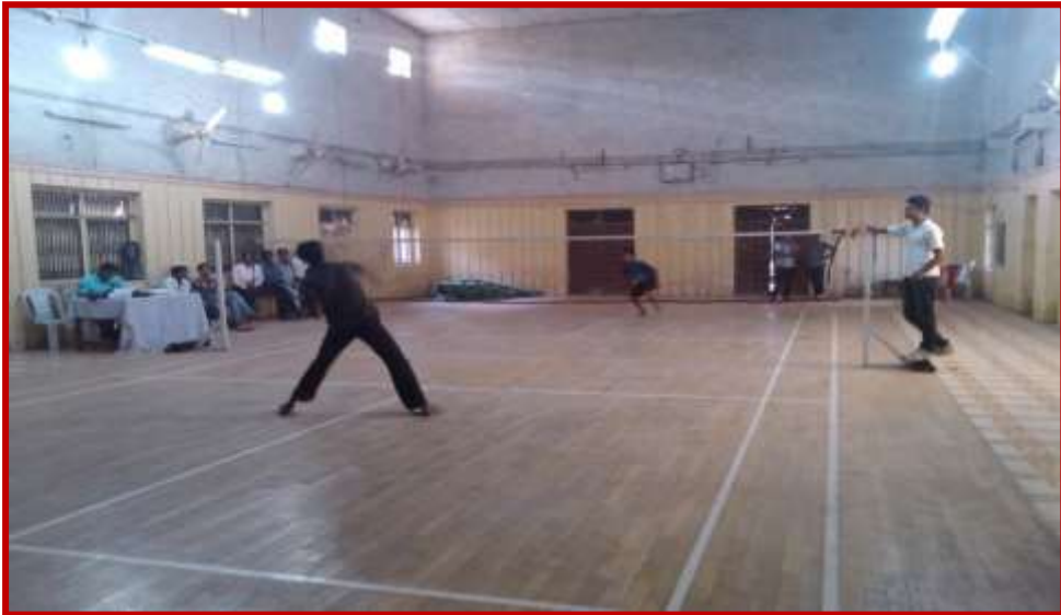
Participation of students in intercollegiate badminton competition