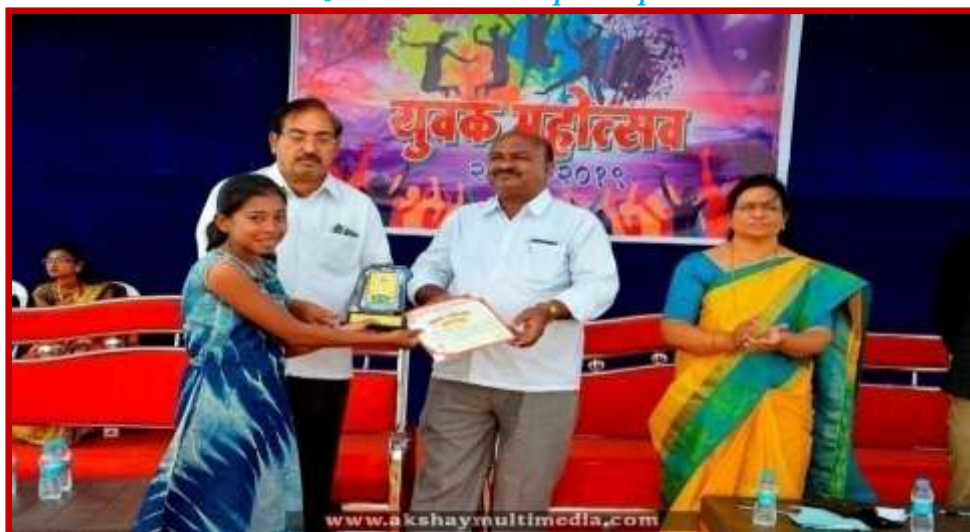
Prize Distribution to participant