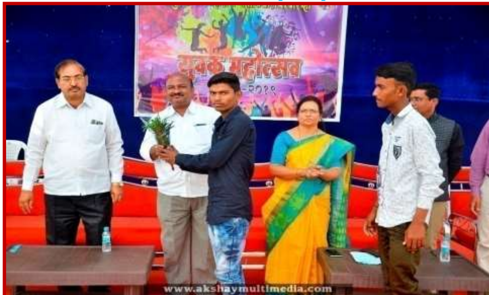
Prize Distribution to participant