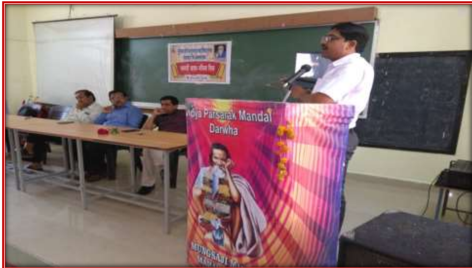
Dr. Chatur delivering his speech (Mother Tongue Day)