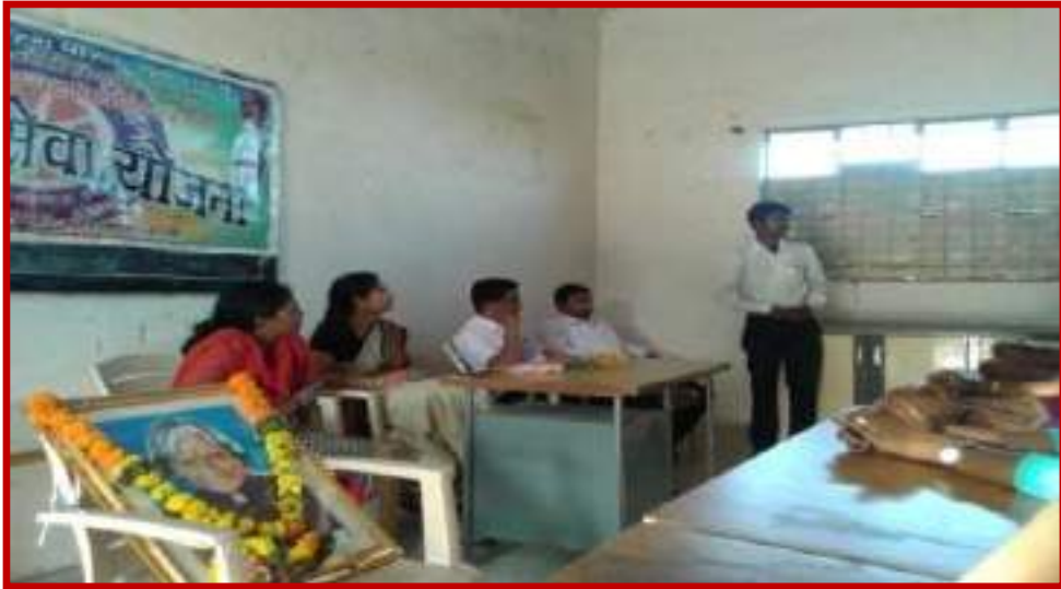
A P J Abdul Kalam Birth Anniversary & Reading Habit Inspiration Day