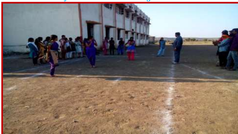
Running team (Women) participation in Youth Festival