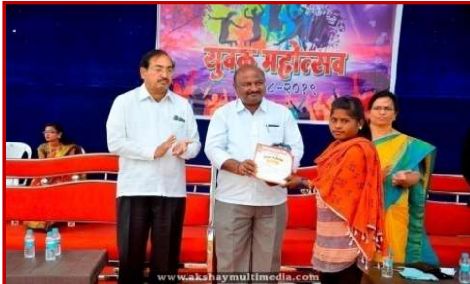
Prize Distribution to participant