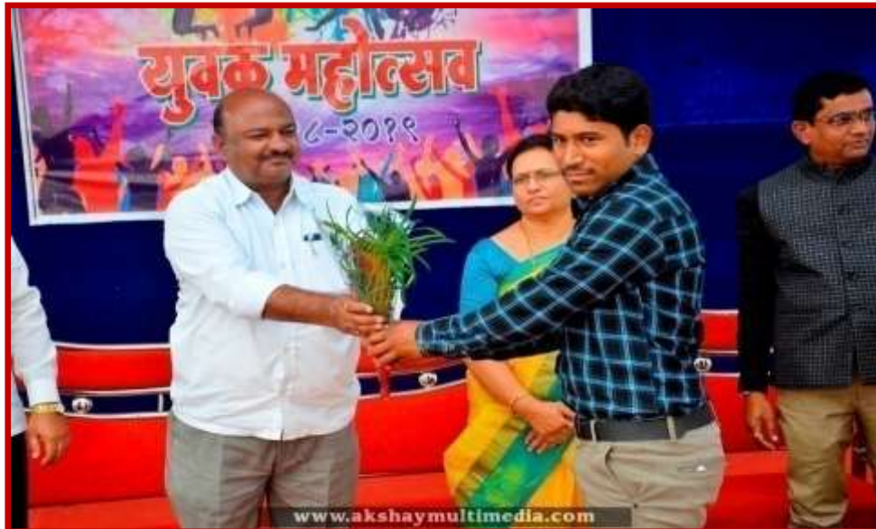
Prize Distribution to participant