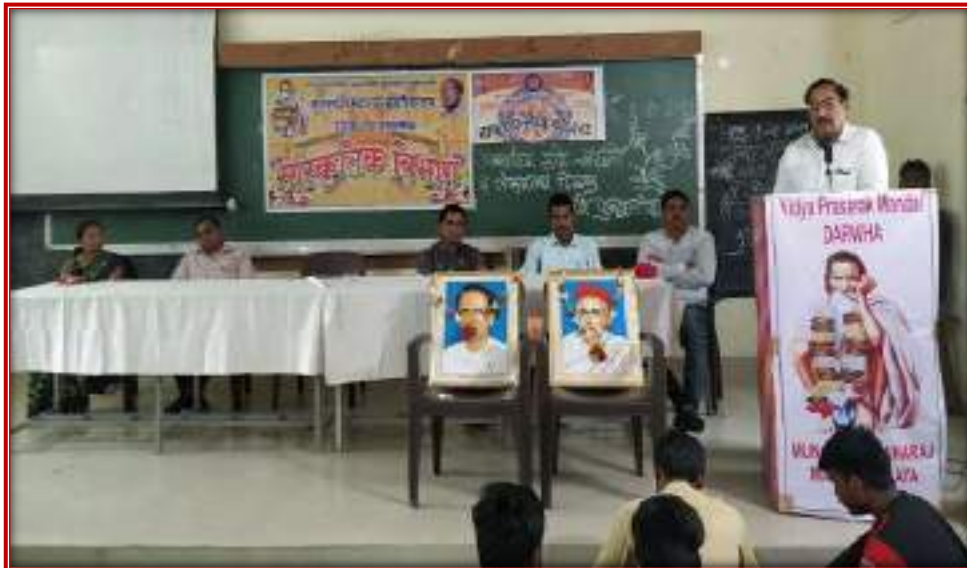
Annabhau Sathe birth & Lokmanya Tilak death Anniversary celebration