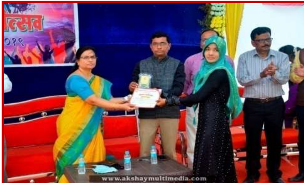
Prize Distribution to participant