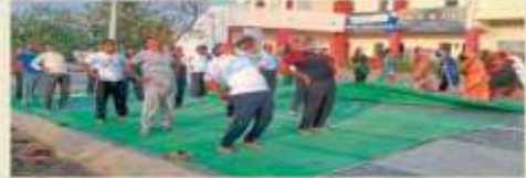
कार्यवाही : मंत्रालयी महाराज महाविद्यालयवात आंतरराष्ट्रीय योग दिवसानिमित्त योगाचे शब्द घेताना कार्यवाही न विद्यार्थी.