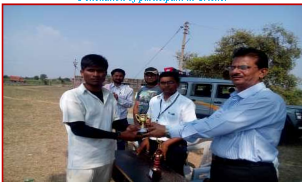
Felicitatation of participant in Cricket