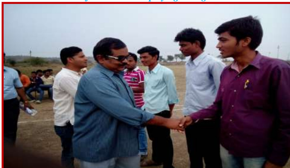
Introduction of Valley Ball players with the guest