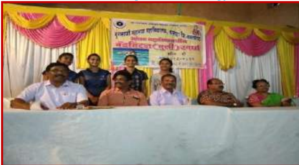
Organization of Inter-collegiate zone Badminton(Women) Tournament