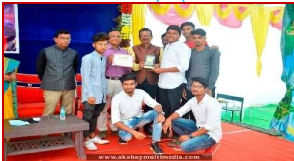
Prize Distribution to participant team