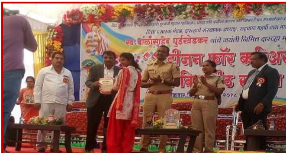
Prize distribution ceremony of the participants of Youth Festival