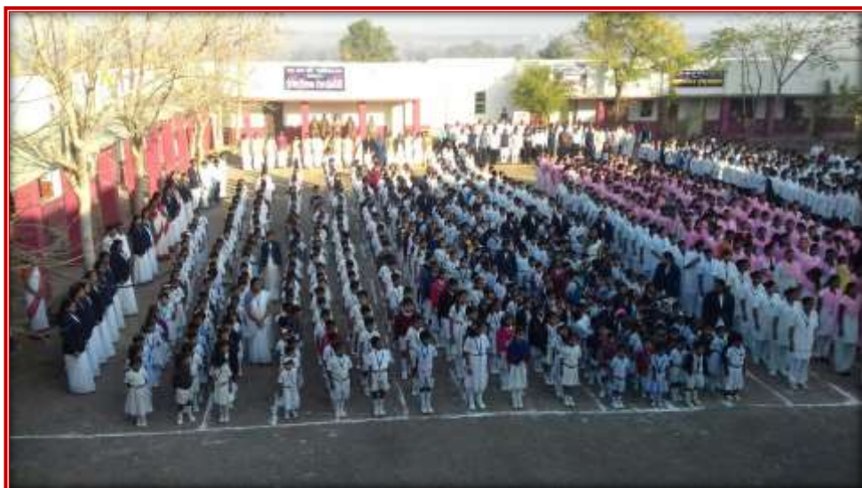
Participation of students in Republic Day Celebration