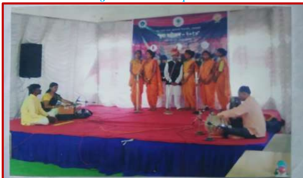
Group Song Competition