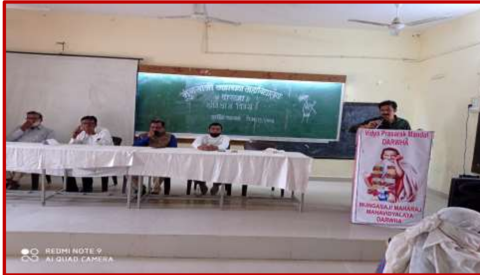
Teacher Day Celebration