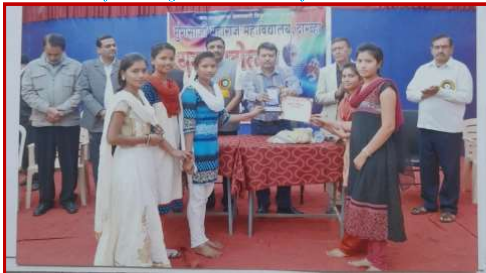
Folk Dance-First Prize winner team felicitated for their achievement