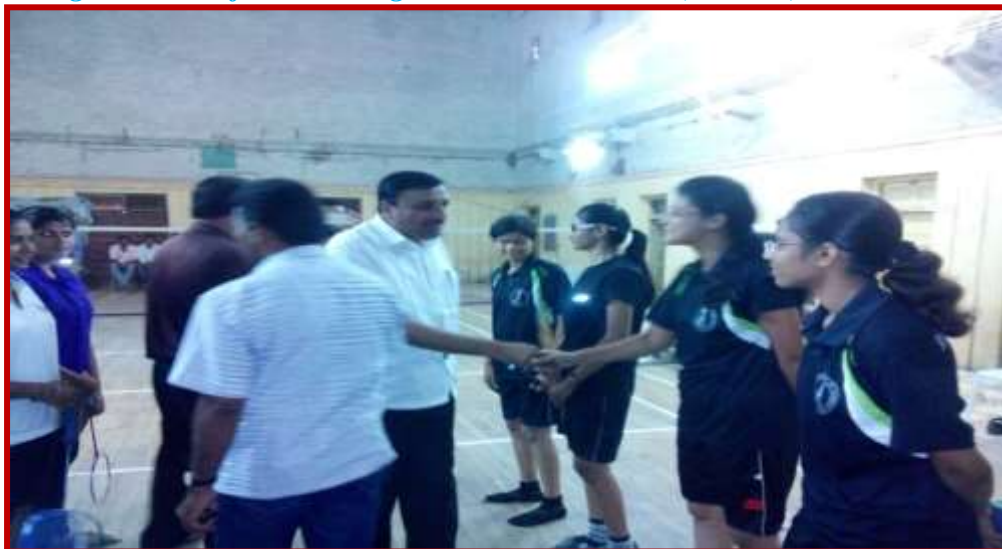
Organization Badminton(Women) Tournament