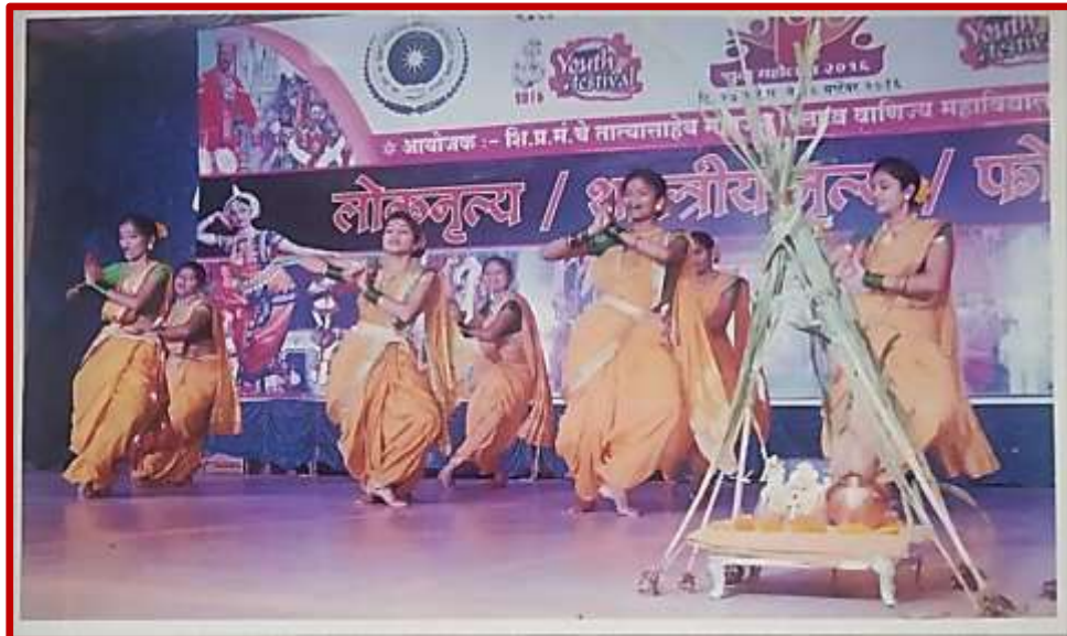
Folk Dance Competition