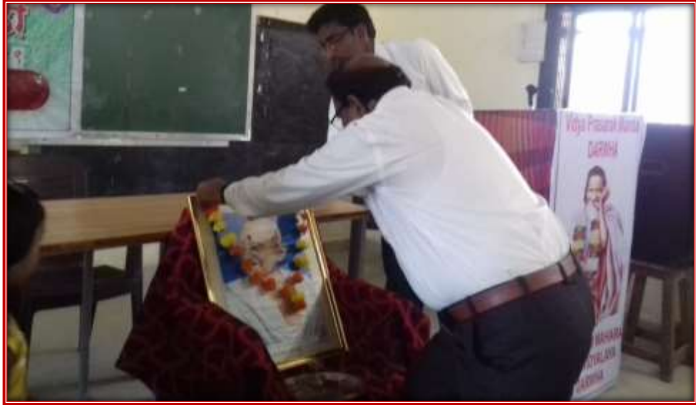
Mahatma Gandhi birth anniversary celebration