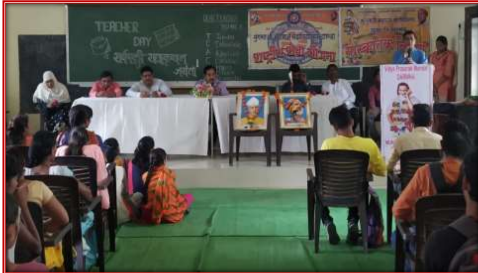
Teacher Day celebration