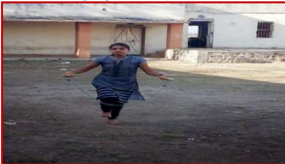
Skipping Competition(Women) in Youth Festival