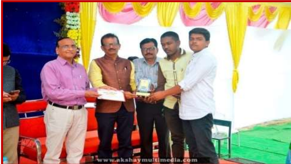
Prize Distribution to participant team