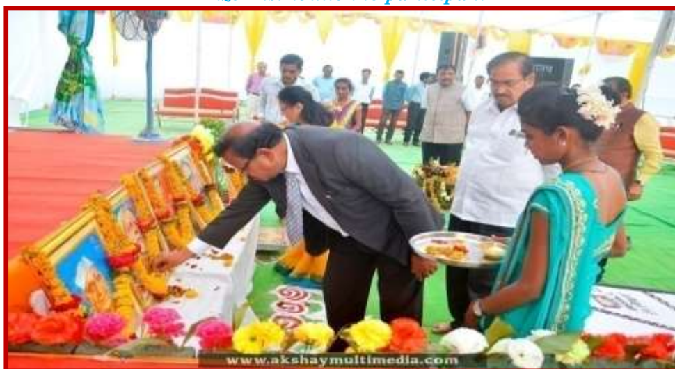
The Principal Worshipping