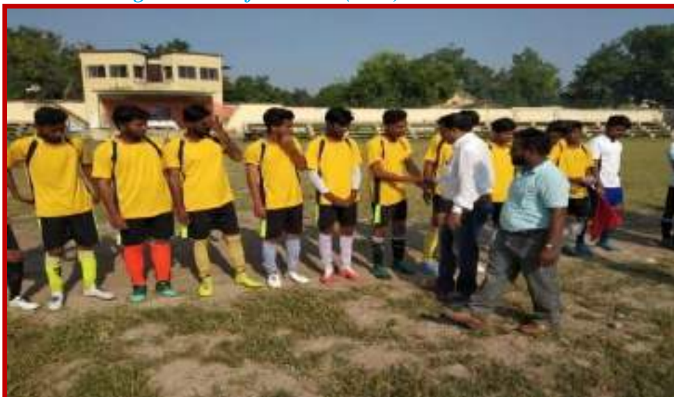
Organization of Football (Men)Zone Tournament