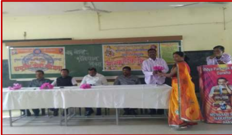
Constitution Day Celebration 29 November