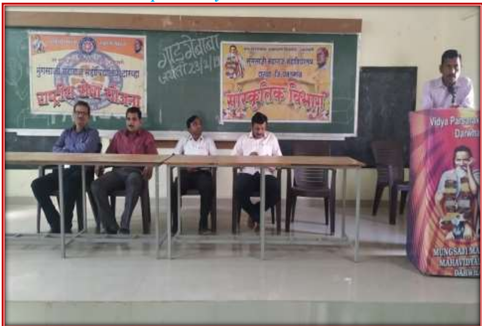
Vairaghya Murti Shri Sant Gadge baba birth Anniversary