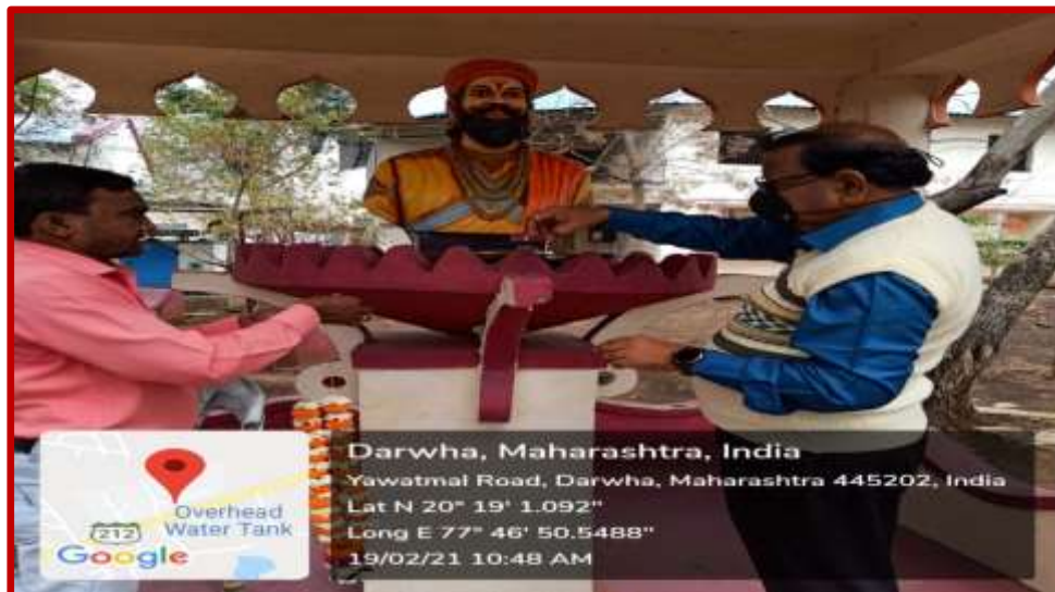
Birth Anniversary of Chatrapati Shivaji Maharaj