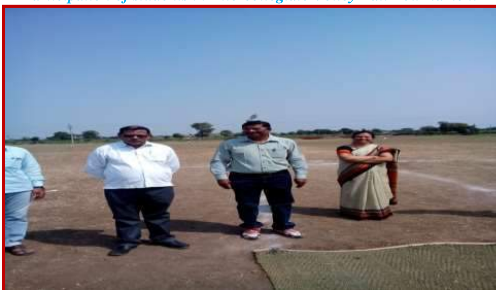
Staff of the institution on the ground