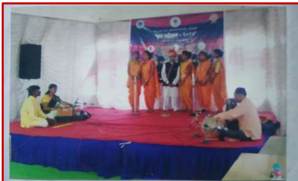
Group Song Competition