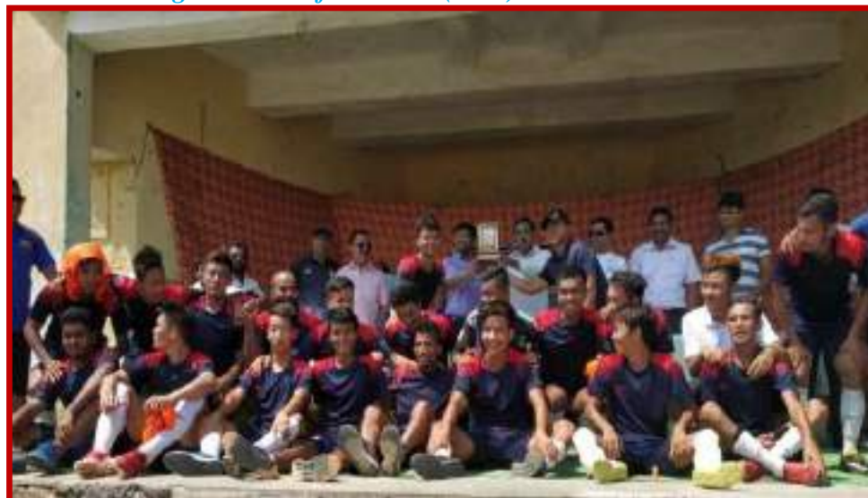
Organization of Football (Men)Zone Tournament