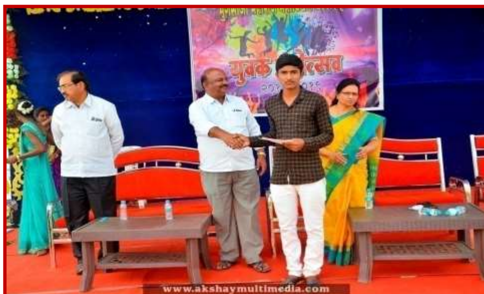
Prize Distribution to participant