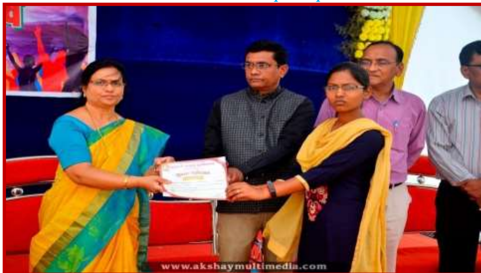
Prize Distribution to participant