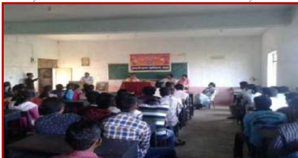
Teacher Day celebration