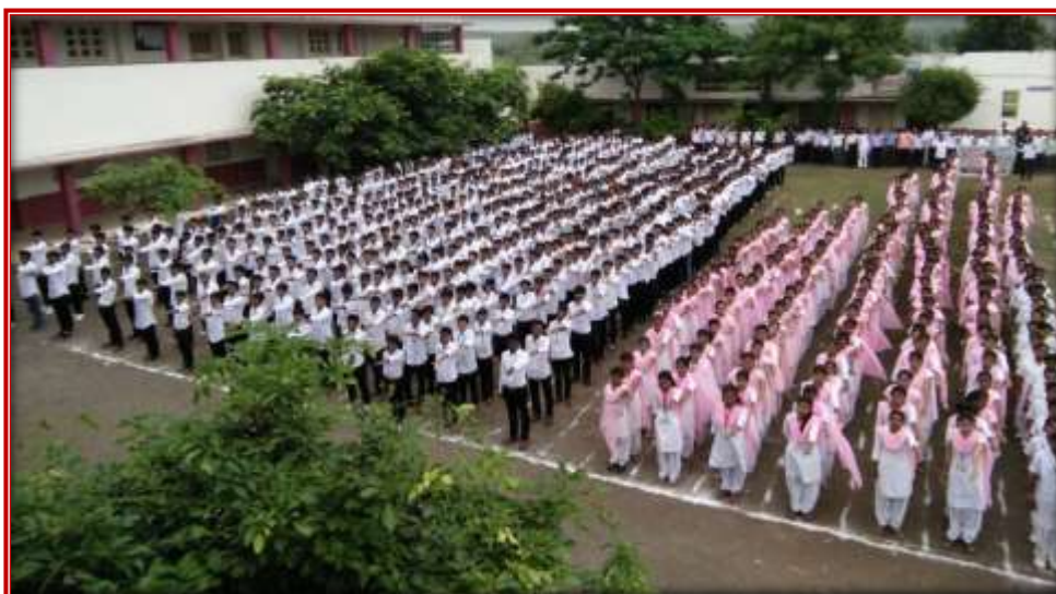
Independence Day Celebration