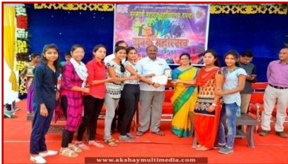
Prize Distribution to participant team