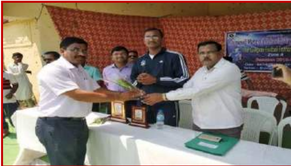
Organization of Football (Men)Zone Tournament