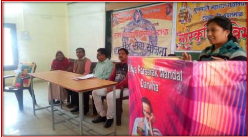
Birth Anniversary of Kranti Jyoti Savitribai Phule