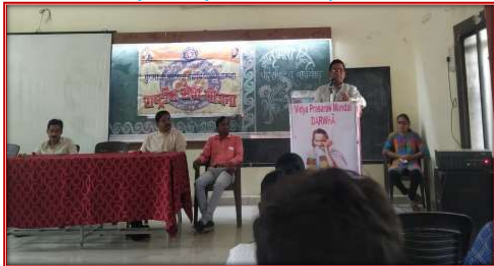
Mother Tongue Day Celebration