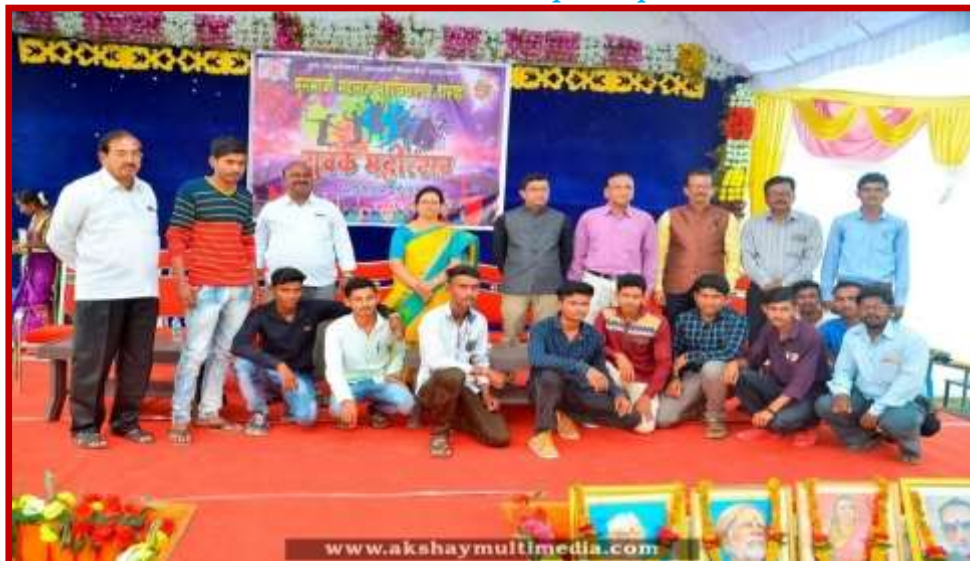
Prize Distribution to participant team