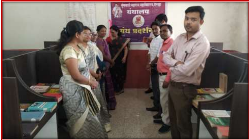
Books exhibition on account of Reading habit inspiration Day