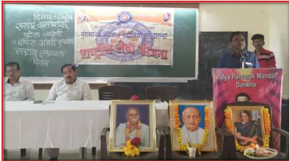
Sardar Vallabhbhai Patel birth & Indira Gandhi death Anniversary celebrated as a National integration Day