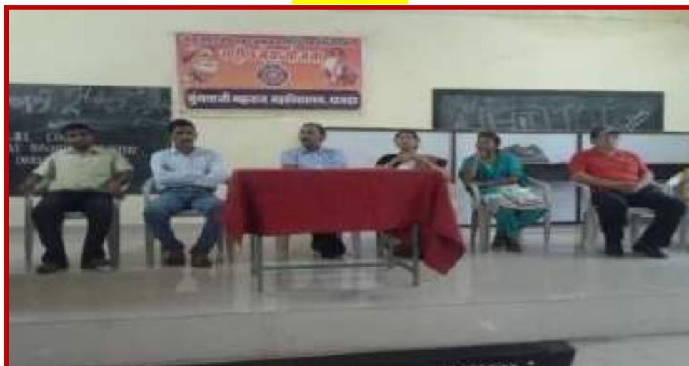
Lokmanya Tilak Death and Annabhau Sathe Birth Anniversary celebration