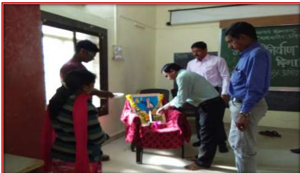
Dr. B. R. Ambedkar's Mahaparinirwan Din