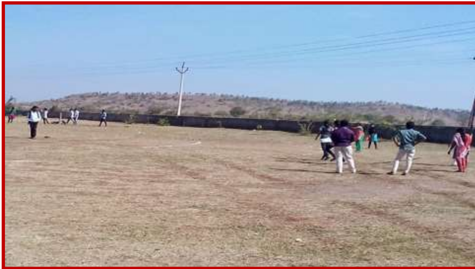
Throwing competition(women) in Youth Festival