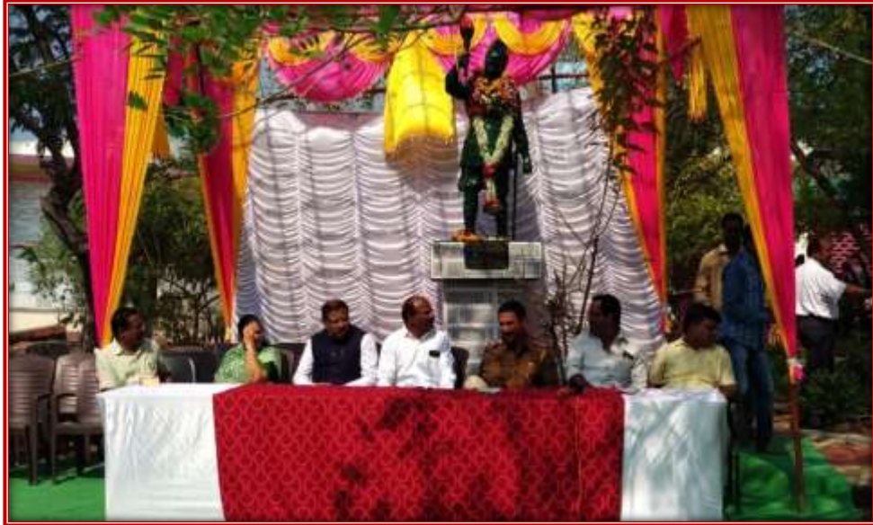
Subhashchandra Bose birth anniversary