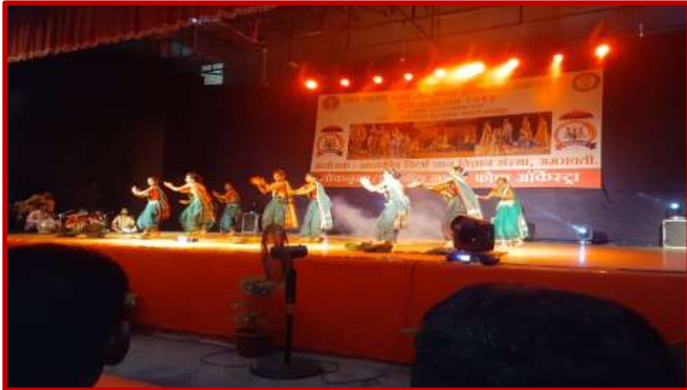
Folk Dance Competition