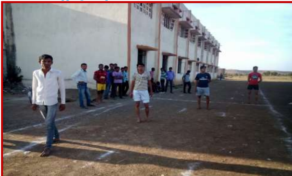
Running Competition(Men) in Youth Festival