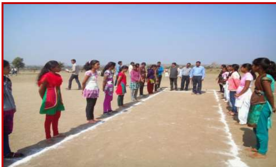
Introduction of Kho-Kho team with the guest in Youth Festival