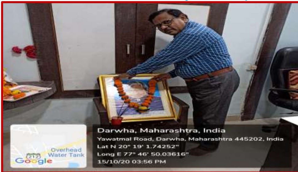
Dr. APJ Abdul Kalam birth anniversary