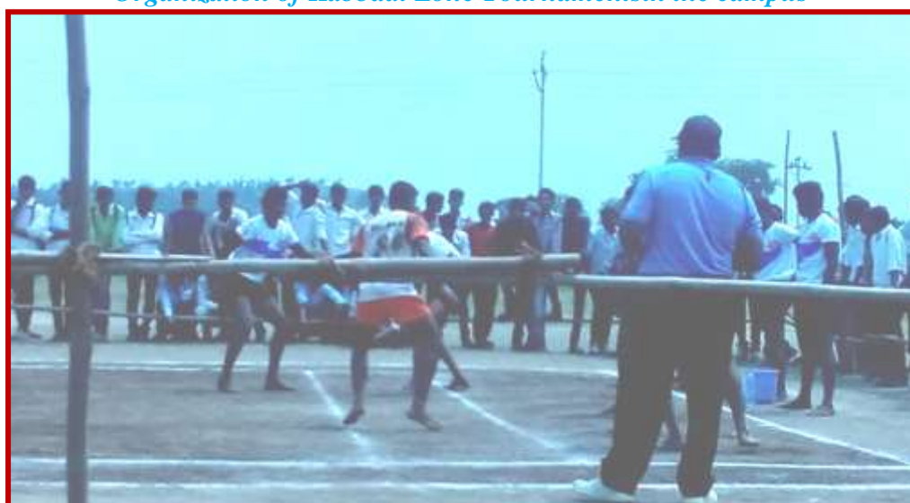
Organization of Kabbadi Zone Tournaments in the campus