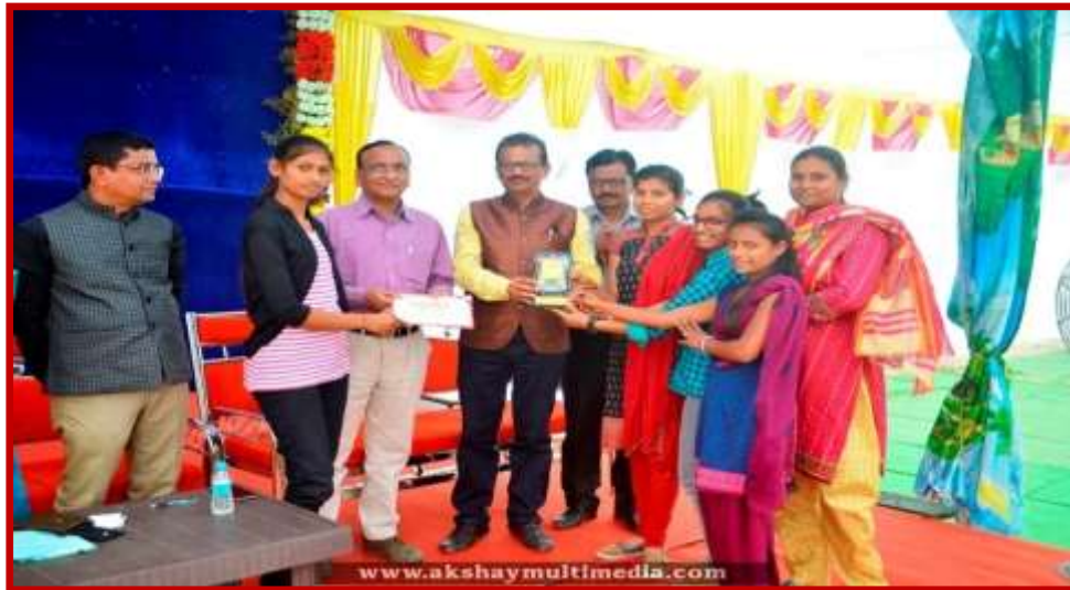
Prize Distribution to participant team