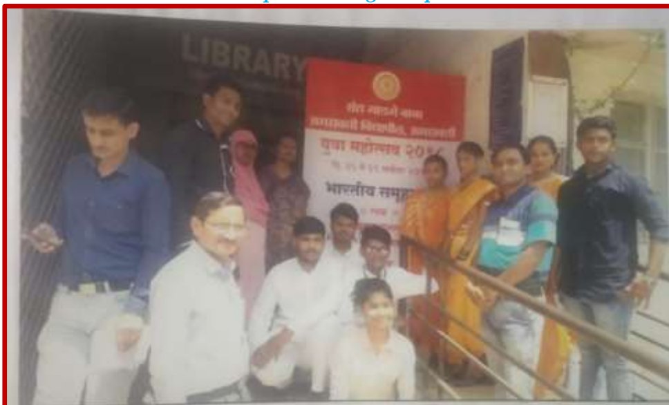
Group Photo of Group Song team with Prof-In-Charge