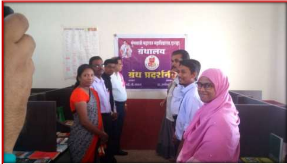
Book exhibition on reading habit inspiration Day