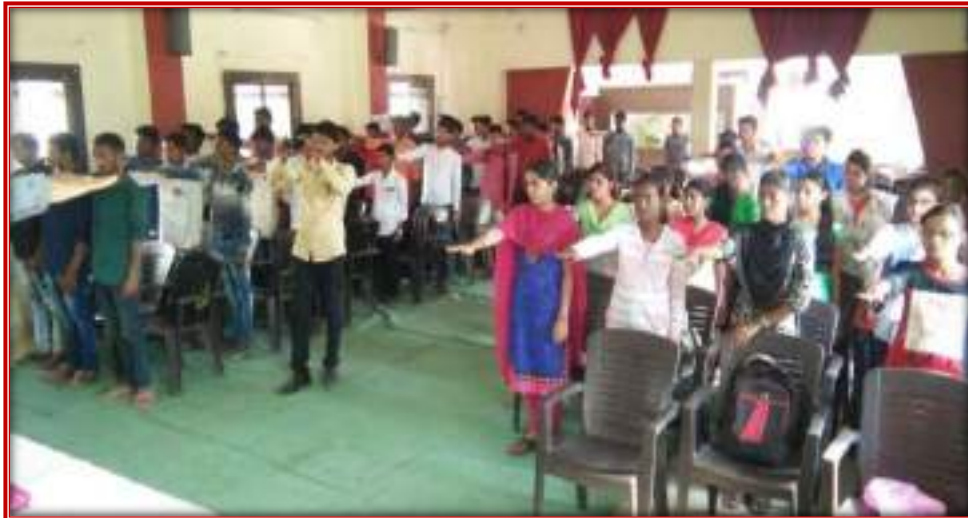
Celebration of National Integration Day