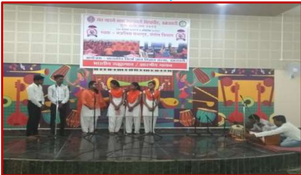
Group Song Competition