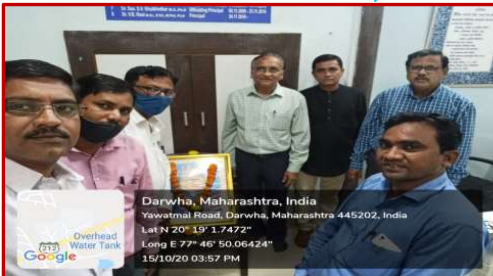
Birth Anniversary of Dr. APJ Abdul Kalam