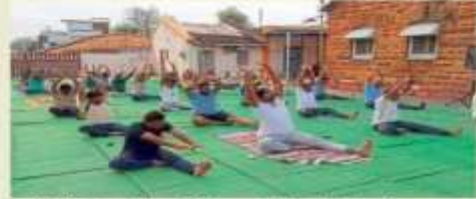
वर्षी : पाठ्यक्रमाच्या प्रांगणात योग कलाताना अधिकारी कार्यकारी.