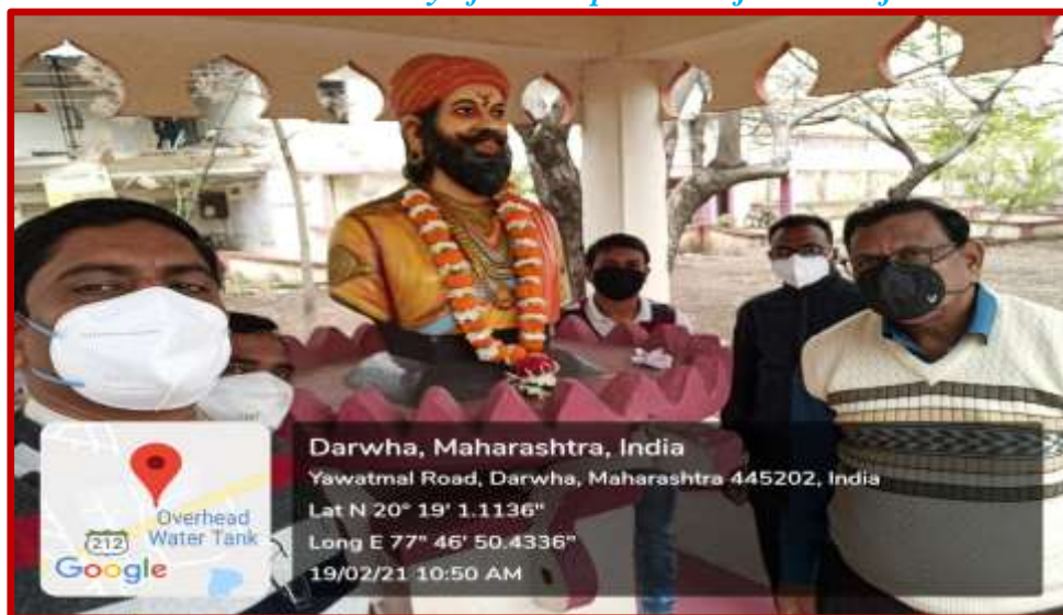
Birth Anniversary of Chatrapati Shivaji Maharaj