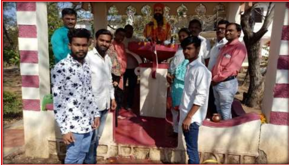
Shivaji Maharaj Birth Anniversary