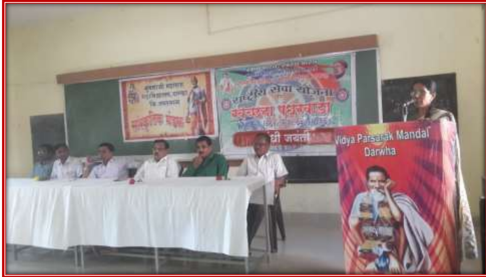
Mahatma Gandhi Birth Anniversary