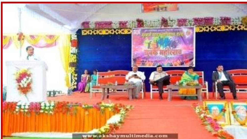
Youth Festival guest on the dais