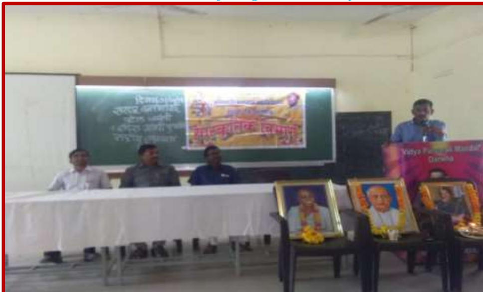
Sardar Patel Birth & Indira Gandhi Death Anniversary