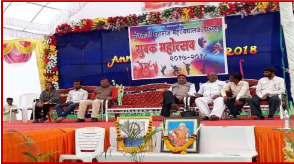
Inauguration of Youth Festival