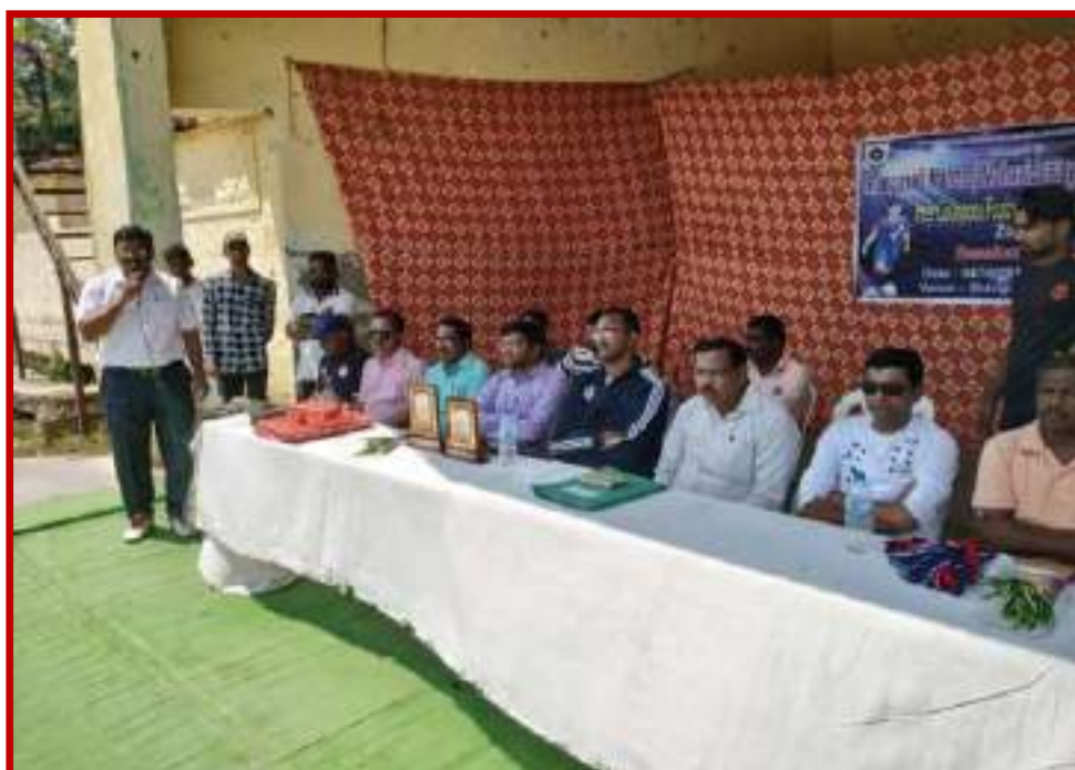
Organization of Football (Men)Zone Tournament