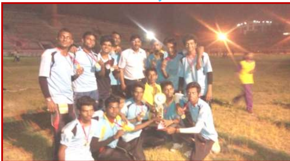
Felicitatation of the team