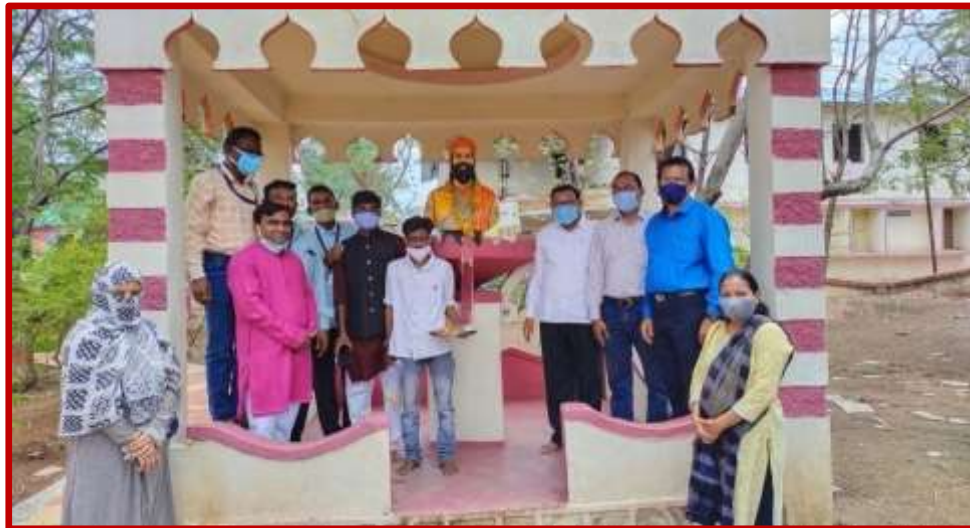
Birth Anniversary of Chatrapati Shivaji Maharaj