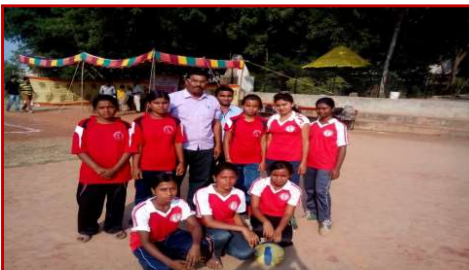
Participation of students in Intercollegiate Volley Ball Tournament