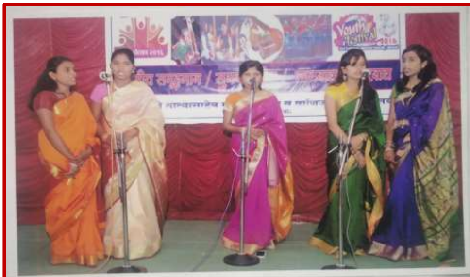
Group Song Competition