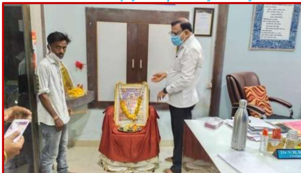
Birth Anniversary of Chatrapati Shivaji Maharaj