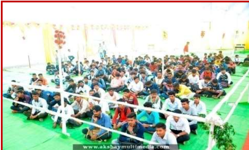
Presence of the students in felicitation function