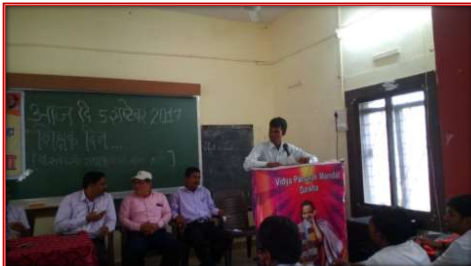
Teachers' Day Celebration