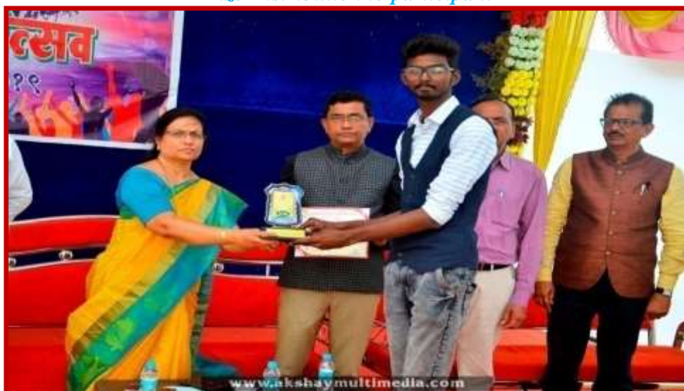
Prize distribution to participant