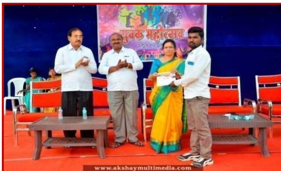
Prize Distribution to participant