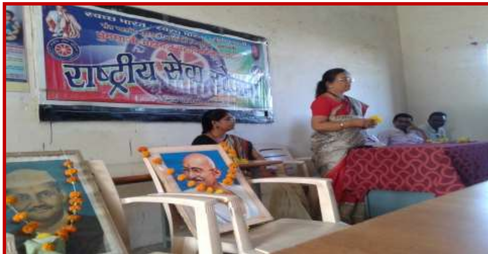
Mahatma Gandhi Birth Anniversary Celebration