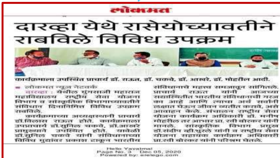
News of activities organized published in News papers