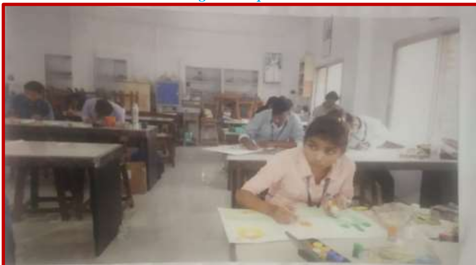
On The Spot Painting Competition