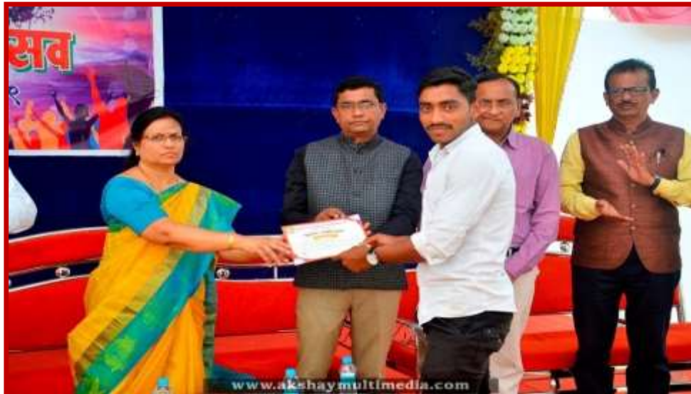
Prize Distribution to participant