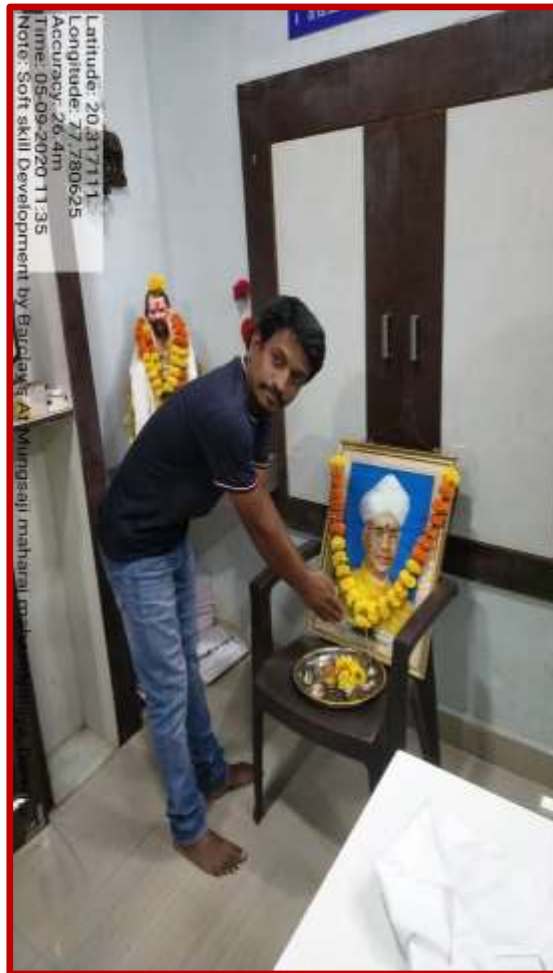
Teacher Day Celebration