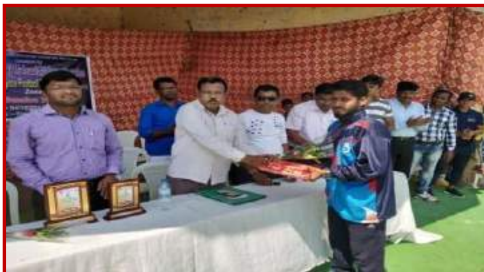
Organization of Football (Men)Zone Tournament