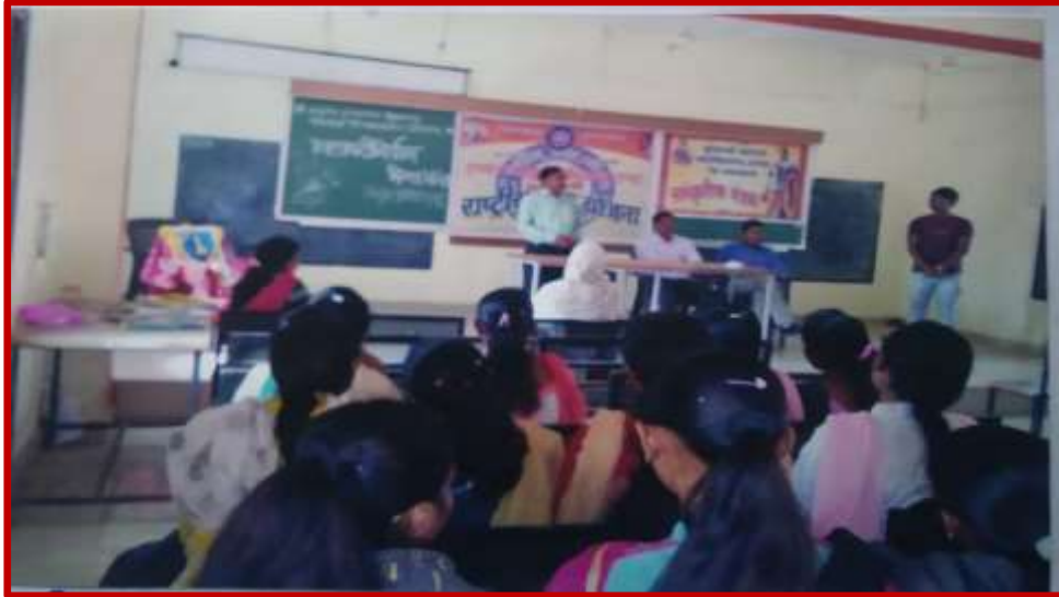
Dr. Babasaheb Ambedkar Mahaparinirvan Din