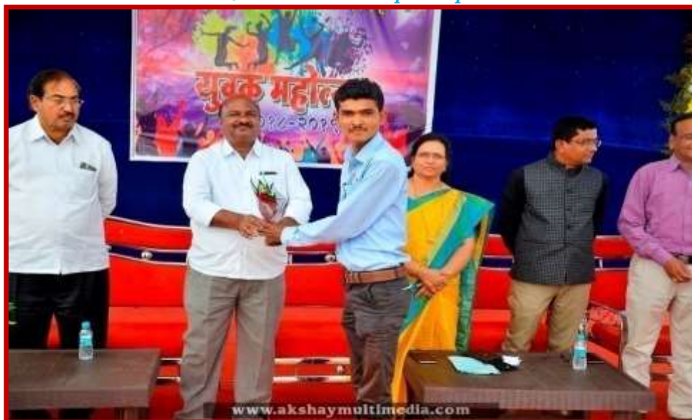
Prize Distribution to participant