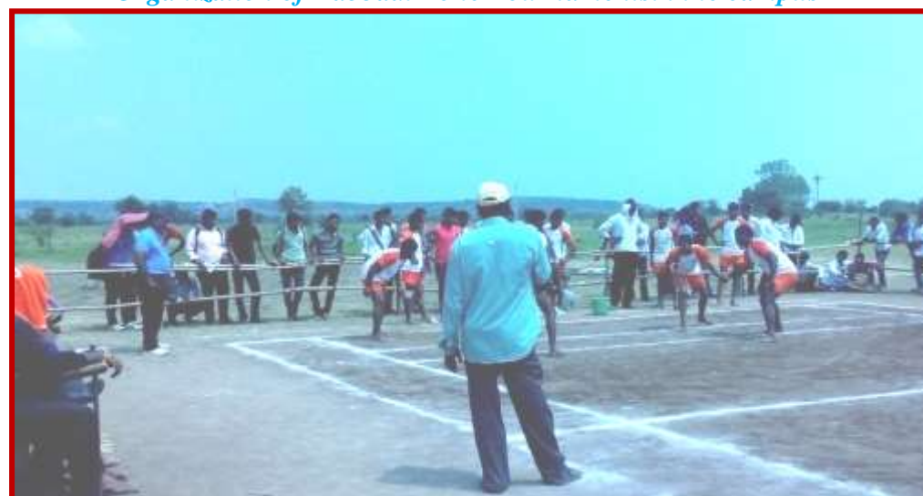
Organization of Kabbadi Zone Tournaments in the campus