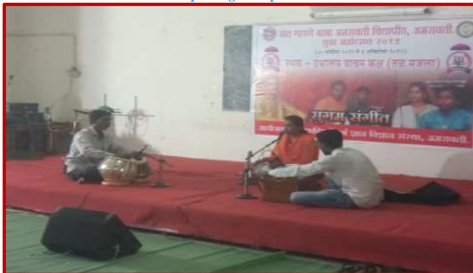
Youth Festival Student Performing Light Vocal Solo