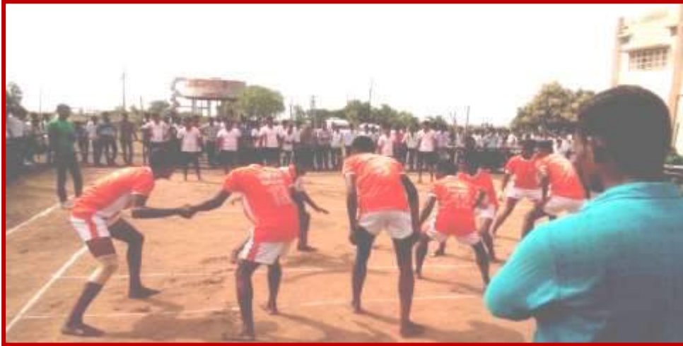
Intercollegiate Tournament of Kabbaddi