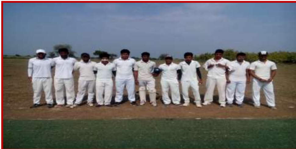
Intercollegiate Tournament of Cricket