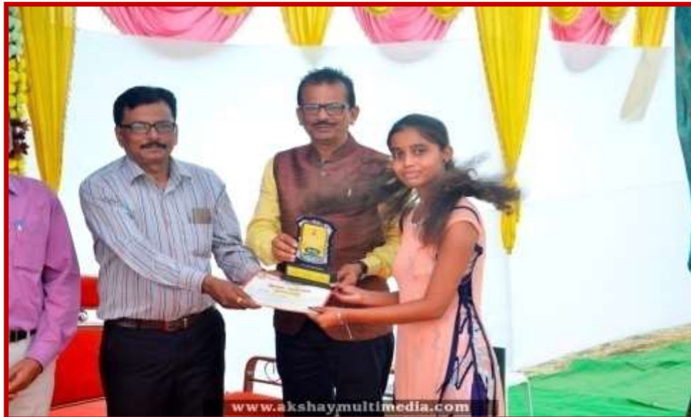
Prize Distribution to participant