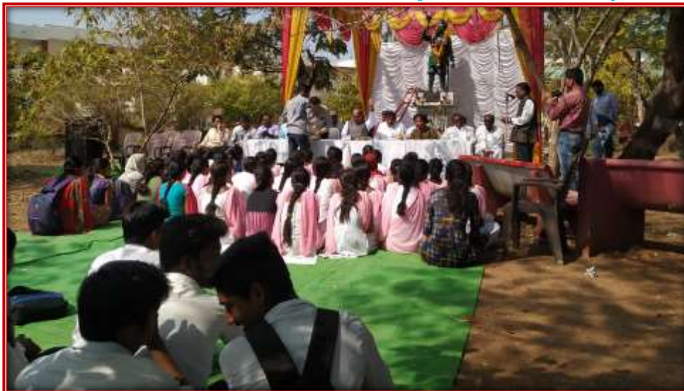
Netaji Subhashchandra Bose birth Anniversary