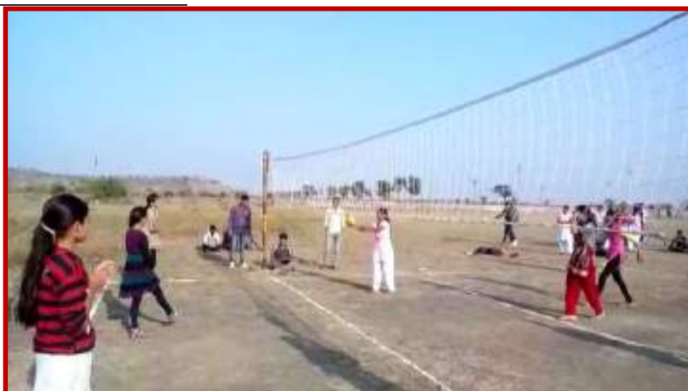
Participation of Valley Ball (Women) team in Youth Festival