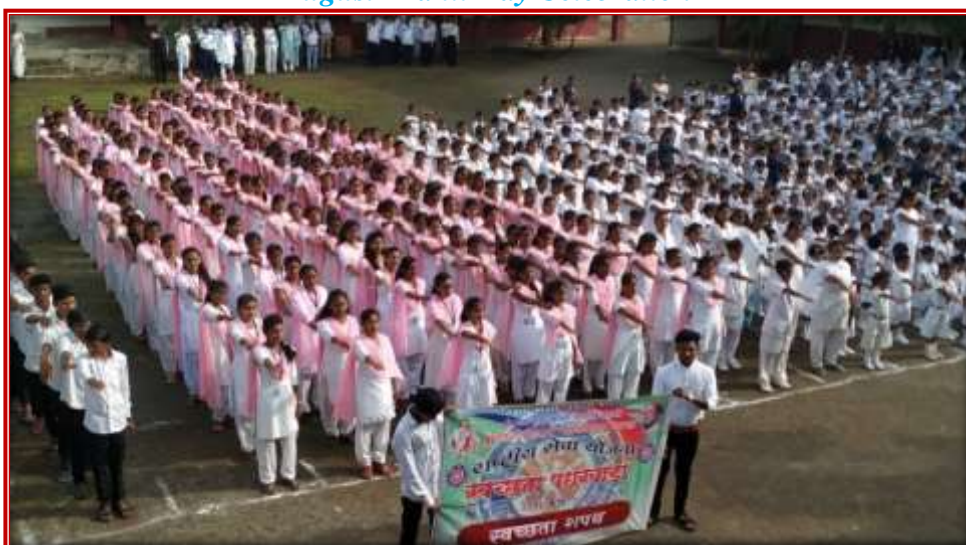
Independence Day celebration