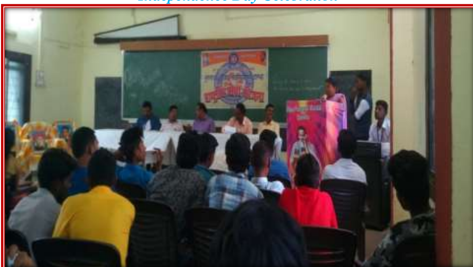
Teacher Day Celebration