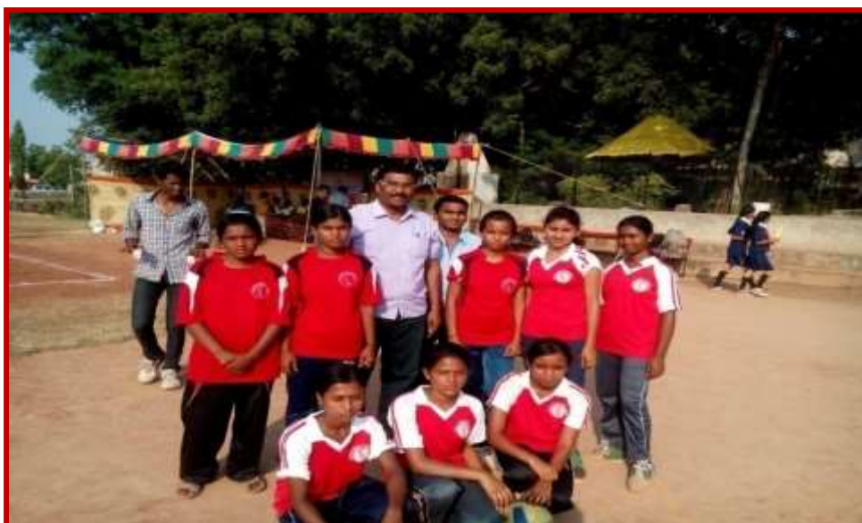
Participation of students in Intercollegiate Volley Ball Tournament