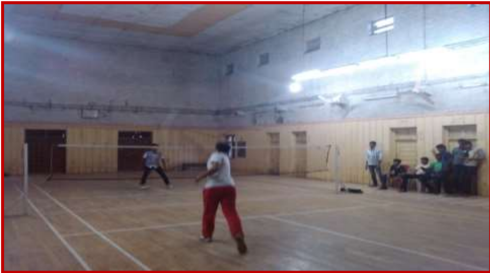
Participation of students in intercollegiate badminton competition