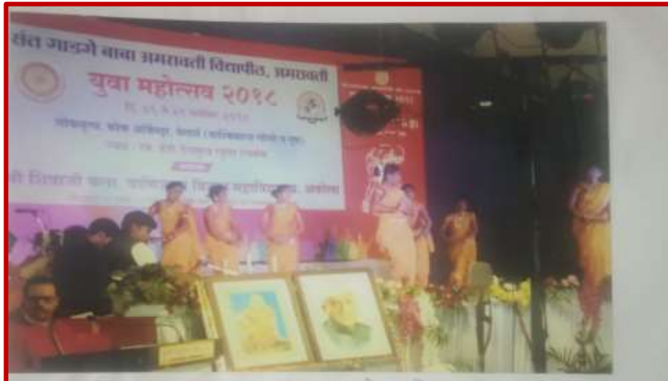
Folk Dance Competition