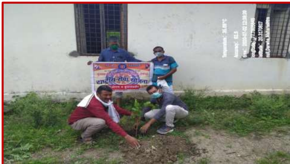
Tree plantation during covid-19 pandemic