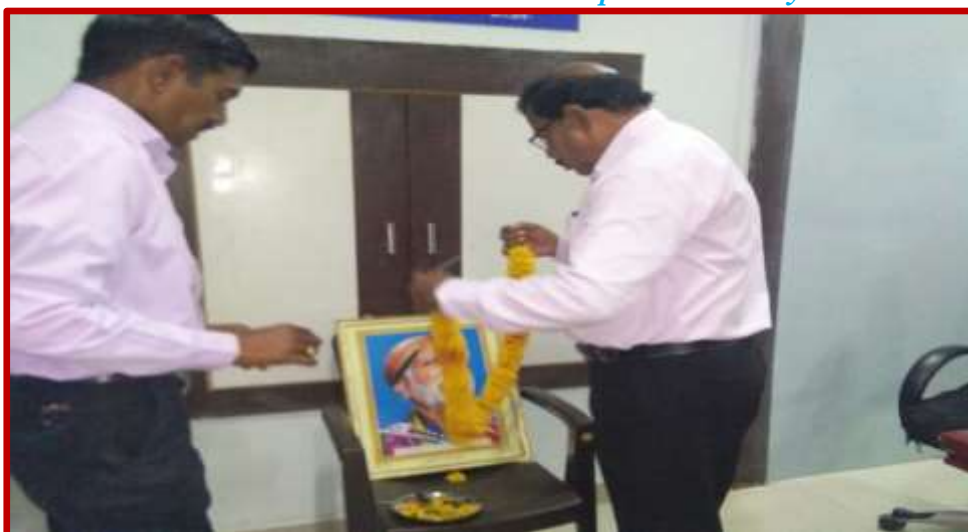
Gadge Baba Birth anniversary