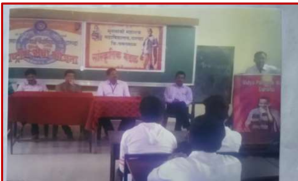
Constitution Day Celebration