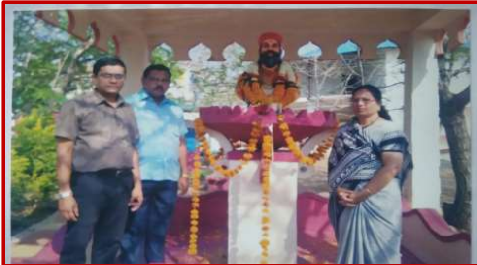
Chattrapati Shivaji Maharaj Birth Anniversary