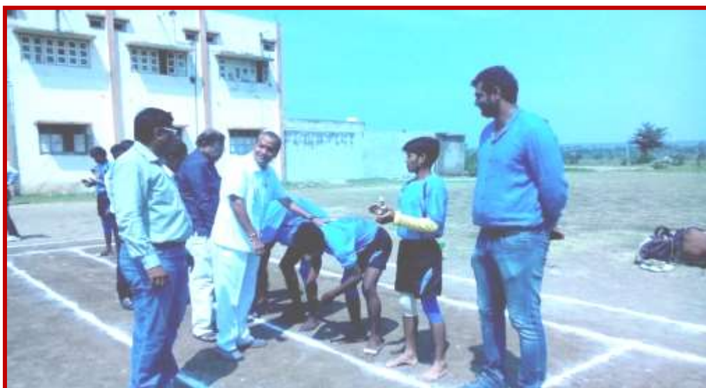
Organization of Kabbadi Zone Tournaments in the campus