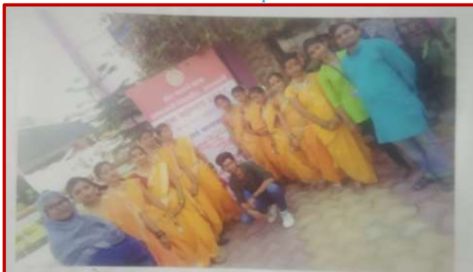
A group photo of Folk Dance team with Prof-in-Charge