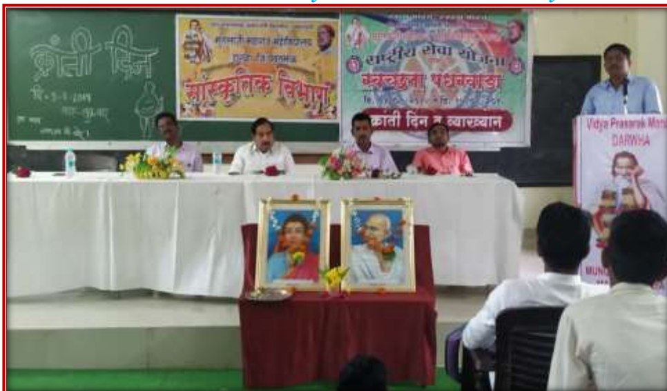
August Kranti Day Celebration