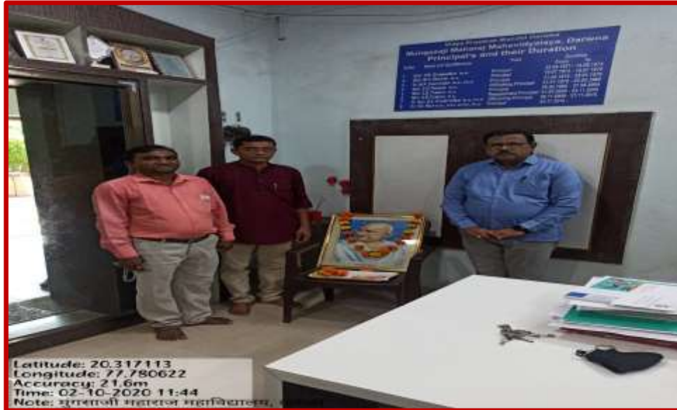
Mahatma Gandhi Birth Anniversary