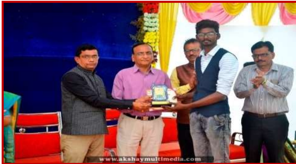
Prize Distribution to participant