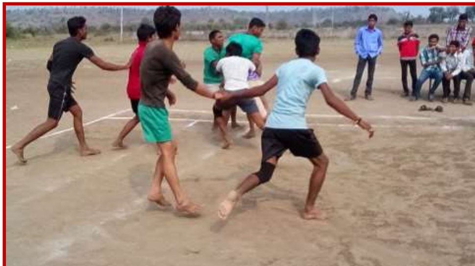
Kabbadi Team of the institution playing College Youth Festival