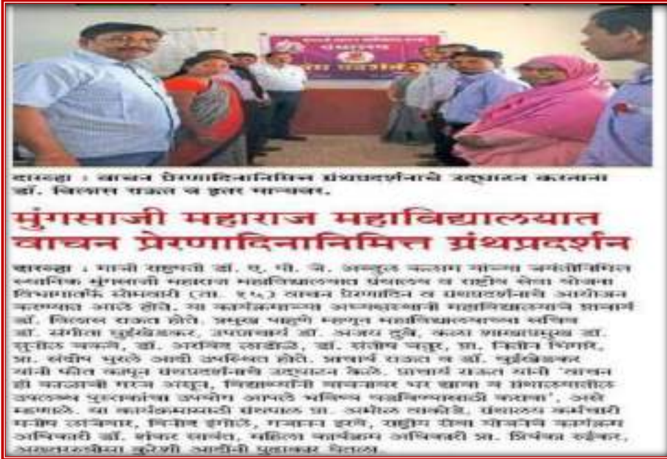
Print media coverage of 'Reading Habit Inspiration Day'