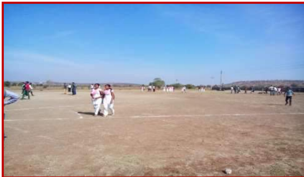
Long Jump Competition(Women) in Youth Festival