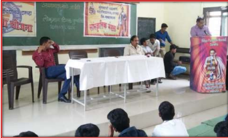
Annabhau Sathe Birth & Lokmanya Tilak death anniversary