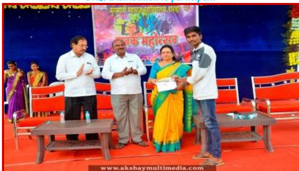
Prize Distribution to participant