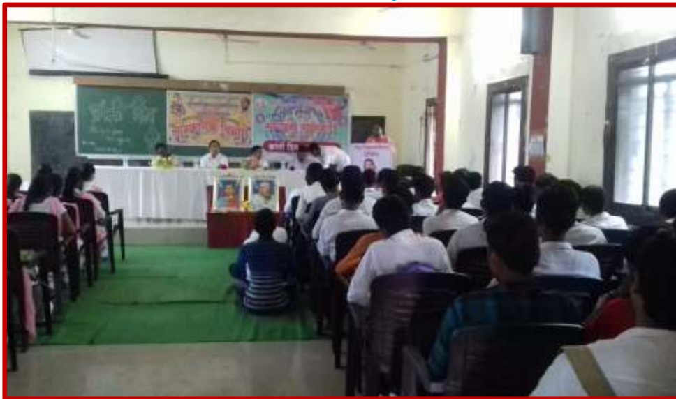
Celebration of August Karnti Day