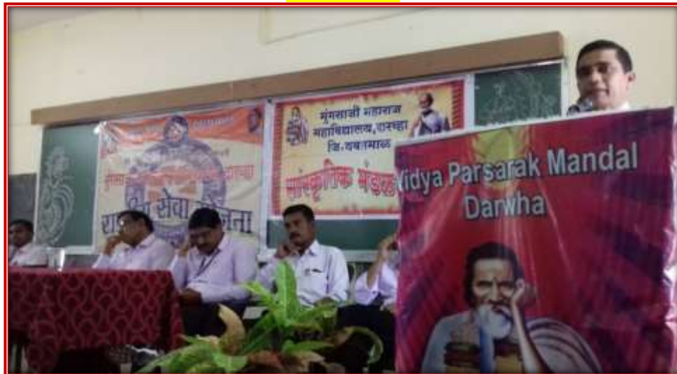
Lokmanya Tilak Birth & Annabhau Sathe Death Anniversary