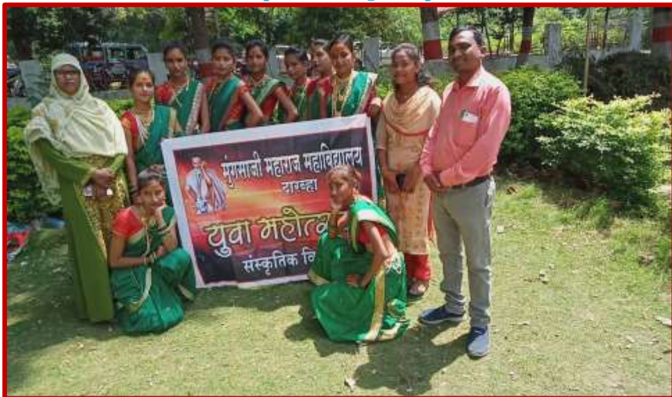
A group photo of Folk Dance with Prof-In-Charge