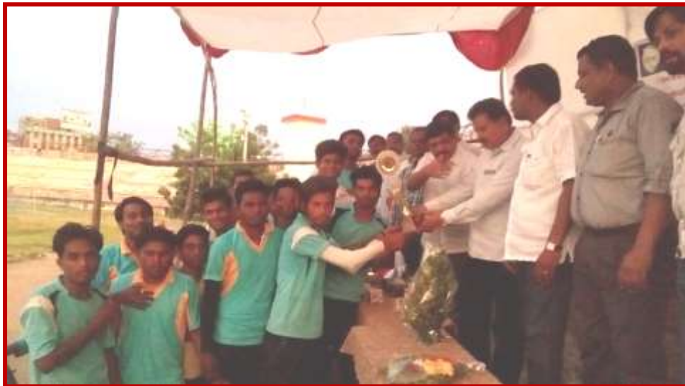
Felicitatation of team