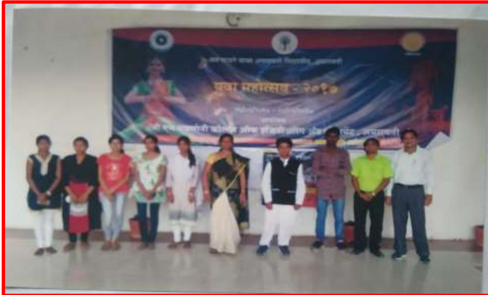
A group photo of Folk Dance team with In-Charge Teachers