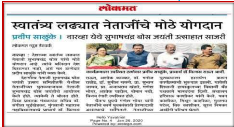
News published in Daily Lokmat News Paper