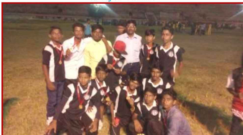
Under 18 cricket team of the Institution