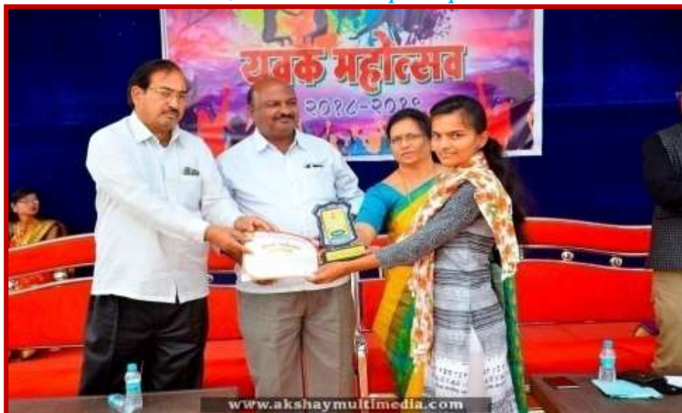
Prize Distribution to participant