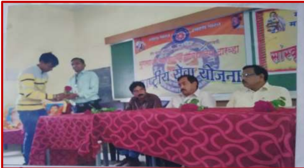
Lokshahir Annabhau Sathe Birth Anniversary & Death Anniversary of Lokmanya Tilak