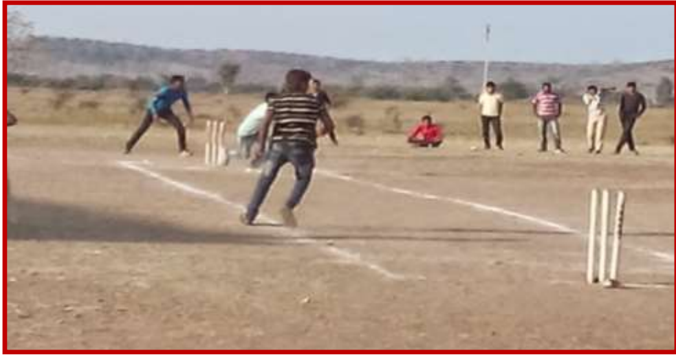
Participation of Cricket (Boys) team in Youth Festival