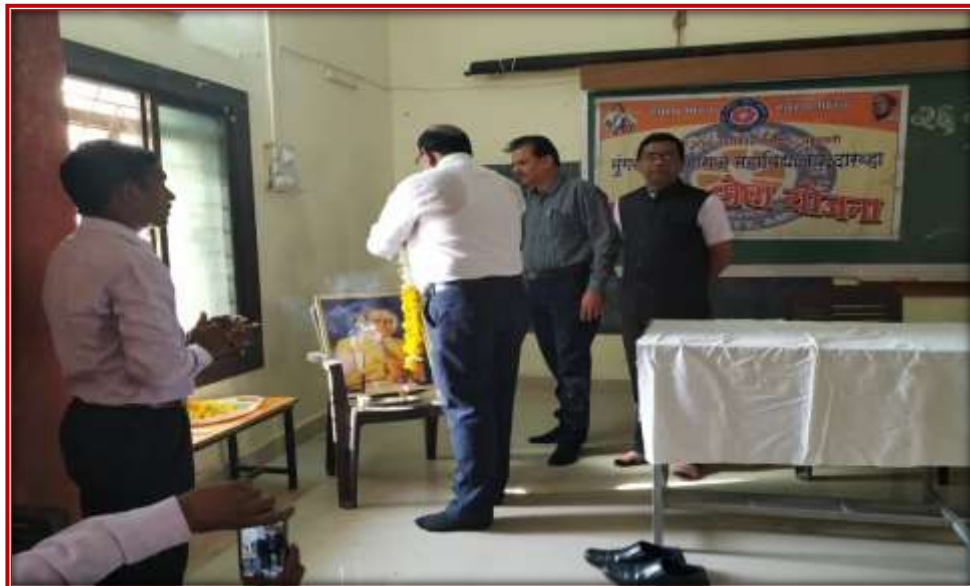
Celebration of Constitution Day