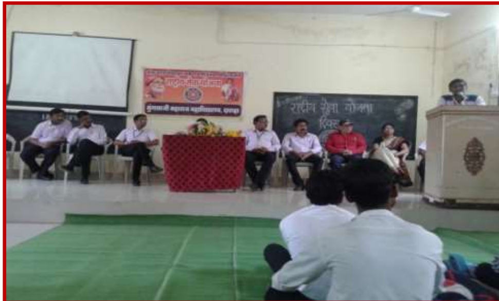
N S S Day Celebration