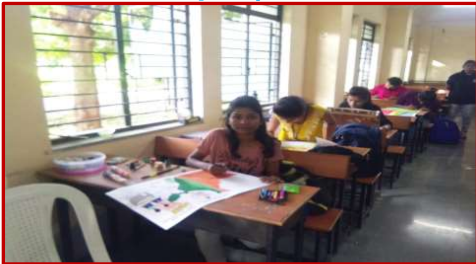
On The Spot Painting Competition