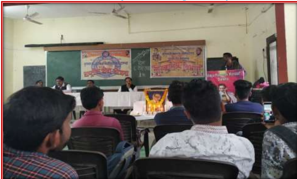
Mahaparinirwan Day of Dr. B. R. Ambedkar