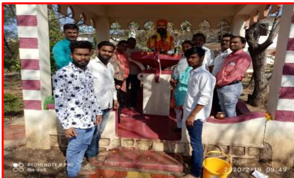
Chattrapati Shivaji Maharaj birth anniversary