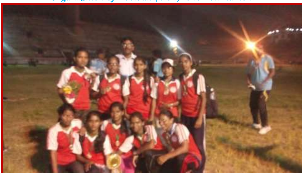
Team of our institution