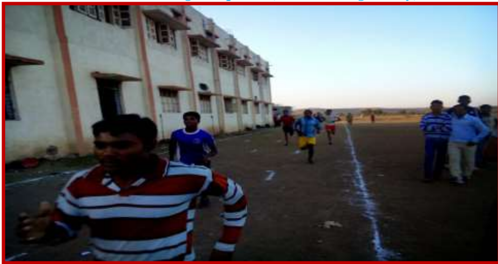
Running Competition in Youth Festival