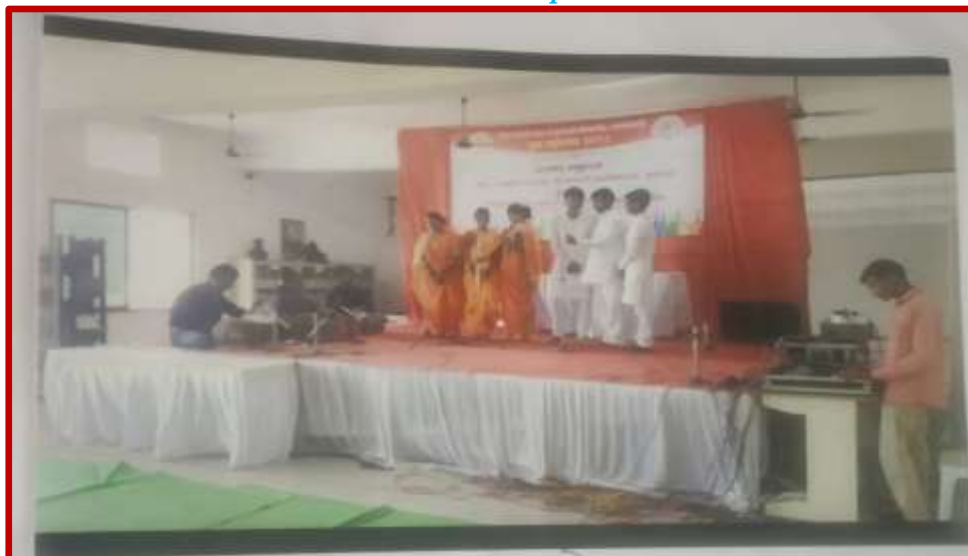
Group Song Competition