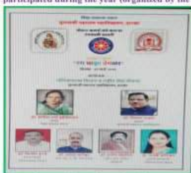
Brochure of Rang Maza Vegula competition

5.3.3 Number of Sports and Cultural events/Competitions in which students of the institution participated during the year (organized by the institution/other institutions)