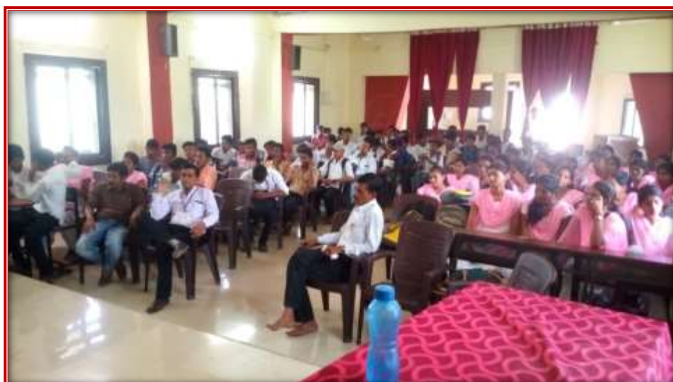
N.S.S. Day Celebration