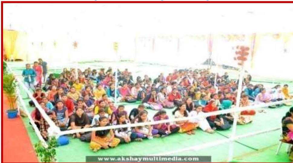
Presence of the students in felicitation function