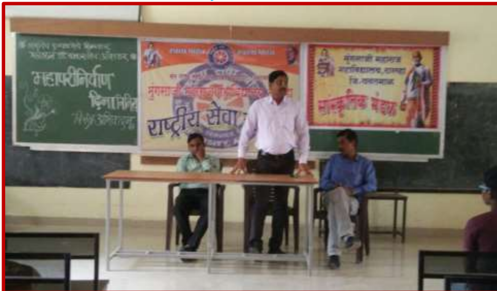
Dr. Babasaheb Ambedkar Mahaparinirvan Day