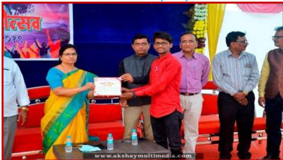
Prize Distribution to participant