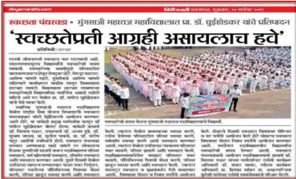
News Paper cutting of the Independence Day celebration