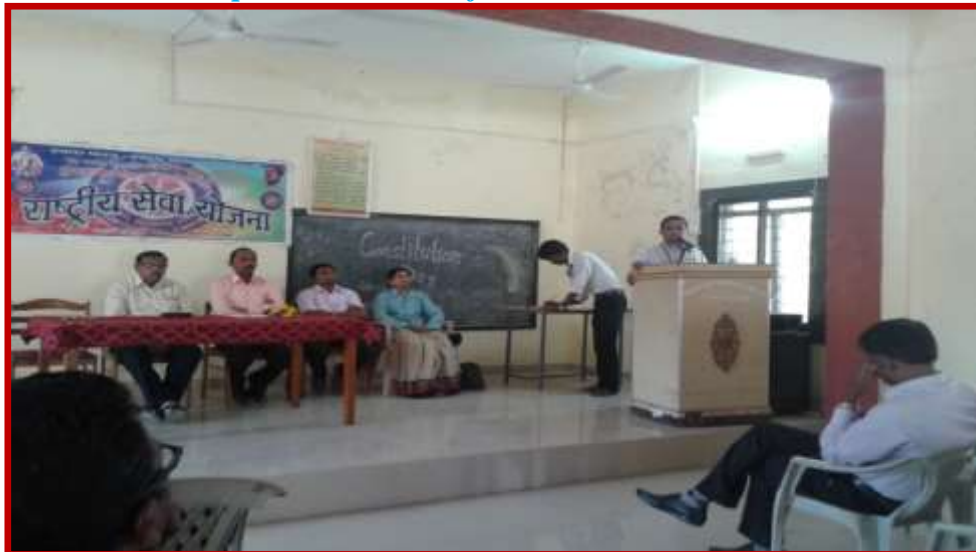
Constitution Day Celebration