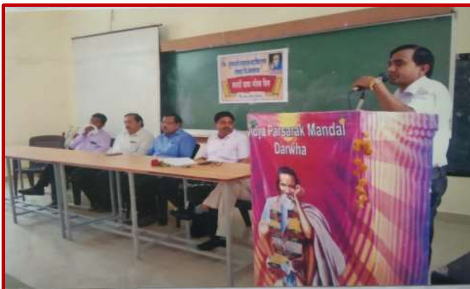
Mother Tongue Day (Marathi)