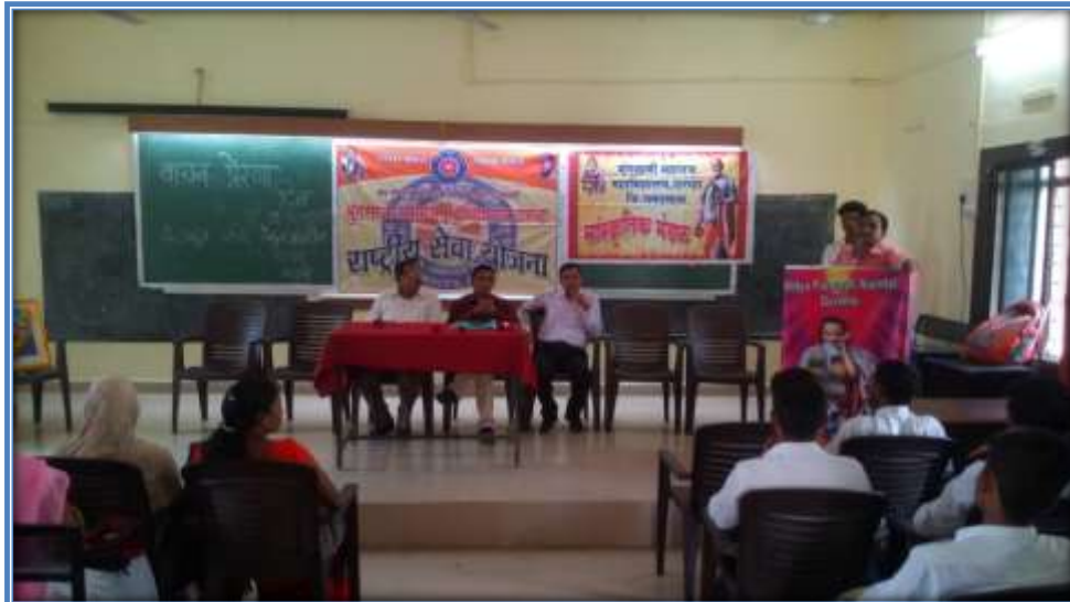
Birth Anniversary of Dr. APJ Abdul Kalam & Reading Habit inspiration Day