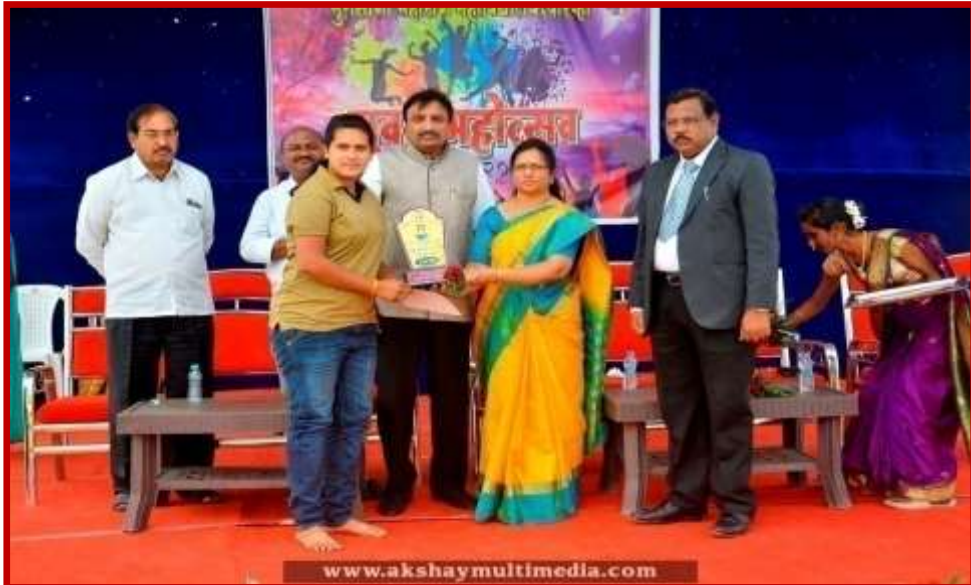
Prize Distribution to participant