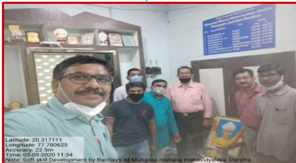
Celebration of Teacher Day