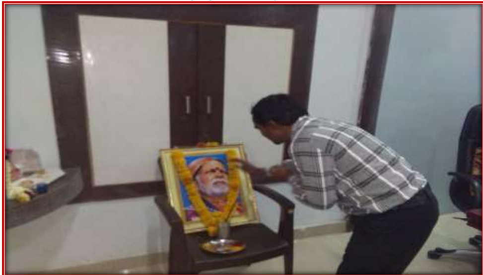
Birth Anniversary of Visionary Sant Gadge Baba