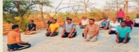
આર્થી : ધોંગાણે ઘણું દેવાના માર્ગદર્શક વિજ્ઞાન સહને.

તપોન્ન શર્મ સિલ્કબ, ગિદ્યાપી ન કાર્યન્દાગી તપસિયલ હોલે.