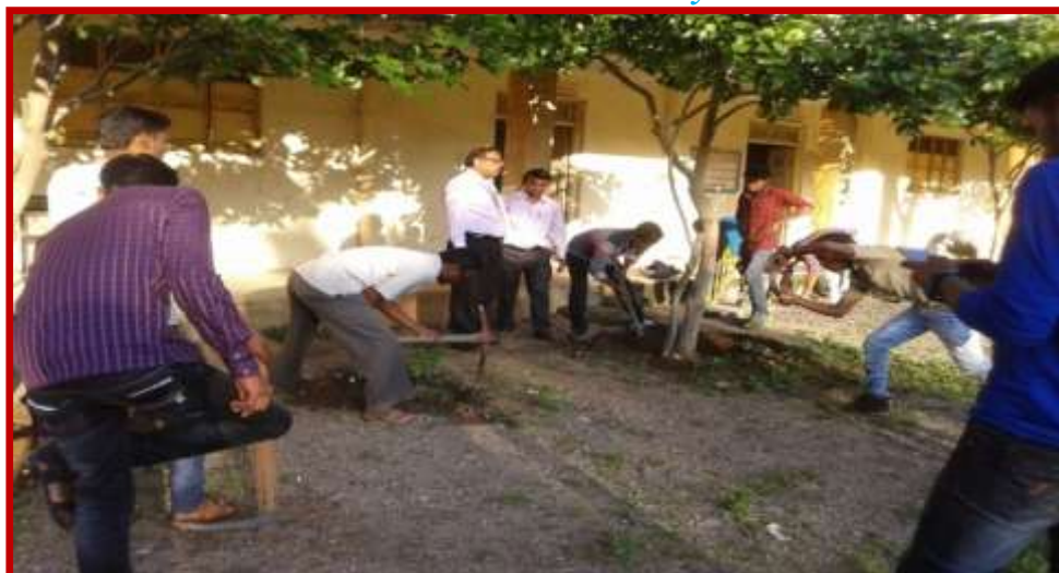
Cleanliness Drive on Birth Anniversary of Mahatma Gandhi