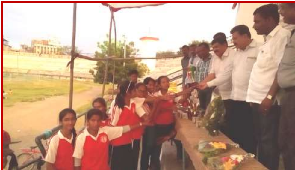
Cricket team (Women) felicitation