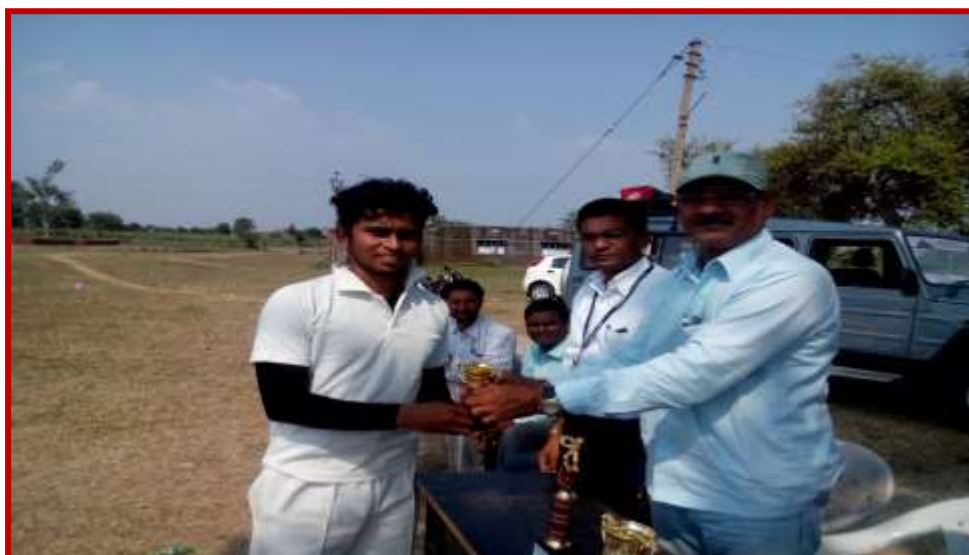
Felicitatation of participant in Cricket