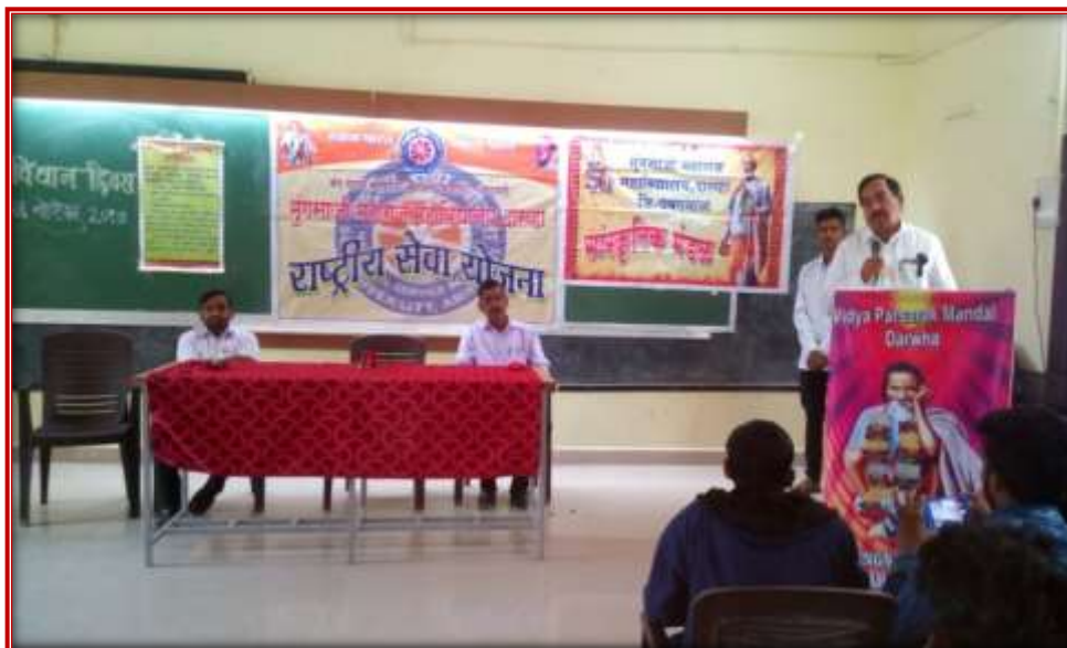
Celebration of Constitution Day