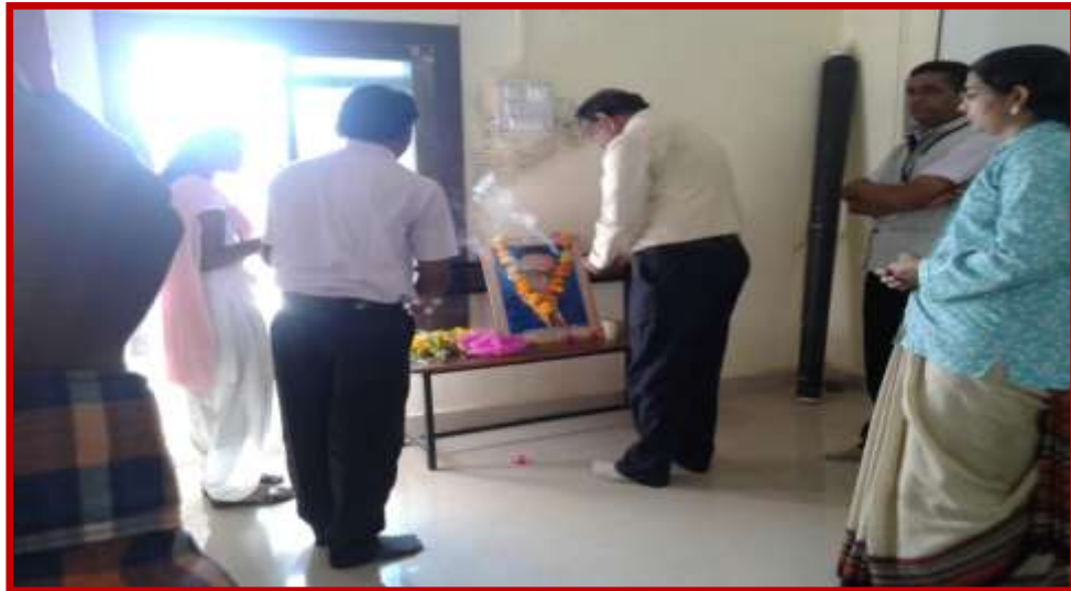
Mahaparinarwan Din of Dr Babasaheb Ambedkar