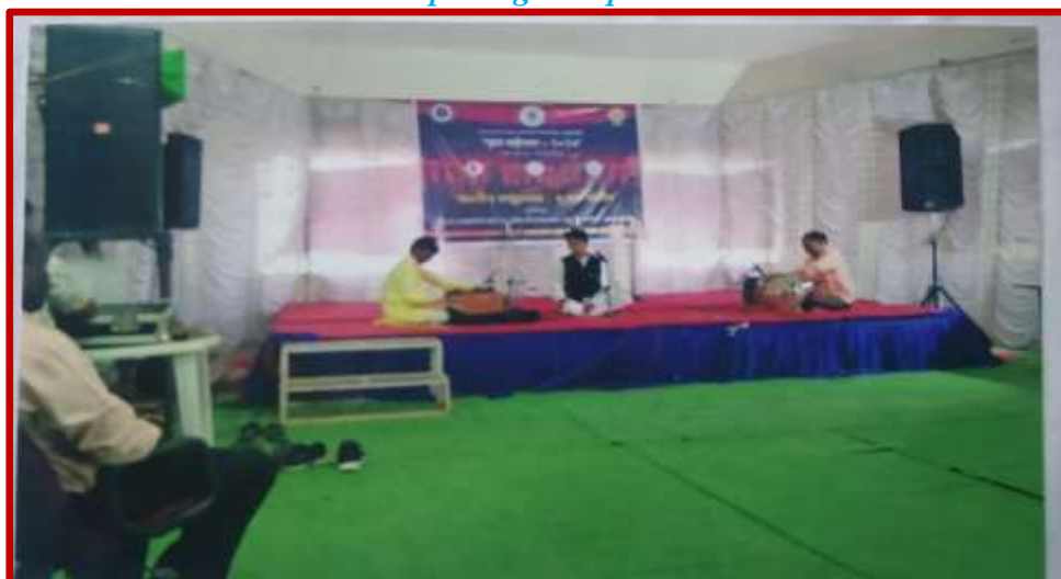
Light Vocal Solo Competition