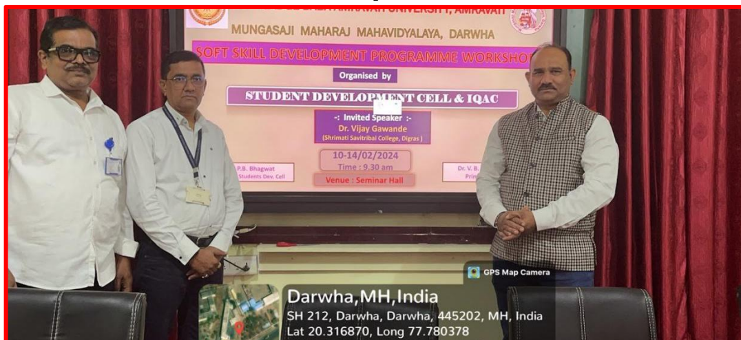
Inauguration of Soft Skill Programme