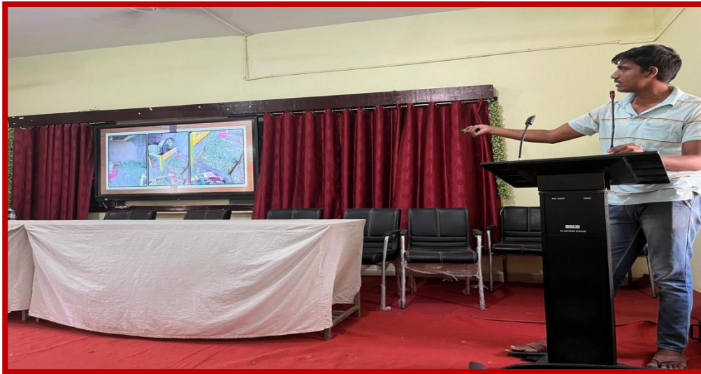
Participant Students present their Visit Project of various topics