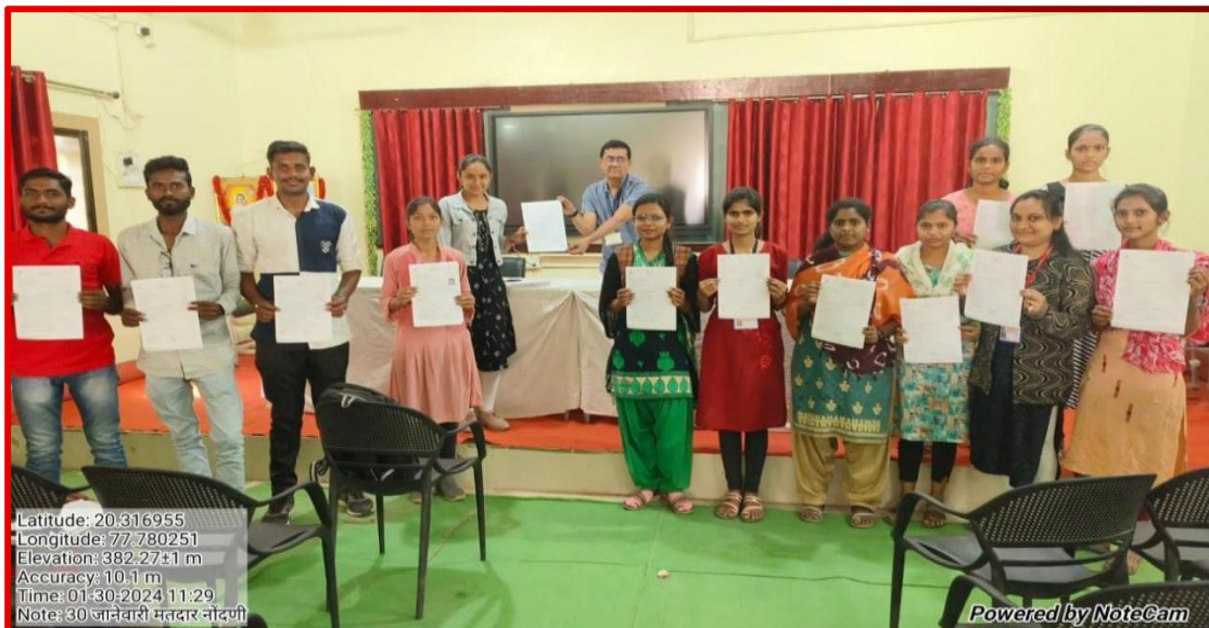
Students showing their new voter registration form