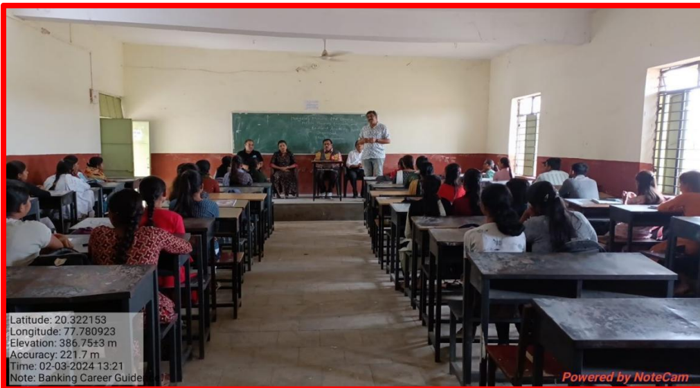
Carrier Guidance Programme on Banking Examination