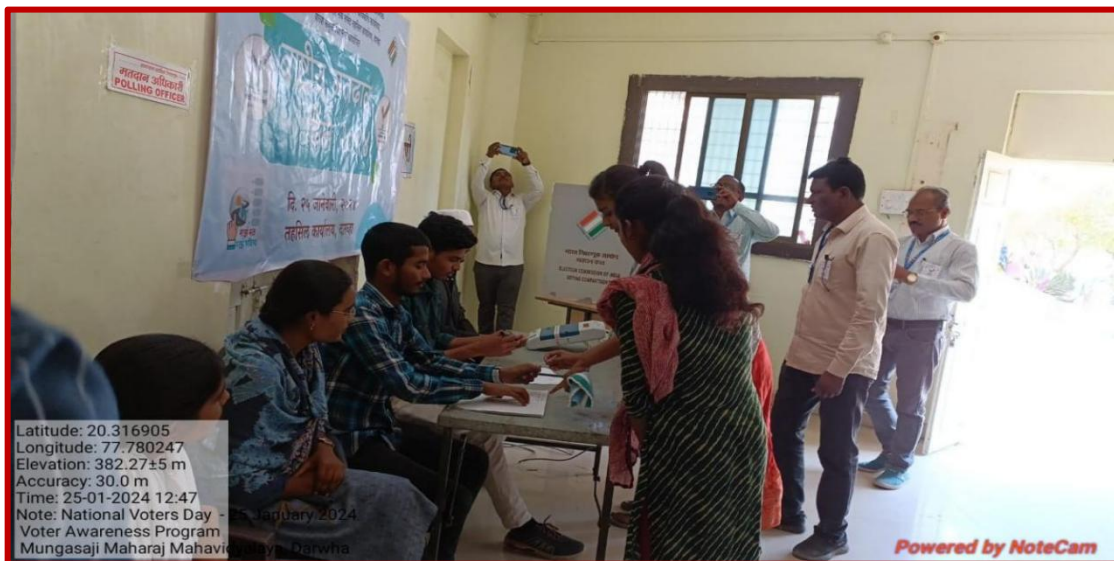
Mock Poll of voting for students