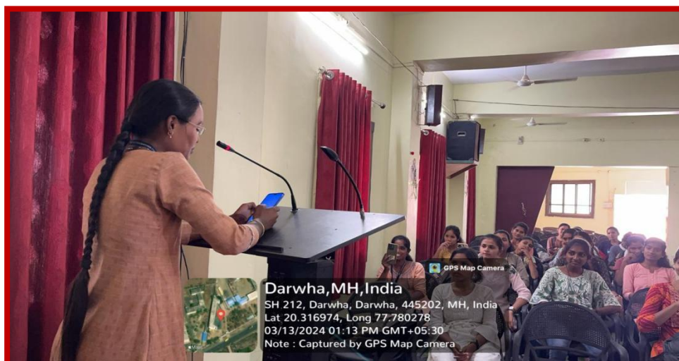
Participants Students delivered their speech in given Topic