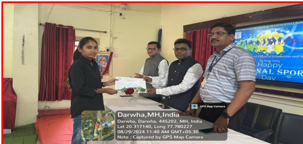
Certificate award to students of Mahajyoti one Month Programme