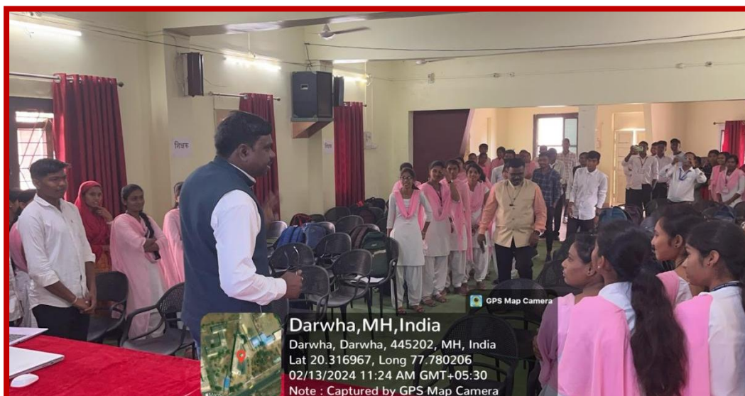
Dr. Rachalwar sir explaining on communication skills