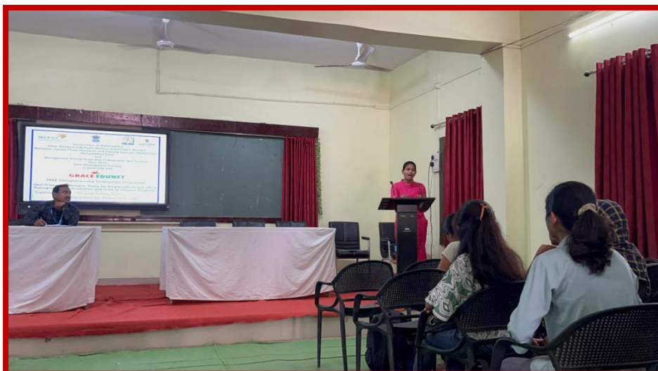
Students Express their views on given topic