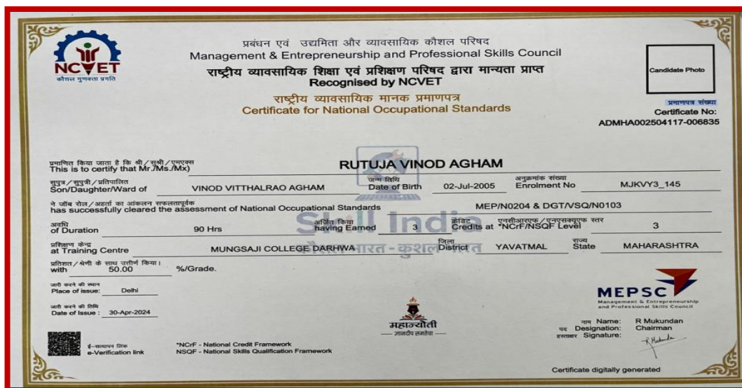
Certificate of Training Programme