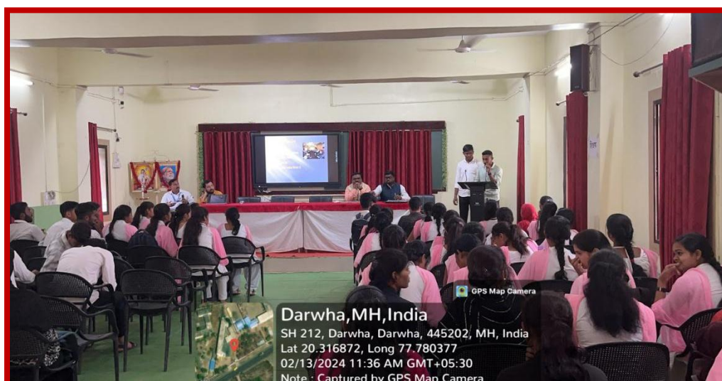
Participant Students present their Visit Project of various topics