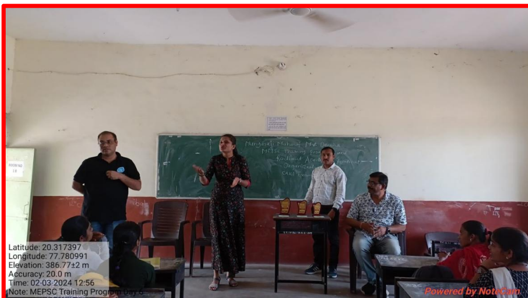
Carrier Guidance Programme on Banking Examination