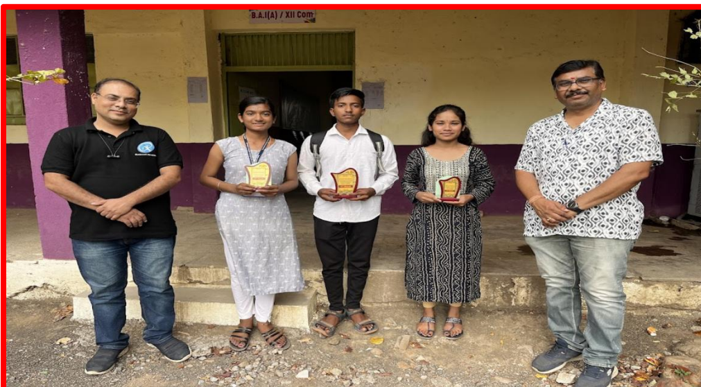
Winner of Trail Test Examination of Banking