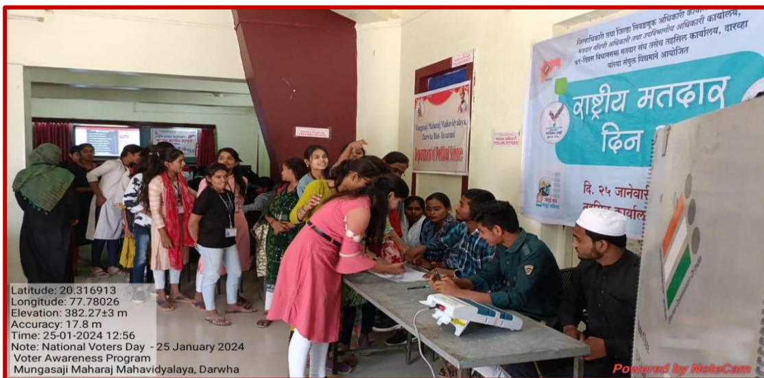
Students Following Mock Poll by procedure