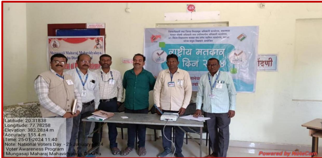
Election Officer and others officers