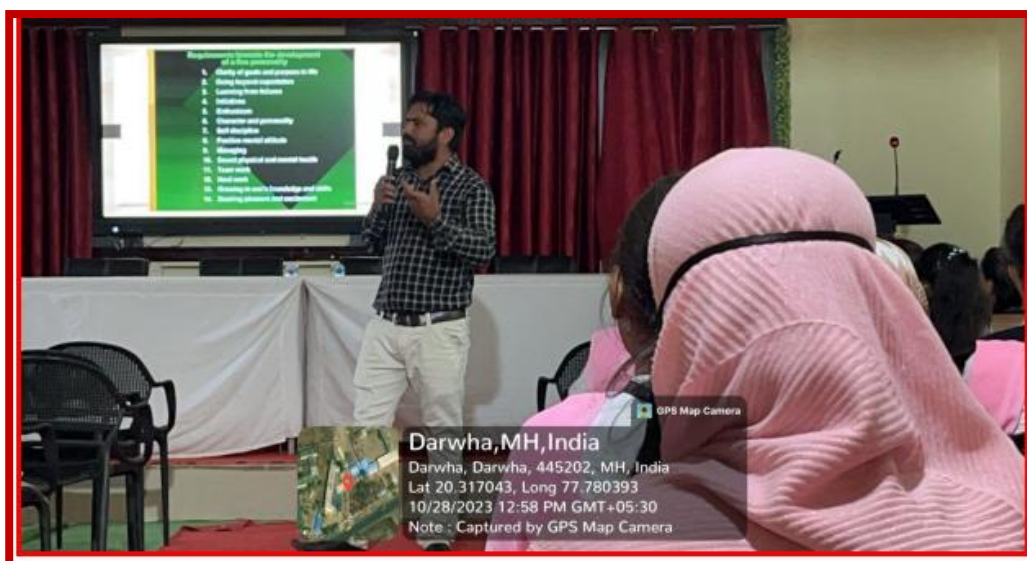
Prof Dhabe sir explaining the students Character ethics and moral