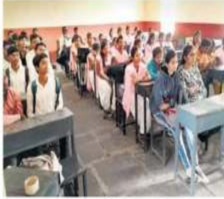
मुंगसाजी महाराज महाविद्यालयात रेड रिबीन क्लबची स्थापना.