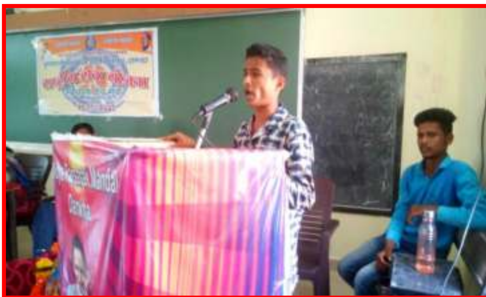
15 September to 2 October 2017 Cleanliness is the service' under fortnight programme Seminar Presentation in Adopted Village Reading Inspiration Day & APJ Kalam Birth Anniversary Dated On /15/10/2017