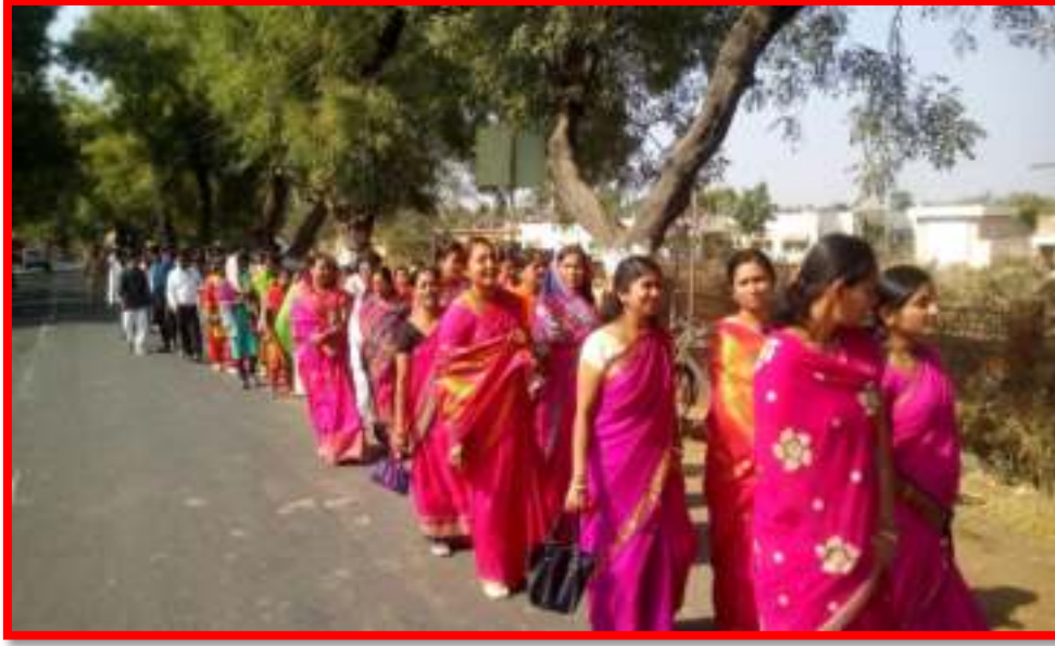
Women participation in Jijau and Swami Vivekanand Rally