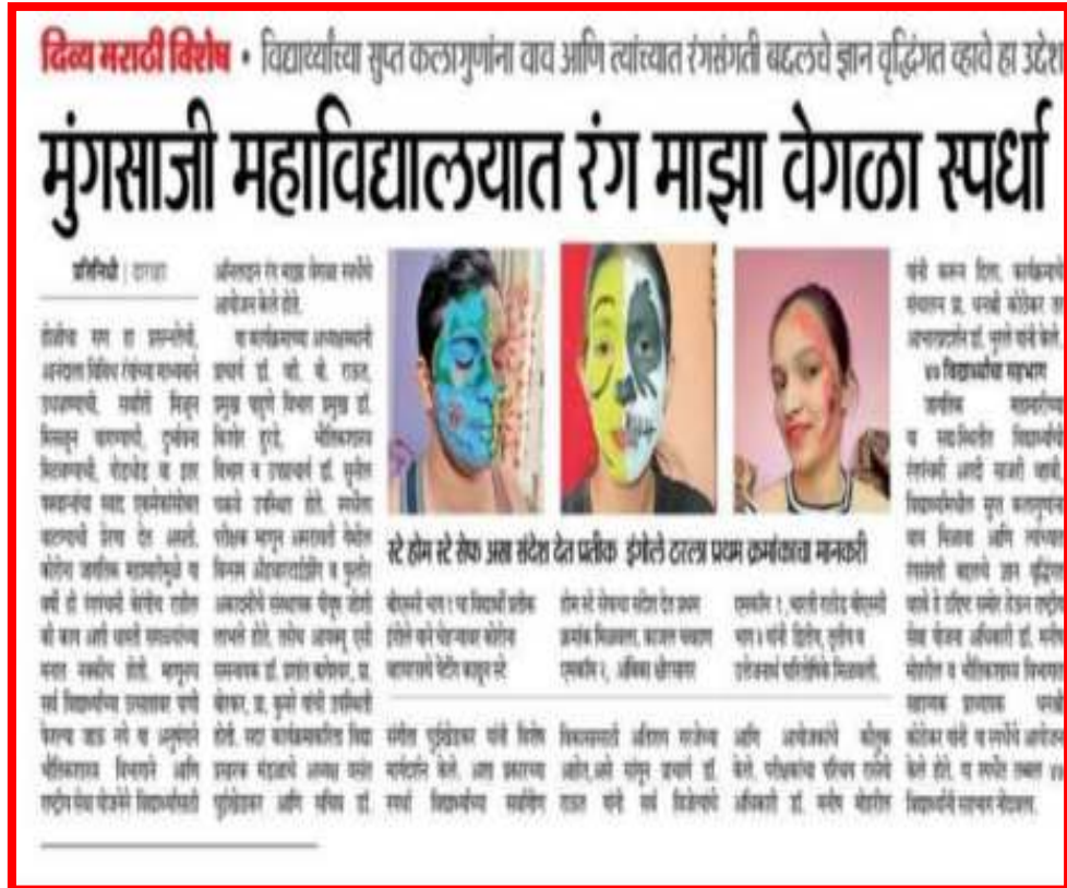
News of 'Rang Maza Vegla' (Holi Competition) is published by 'Divya Marathi'