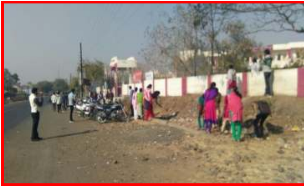
1 To 15 August 2017 Swachata Pandharwada (Cleanliness Fortnight) programme under Student Cleaning Camp