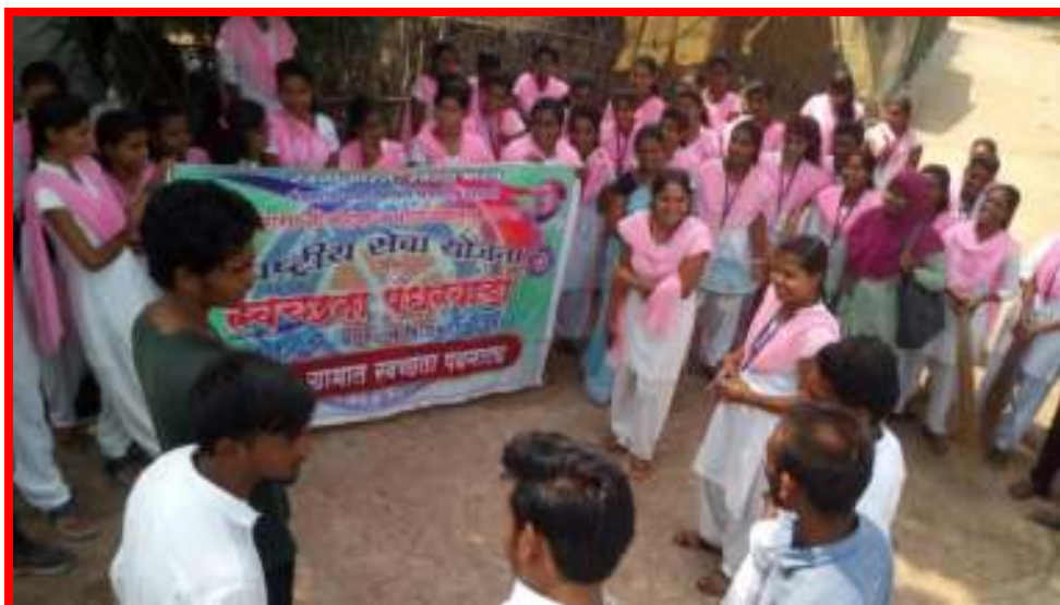
Cleaning Awareness by NSS volunteer in adopted Village in 'One Day Camp'