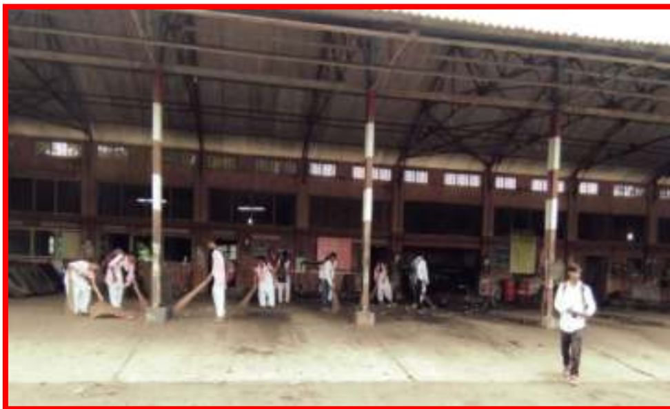
NSS Volunteers cleaning 'Bus Stand Darwha'