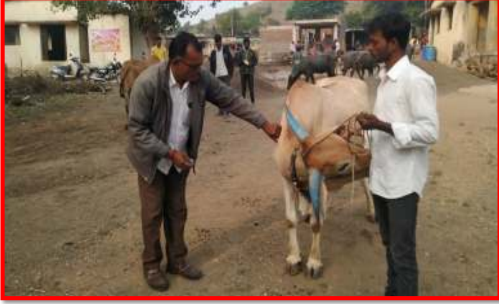
'Veterinary Camp' at adopted village