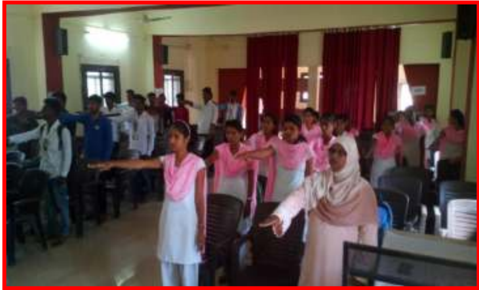
Students and staff taking Constitution Pledge 2 Dismember AIDS & Pledge under ADIS Awareness Rally