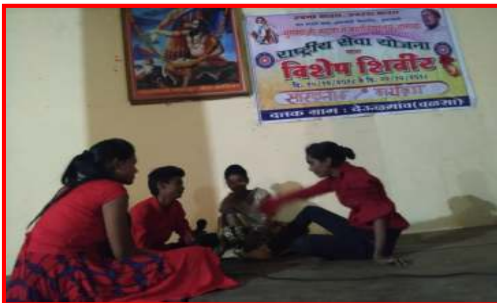
Cultural Programme at Special Camp