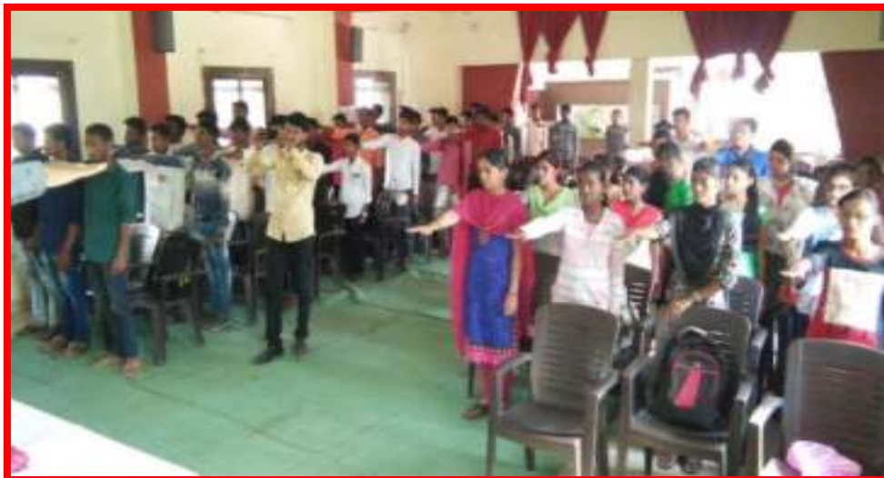
NSS Volunteer took Pledge regarding 'National Integration Day'