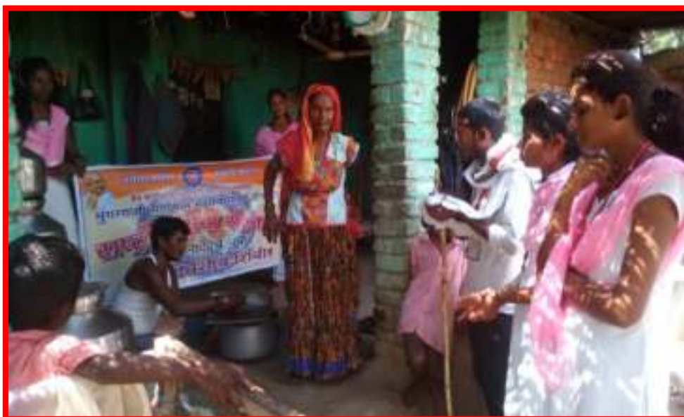
15 September to 2 October 2017 Cleanliness is the service' under fortnight Programme Cleaning Awareness Camp in Adopted Village