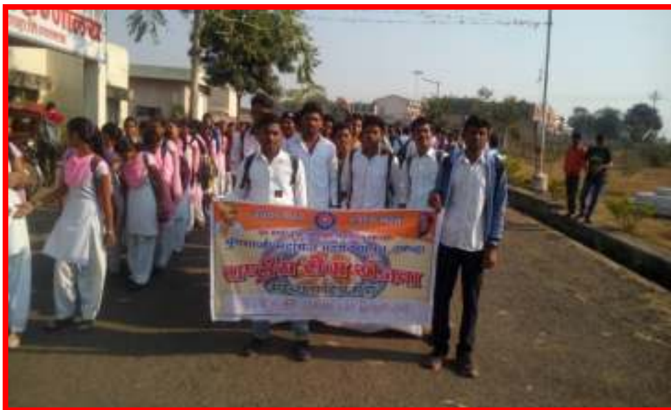
AIDS Awareness Rally