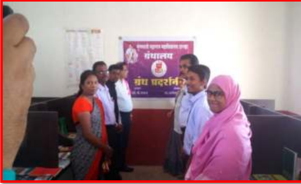
'Books Exhibition' on 'Reading Inspiration Day'