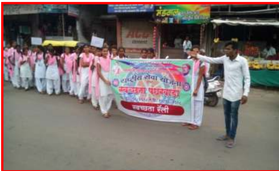
NSS Volunteers Participated Cleanliness Rally