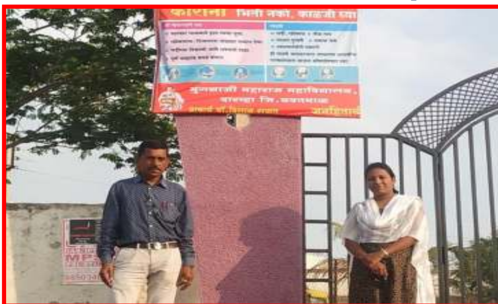
Publication of Corona Awareness wallpaper by NSS Unit

20/4/2020 'Covid -19 Awareness and Help'