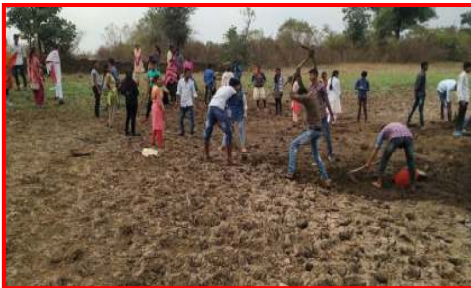
15 to 22/1/2020 Shramdan (Labor donation)