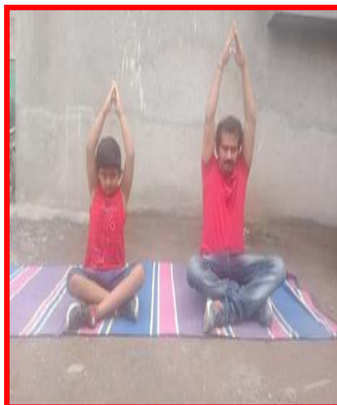
Staff performing Yoga on the occasion of 'International Yoga Day'