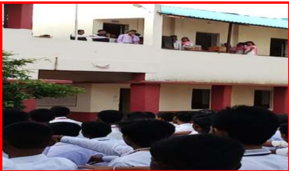
Students and all staff took of Swachata (Cleanliness)