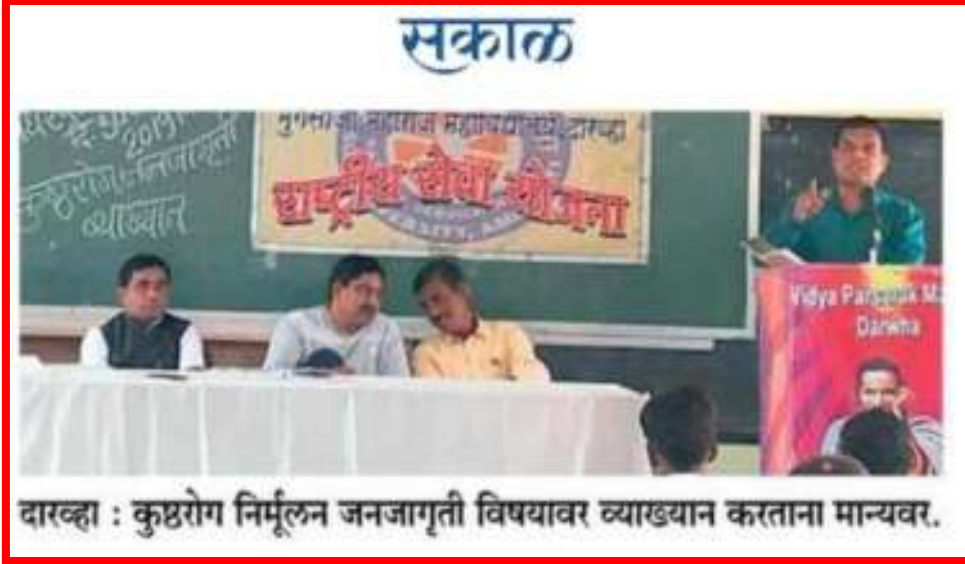
दारव्हा : कुष्ठरोग निर्मूलन जनजागृती विषयावर व्याख्यान करताना मान्यवर.