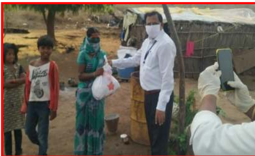
Distribution of Essential Items in covid-19 situation at adopt village Bijora Pardhi Tanda