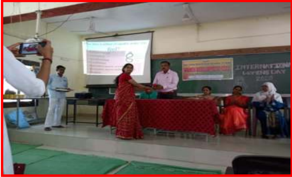
Celebration of 'International Women's Day'