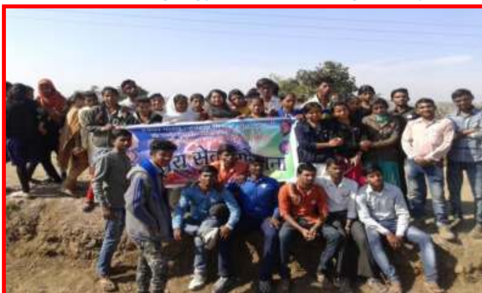
On the day of Concluding Ceremony of NSS Special Camp Guest, NSS officer & Students observing Project