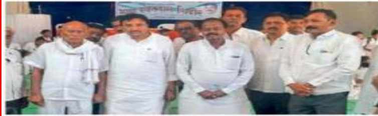
दारव्हा : येथील बचत भवन येथे रक्तदान शिबिरात रक्तदान करताना रक्तदाता व उपस्थित मान्यवर.

Blood Donation Camp news published by 'Lokmat' newspaper