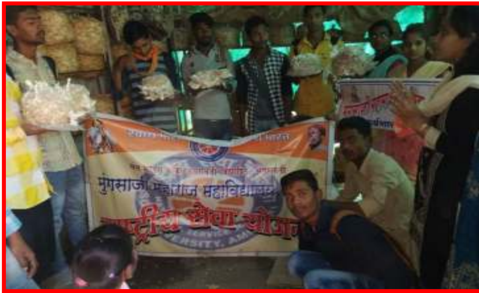
NSS Volunteers visited to the 'Mushroom Plant Project'