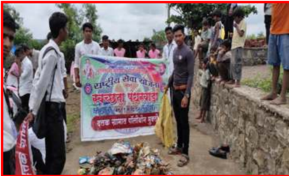
Work NSS volunteers in adopted village regarding Polythene Elimination in 'One Day Camp'