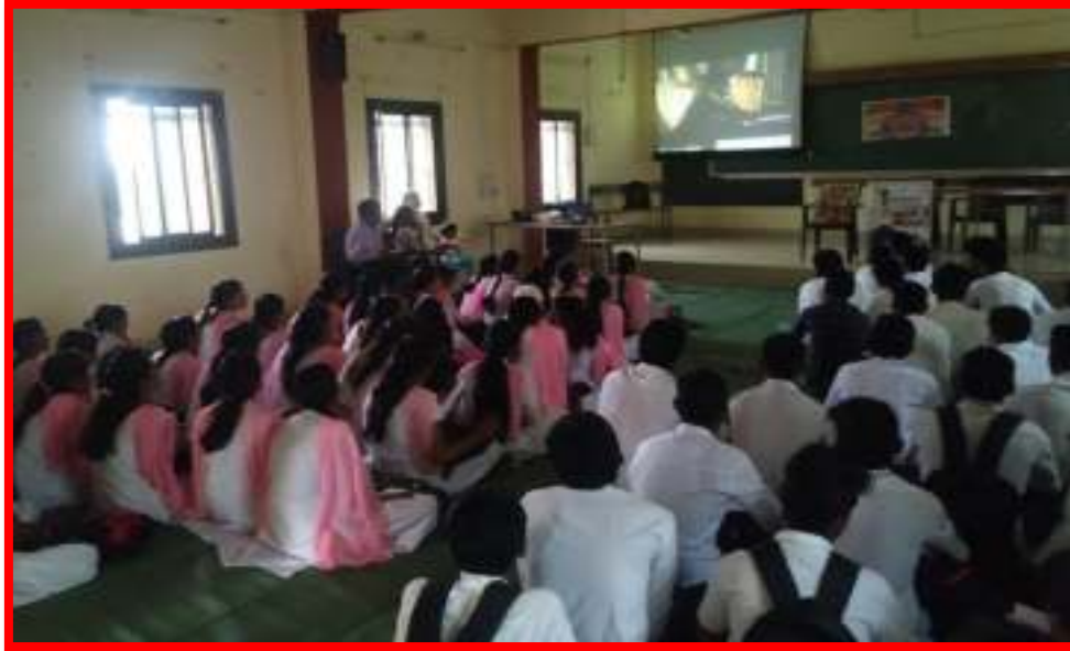
Celebrated 'Kargil Victory Day'

1 to 15 August Swachata Pandharwada (Cleanliness Fortnight) 1/8/2019 Annabhau Sathe Birth & Lokmanya Tilak Death Anniversary