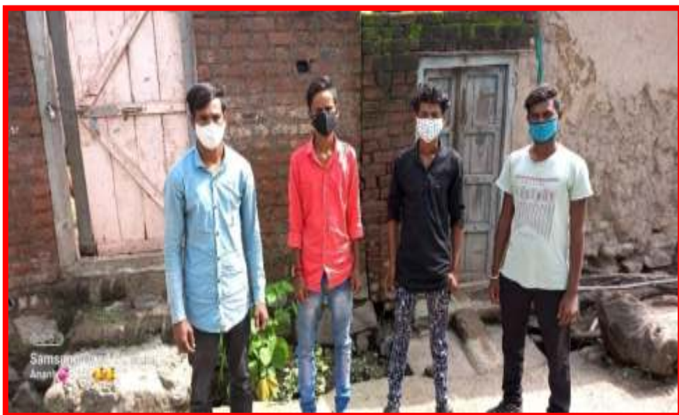
NSS volunteers doing Covid-19 Awareness