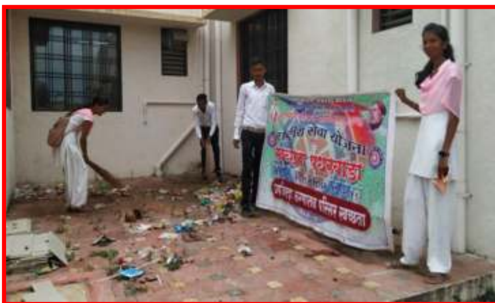
Cleanliness of 'Sub- District Health Centre' by NSS Volunteers