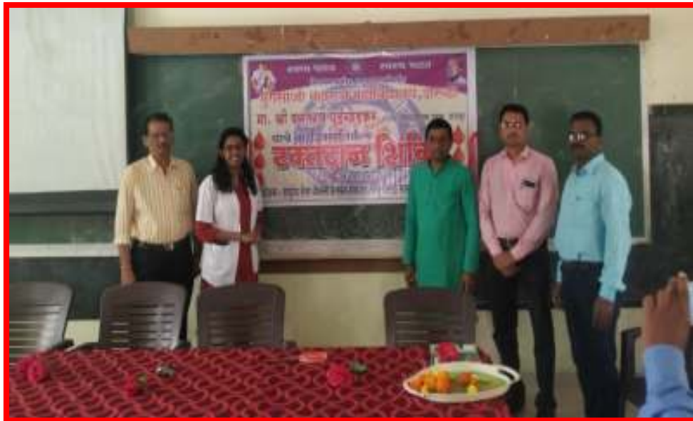
Inauguration of 'Blood Donation Camp'