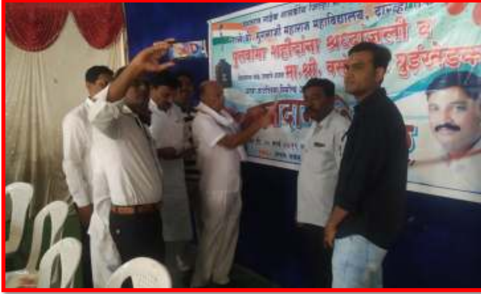
Inauguration Blood Donation Camp by the guests