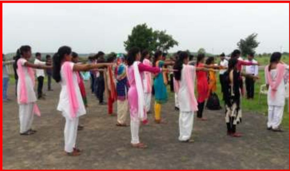
NSS Volunteer took oath of Swachata (Cleanliness)