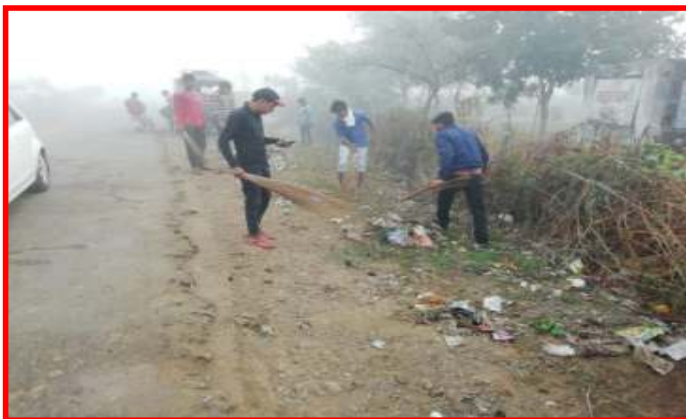
Students involved in 'Shramdan' at special camp of NSS