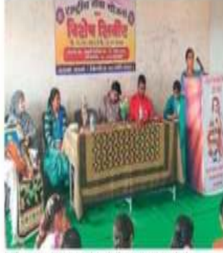
बिजोरा पारधी तांडा : राष्ट्रीय सेवा योजनेच्या शिबिरात मार्गदर्शन करताना व उपस्थित मान्यवर.