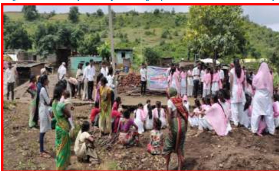
‘Cleaning Awareness Rally’ in adopted village by NSS Volunteers in ‘One Day Camp’