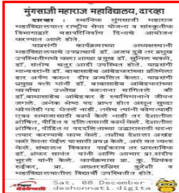
News published by 'Deshonnati' paper of 'Mahaprinirvan Day'