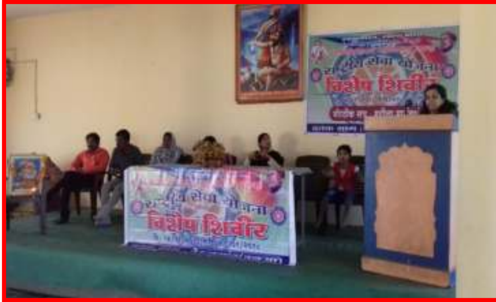
18/1/2018 Intellectual Session on 'Woman Counseling'