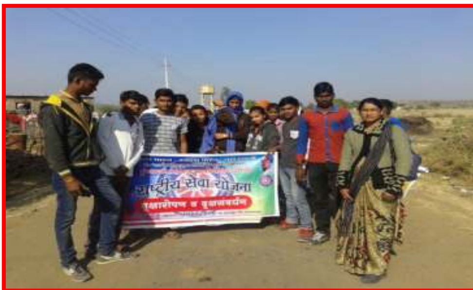
Tree Plantation & Preservation Awareness through Rally by NSS volunteers