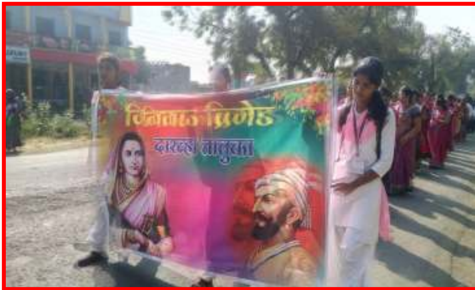
Participant in Jijau and Swami Vivekanand Rally