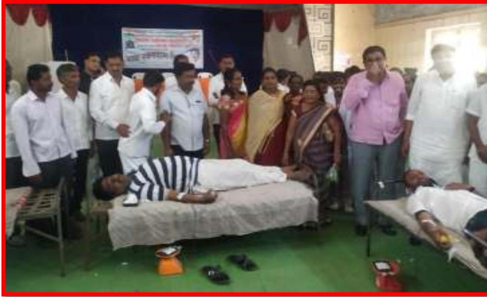
NSS volunteer donating blood in 'Blood Donation Camp'