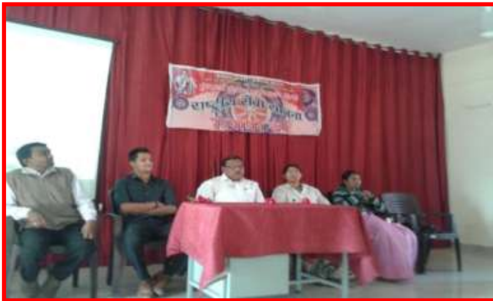
Guidance Program on NSS