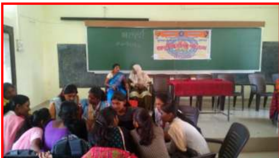
15 September to 2 October 2017 Cleanliness is the service' under fortnight programme Poster Presentation in Adopted Village