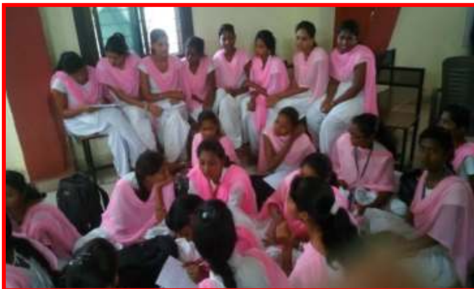
NSS Volunteers participated in 'Group Discussion'