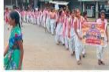
स्वच्छता व वृक्षसंवर्धन रॅलीमध्ये सहभागी महाविद्यालयीन विद्यार्थी.