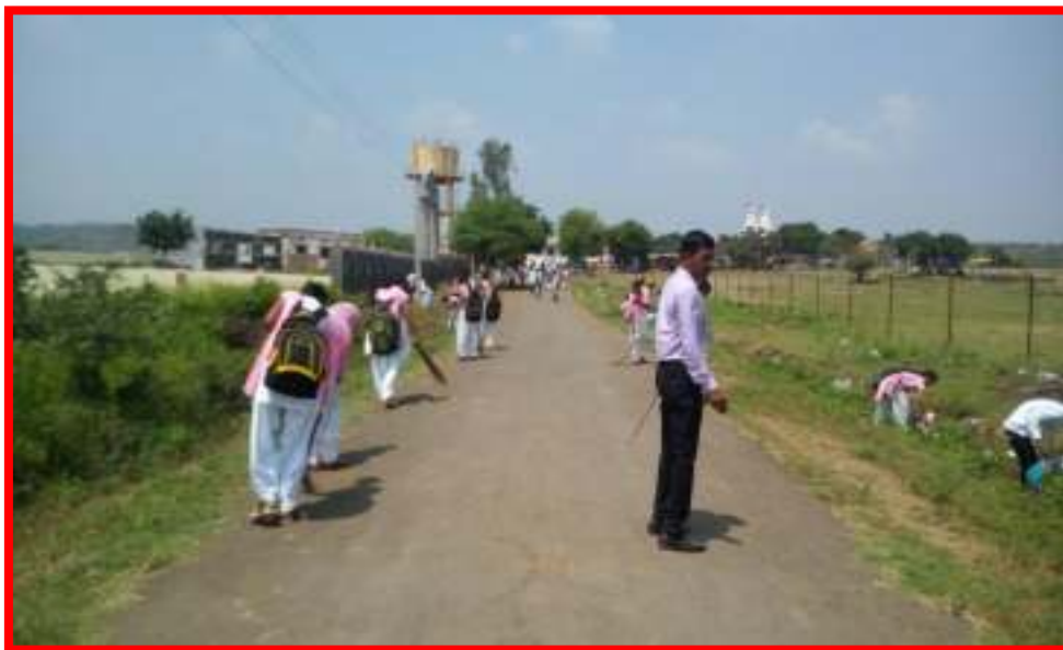
NSS volunteer cleaning adopted village in 'One Day Camp'