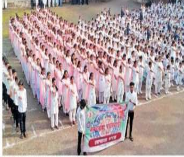
स्वच्छतेची शपथ घेताना मुंगसाजी महाराज महाविद्यालयाचे विद्यार्थी.