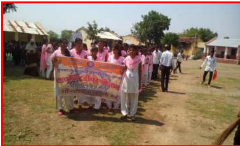
15 September to 2 October 2017 Cleanliness is the service' under fortnight programme Cleaning Awareness Camp in Adopted Village