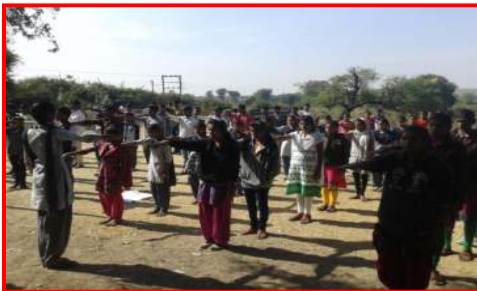
NSS volunteers singing National Anthem with School Students