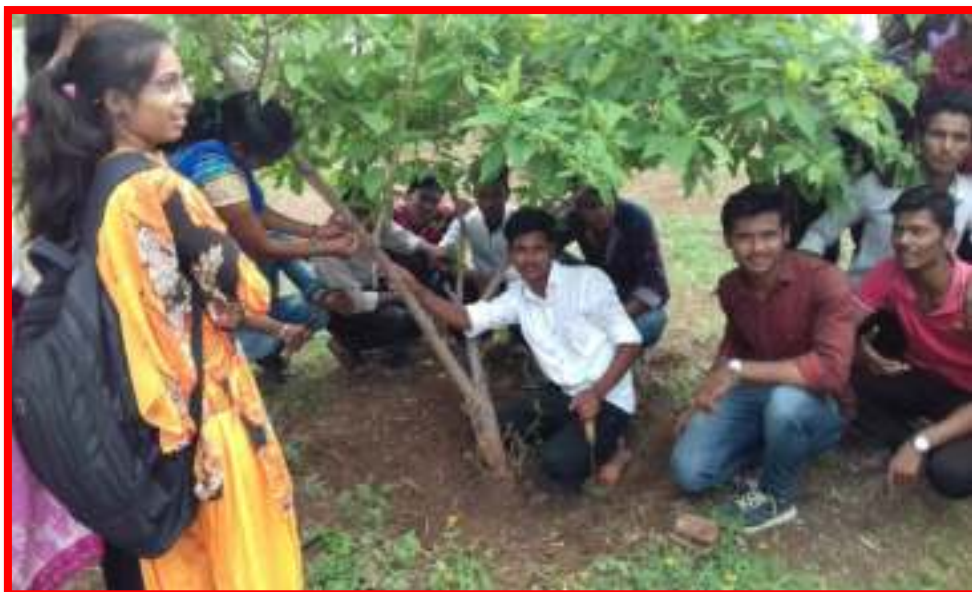
NSS Volunteer Tree tied Rakhi to the trees