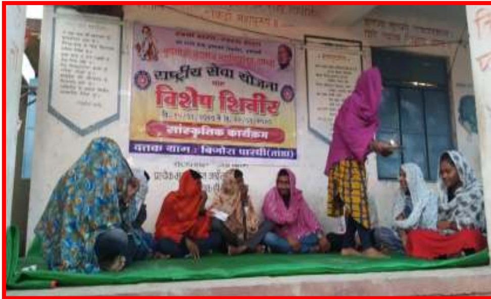
NSS volunteers performing short play in 'Cultural Programme'