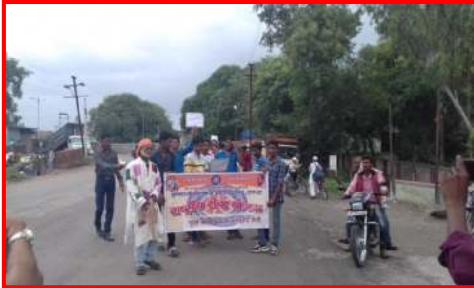
NSS Volunteer in Tree Save and Conservation Rally