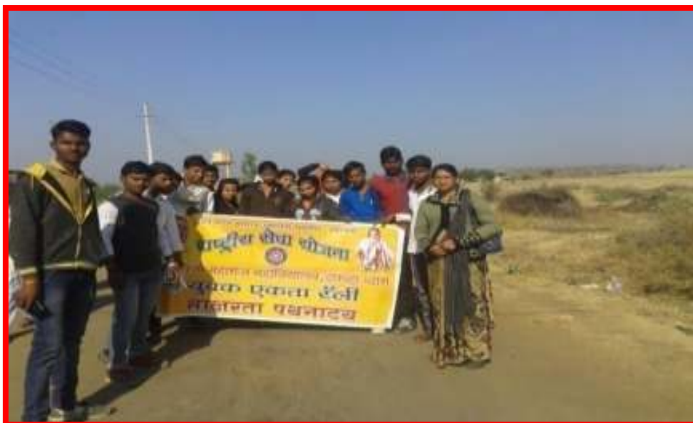
Youth unity and Literacy awareness Message by NSS volunteers