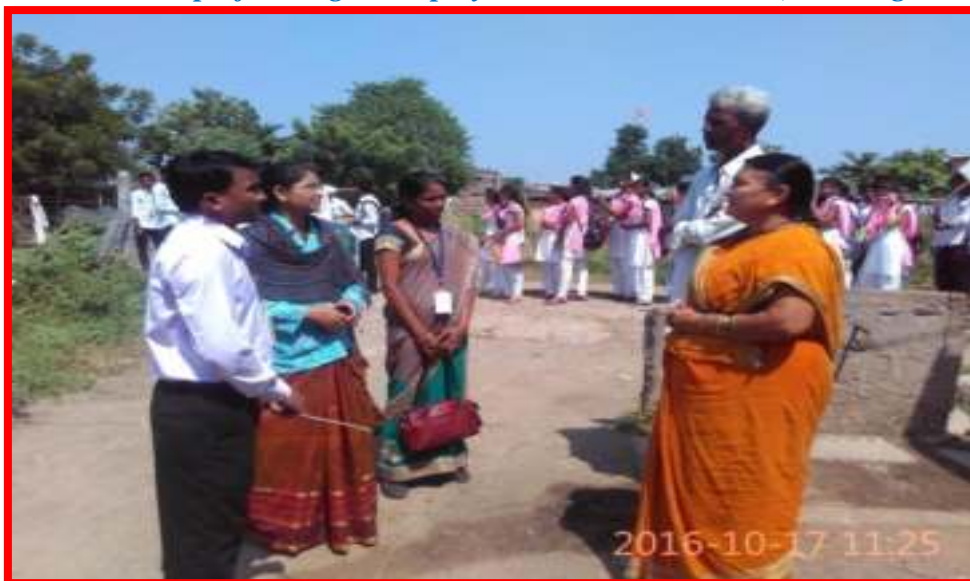
NSS Officer talking with local people and motivating them for Participation in Gram Swacchata Abhiyan (Village cleaning Campaign)

6/12/2016 Maranirvan Din (Death Anniversary)