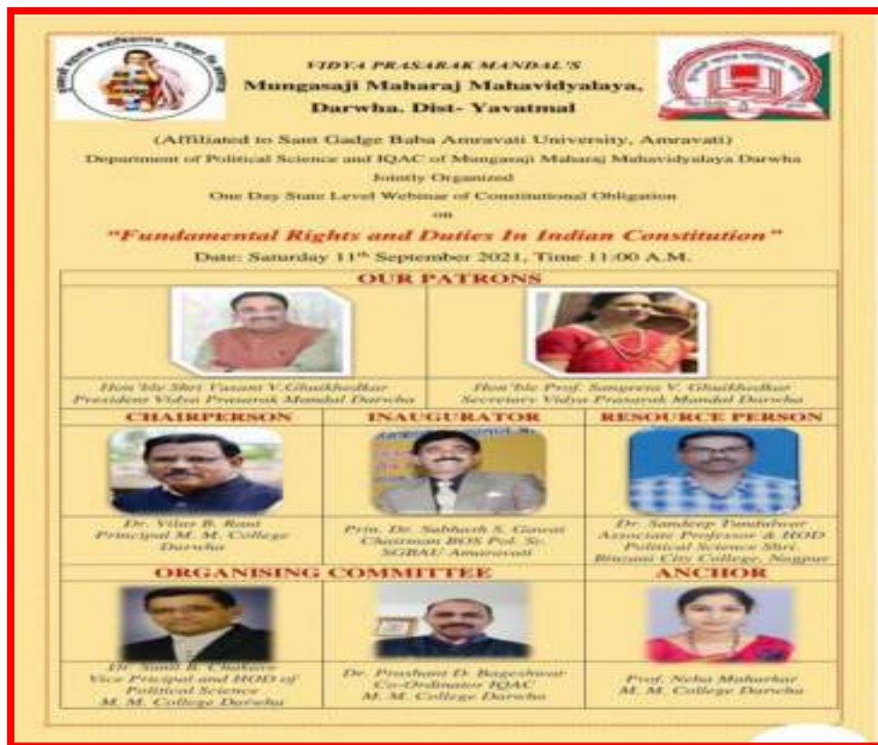
Boucher 'Fundamental Rights and Duties in Indian Constitution' Programme