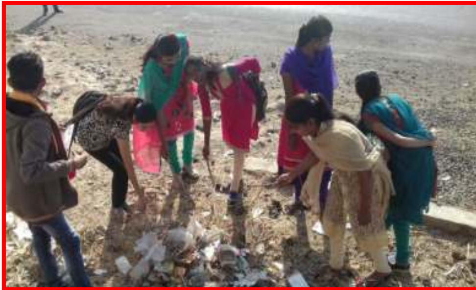
Cleanliness campaign of campus By NSS Volunteers