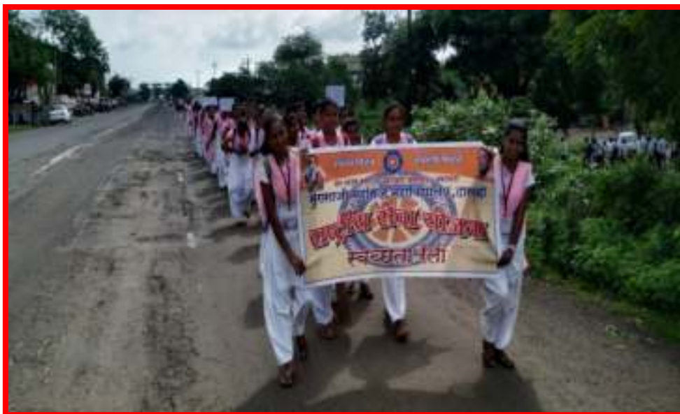
NSS Volunteer participated in Swachata (Cleanliness) Rally