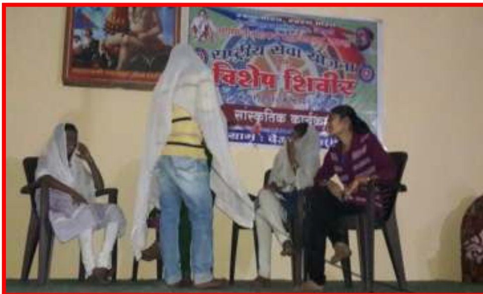
NSS Volunteers presentation in Cultural Programme