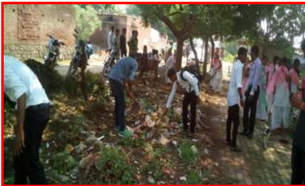
NSS volunteer cleaning adopted village in 'One Day Camp'