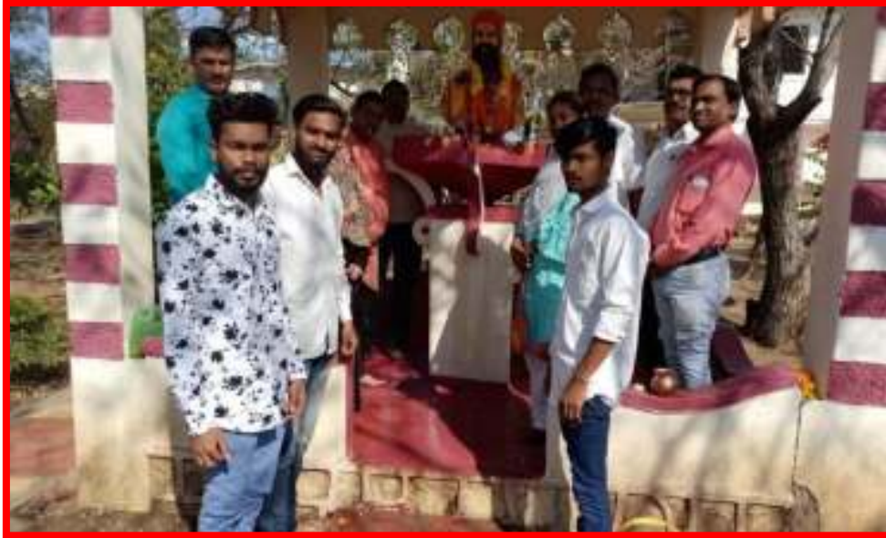
Principal, staff & student celebrating 'Shivaji Maharaj Birth Anniversary'