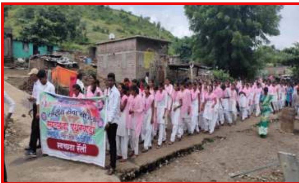
‘Cleaning Awareness Rally’ in adopted village by NSS Volunteers in ‘One Day Camp’