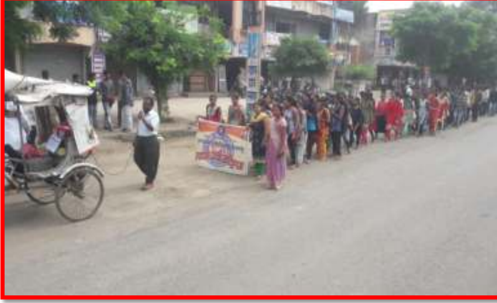
Keral Flood Donation Rally