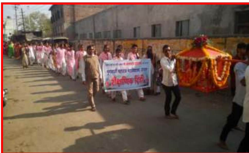
Participants of 'Educational Rally'