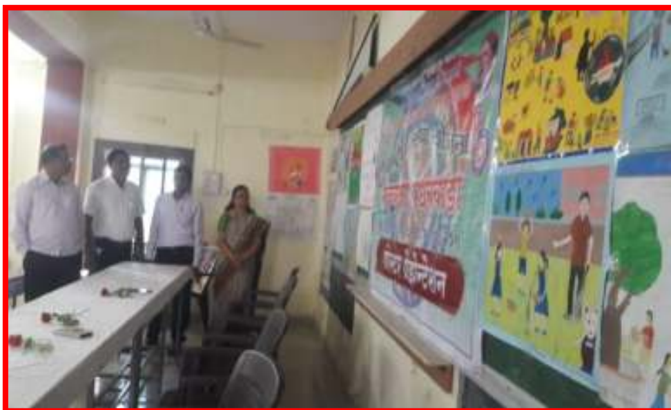
Inauguration of Poster Presentation Competition