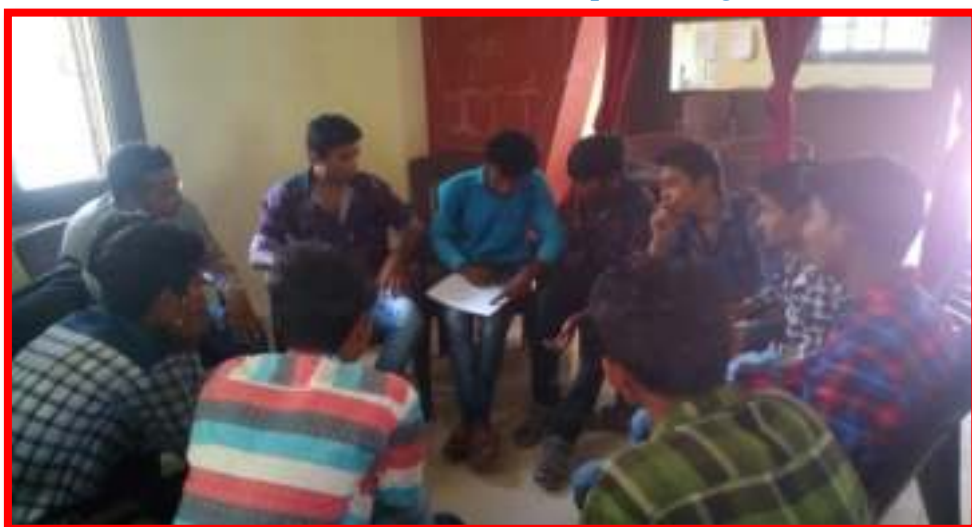
15 September to 2 October 2017 Cleanliness is the service' under fortnight programme Group Discussion in Adopted Village