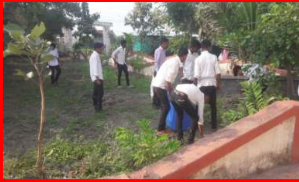
NSS Volunteers cleaning the campus

15 September To 2 October 2018 Swachata HichSewaPandrwada