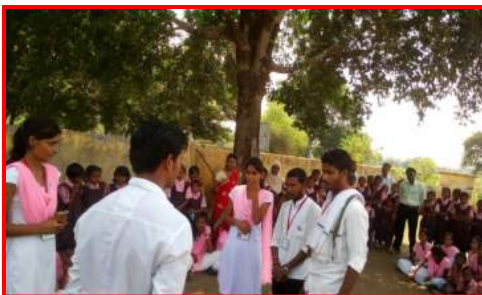
15 September to 2 October 2017 Cleanliness is the service' under fortnight programme Cleaning Awareness Camp in Adopted Village