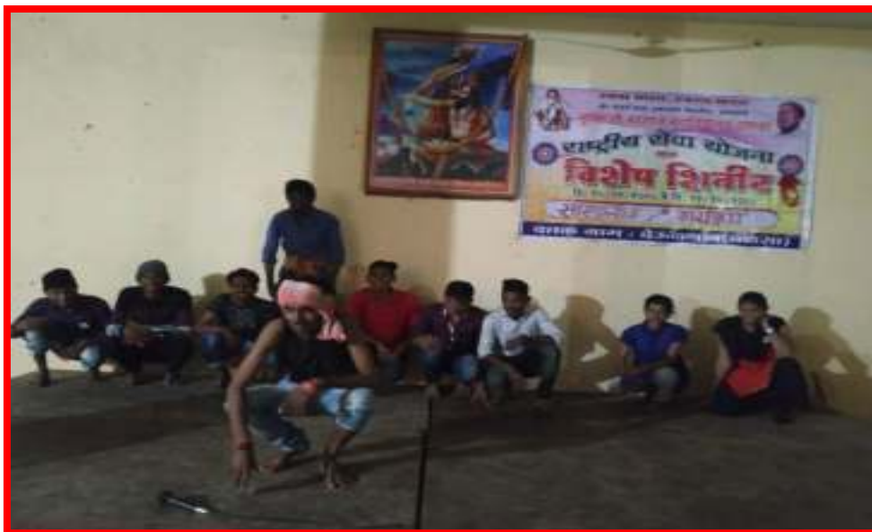
Cultural Programme at Special Camp