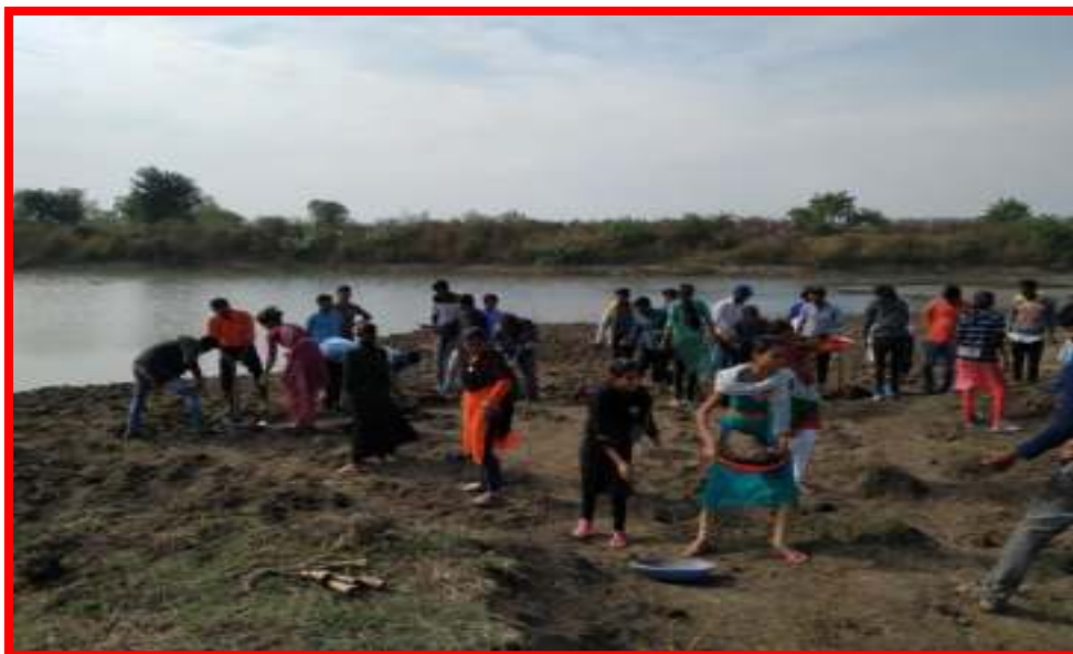
Students involved in 'Shramdan' at special camp of NSS