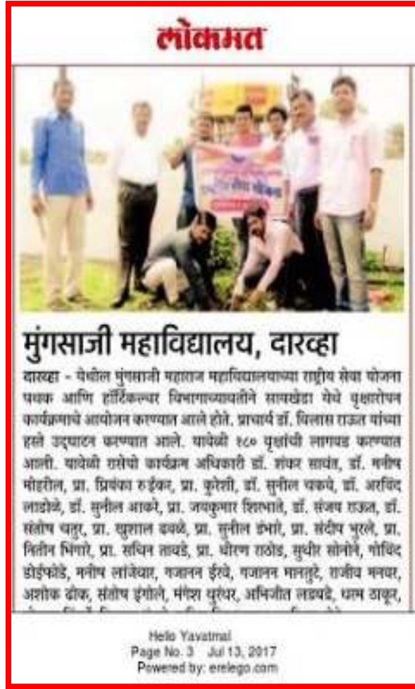
Tree Plantation News Published By Lokmat News Paper