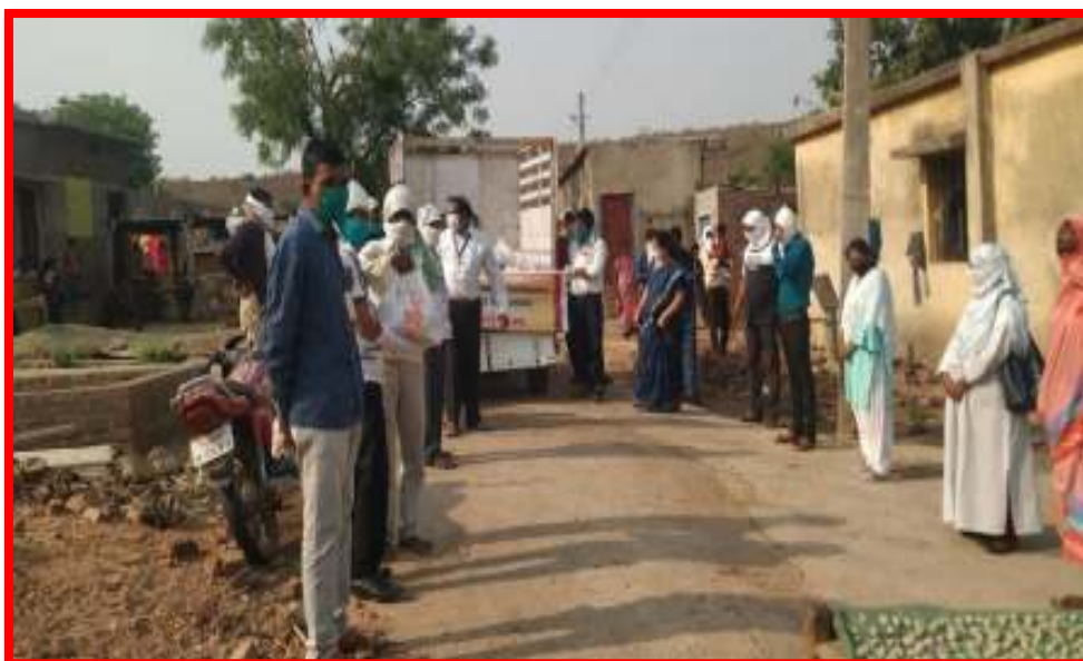
Distribution of Essential Items in covid-19 situation at adopt village Bijora Pardhi Tanda