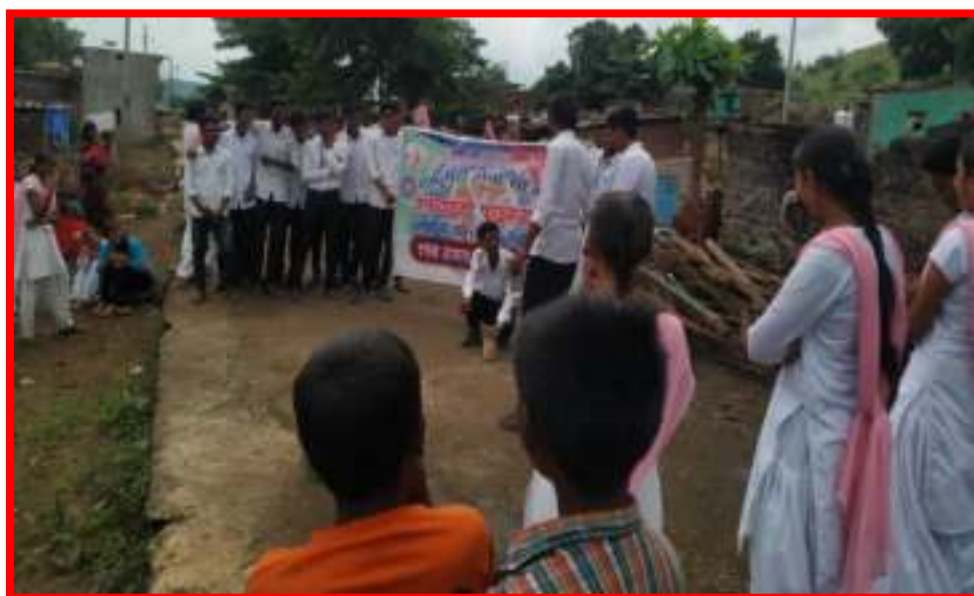
‘Cleaning Awareness Rally’ in adopted village by NSS Volunteers in ‘One Day Camp’