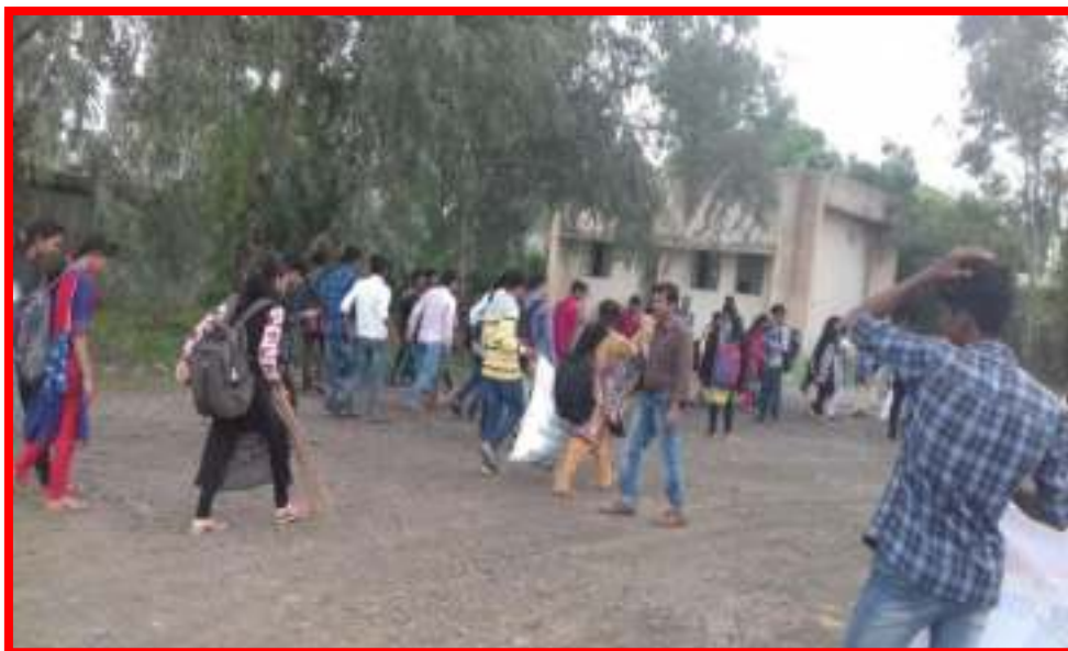
1 to 15 August 2017 Swachata Pandharwada Programme (Cleanliness Fortnight) under Student Clinging Bus Stand Darwha