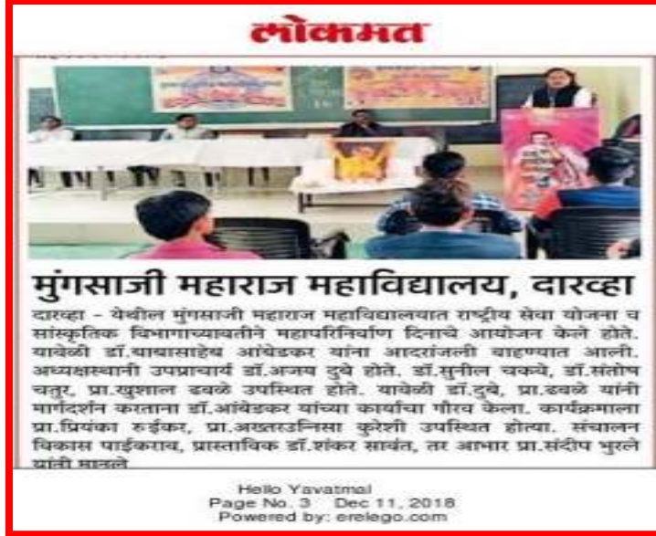
News published by 'Lokmat Paper' of 'Mahaprinirvan Day'