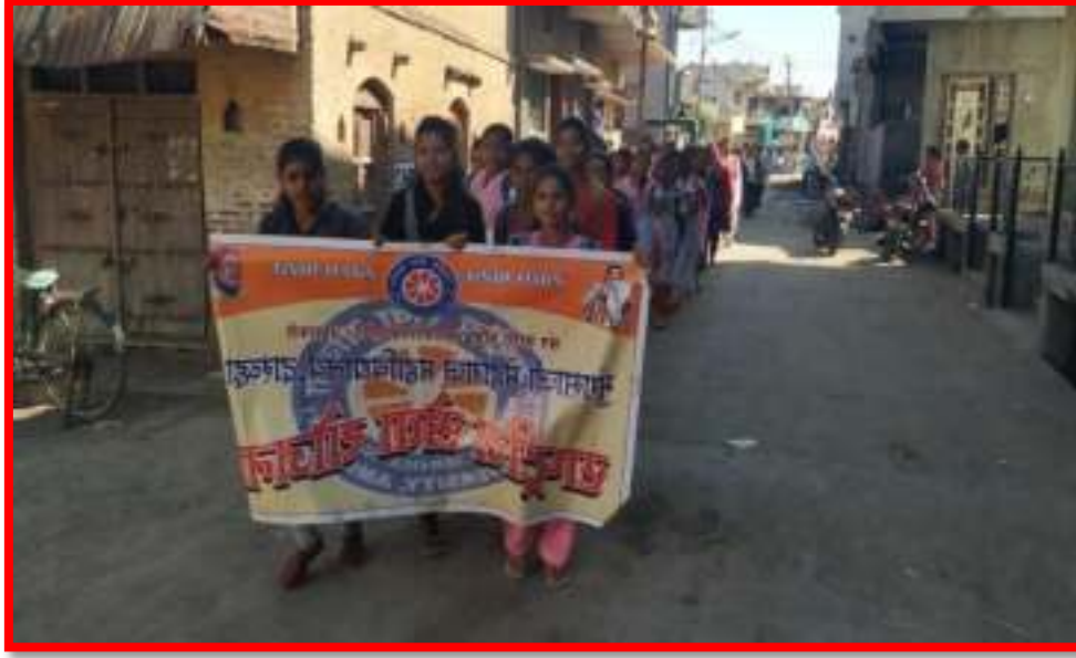
Save Girl Teach Girl Awareness Rally