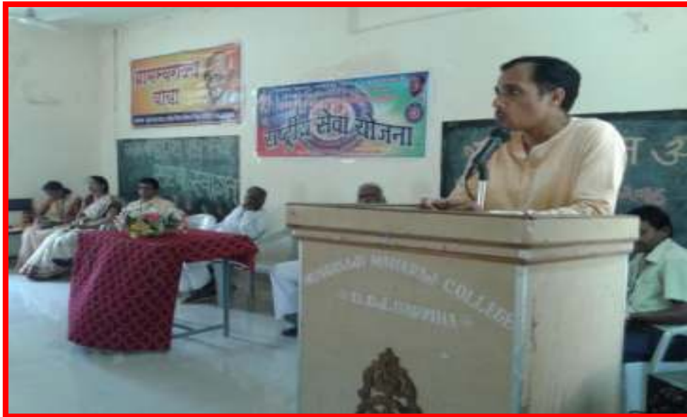
Addiction relief & Swacchata Awareness program by Gram Sawrajaya Yatra, Gramdan Mandal Kolhapur, Maharashtra Sarvaday Mandal Thane & M.M.Mv, Darwha