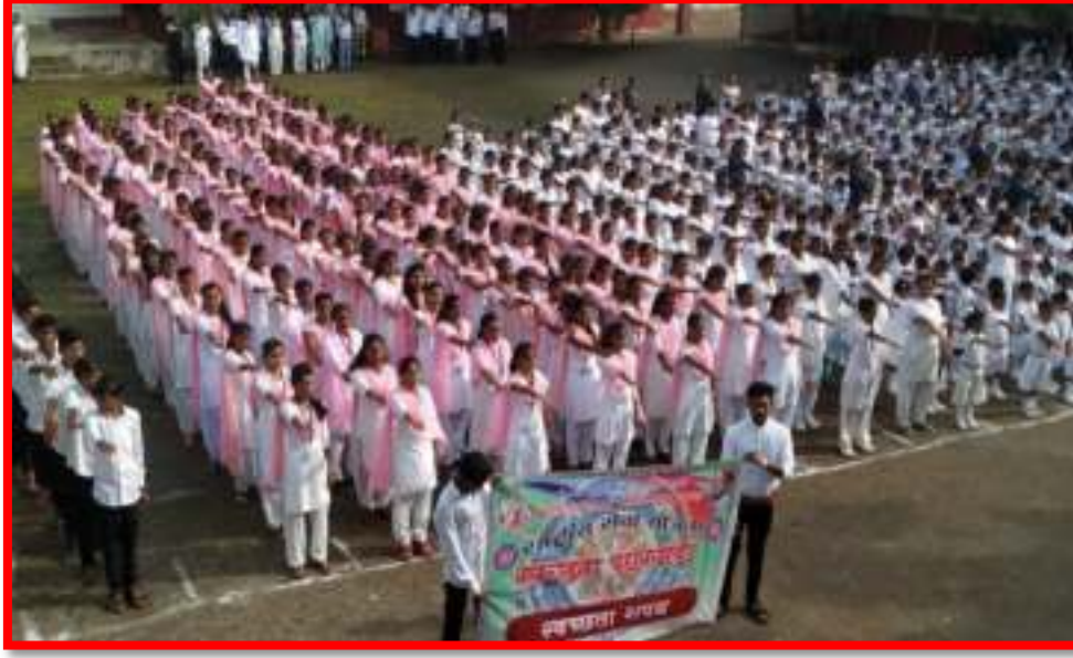
Students taking Pledge of Swachata (Cleanliness) on 15/8/2019