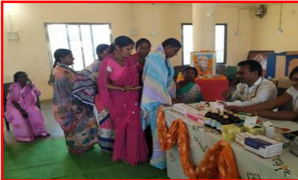
Health Checkup Camp