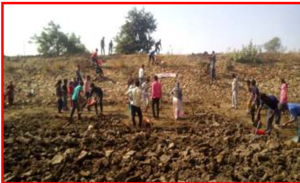
NSS Volunteers working on Special Project