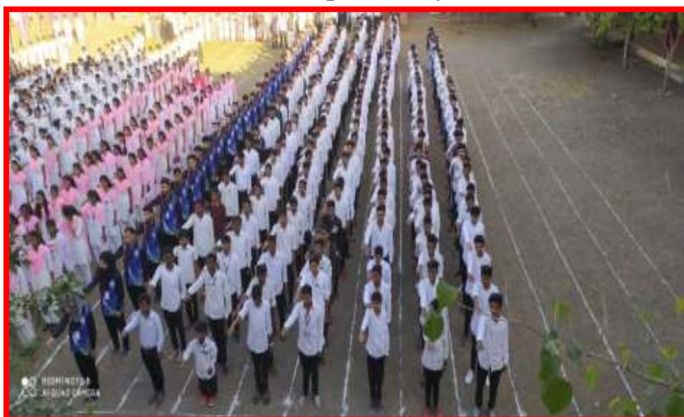
Student taking 'Republic Pledge'

30/1/2020 'Swachhata (Cleanliness) Survey'