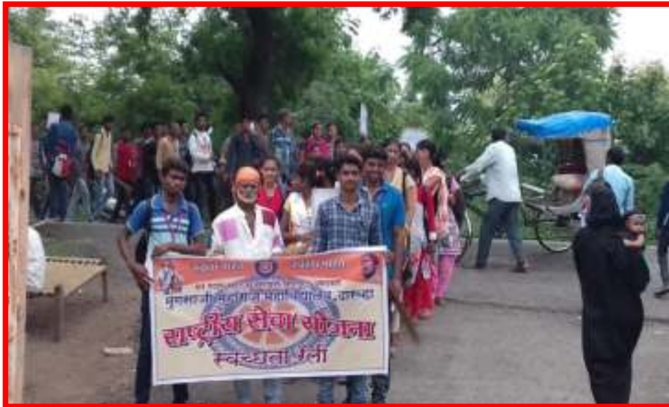
NSS Volunteer in Swachata (Cleanliness) Rally Tree Save and Conservation Rally