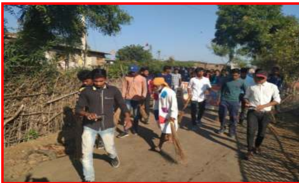
Cleanliness Awareness Rally