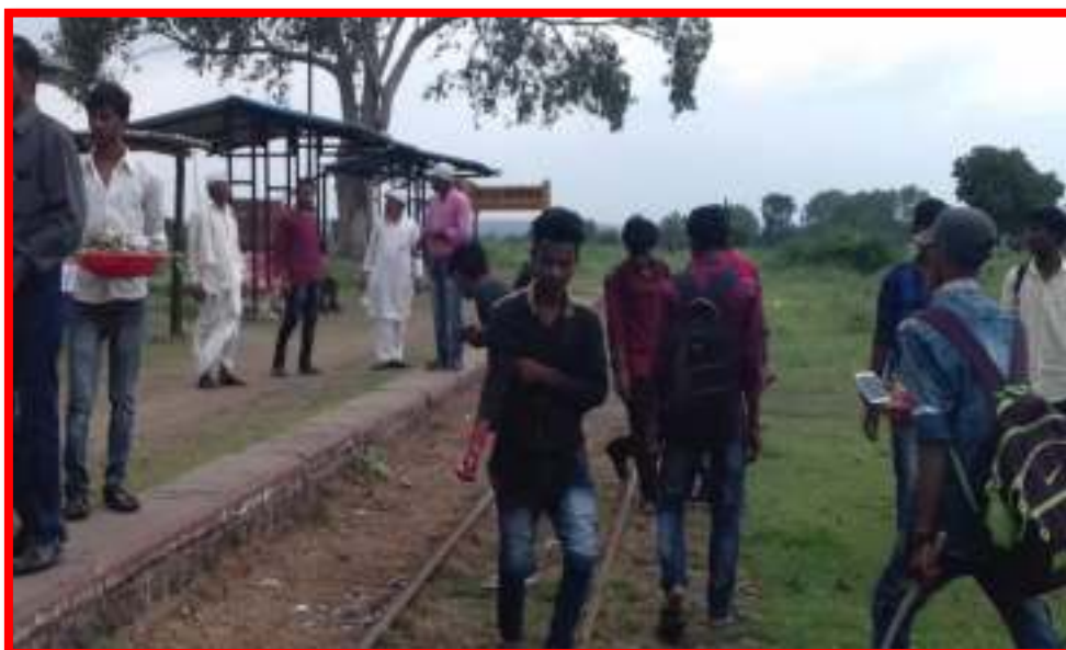
1 to 15 August 2017 Swachata Pandharwada Programme (Cleanliness Fortnight) of Railway Station