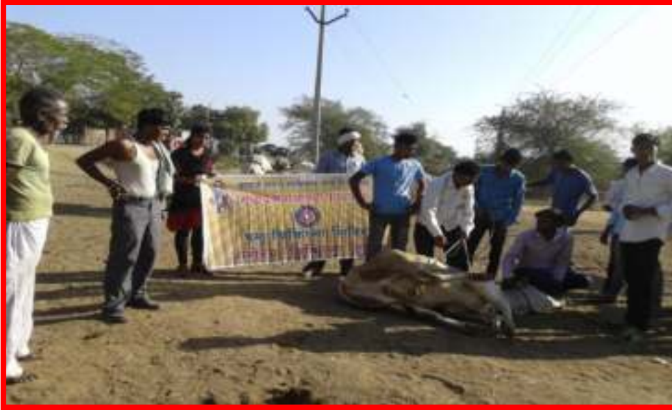
Dr. Maske and Sub-ordinate in animal disease diagnosis camp