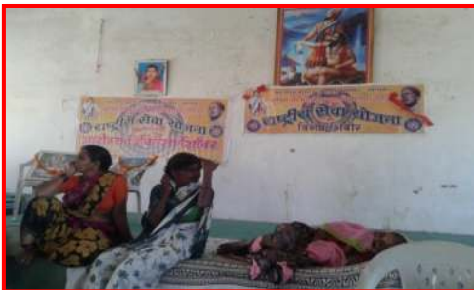
Health Checkup of patient in NSS camp