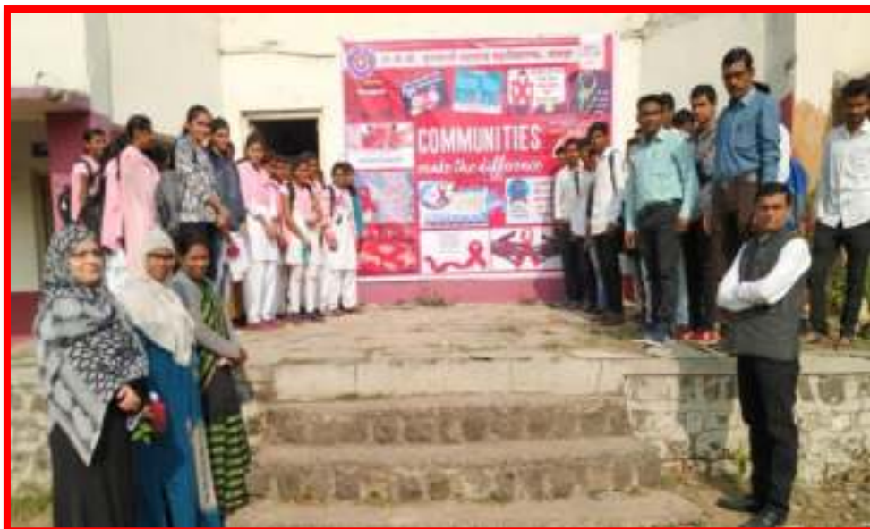
'AIDS Awareness Wall Painting Publications'