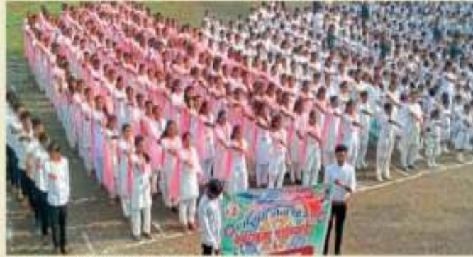
स्वच्छता : स्वच्छतेची शपथ घेताना महाविद्यालयीन विद्यार्थी व प्राध्यापक वर्ग.