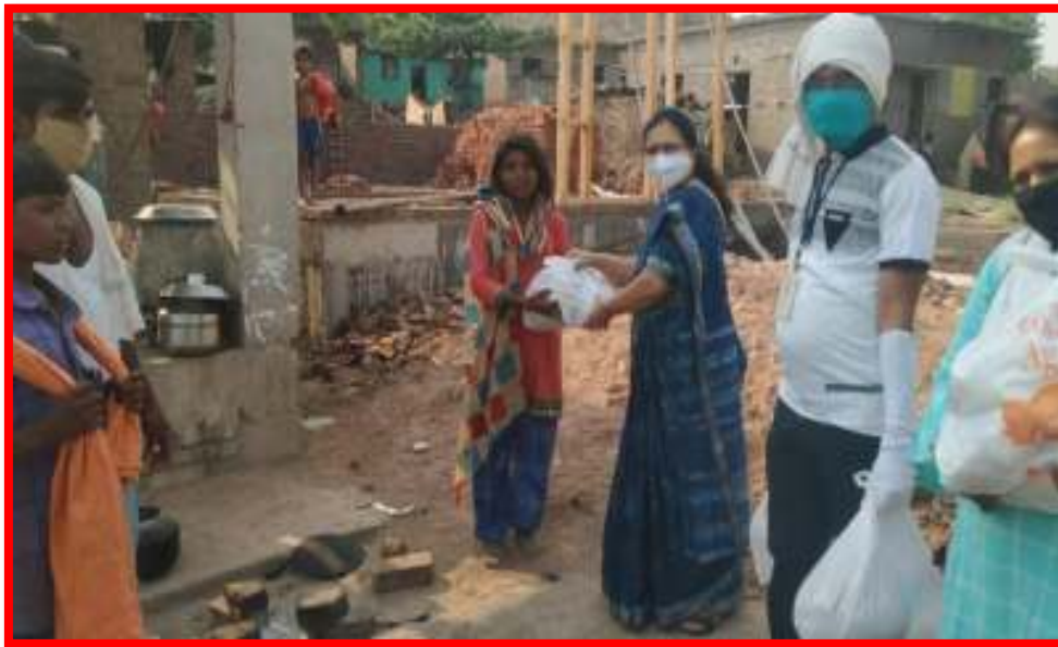
Distribution of Essential Items in covid-19 situation at adopt village Bijora Pardhi Tanda