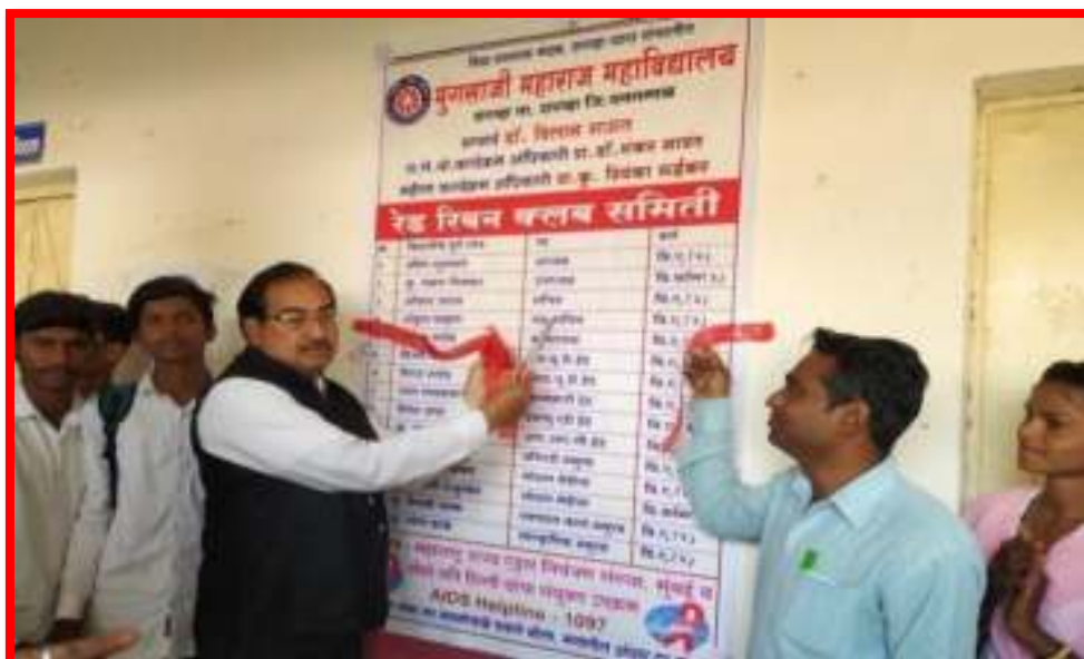
Red Ribbon Club Publications