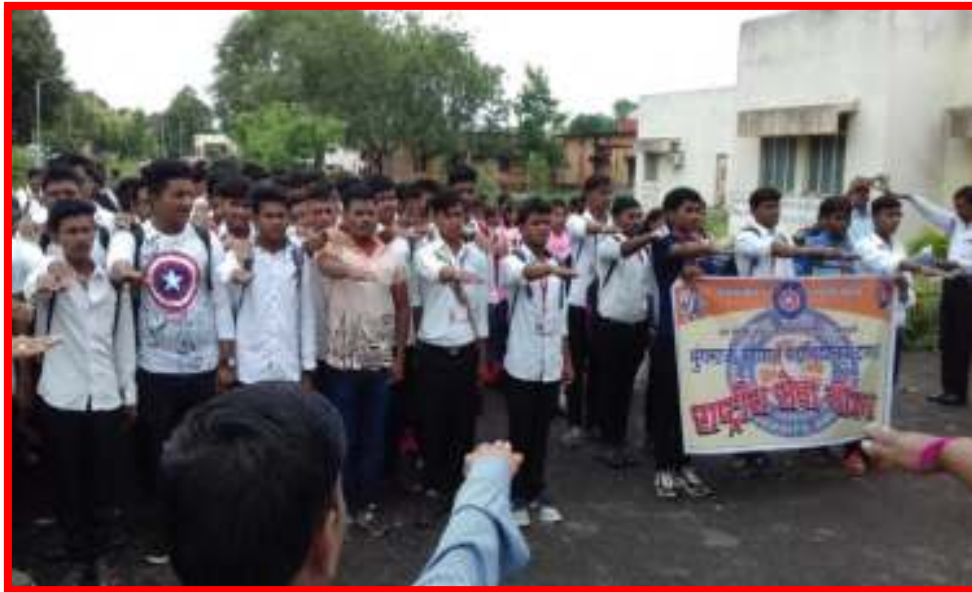
Organ Donation & Vocal Health Pledge