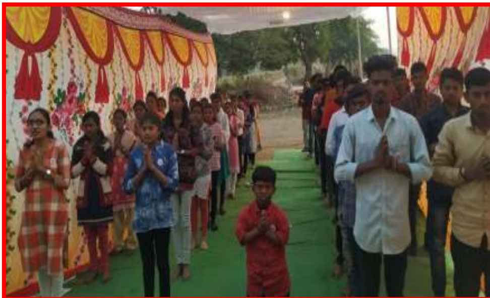
Prayer by NSS volunteers