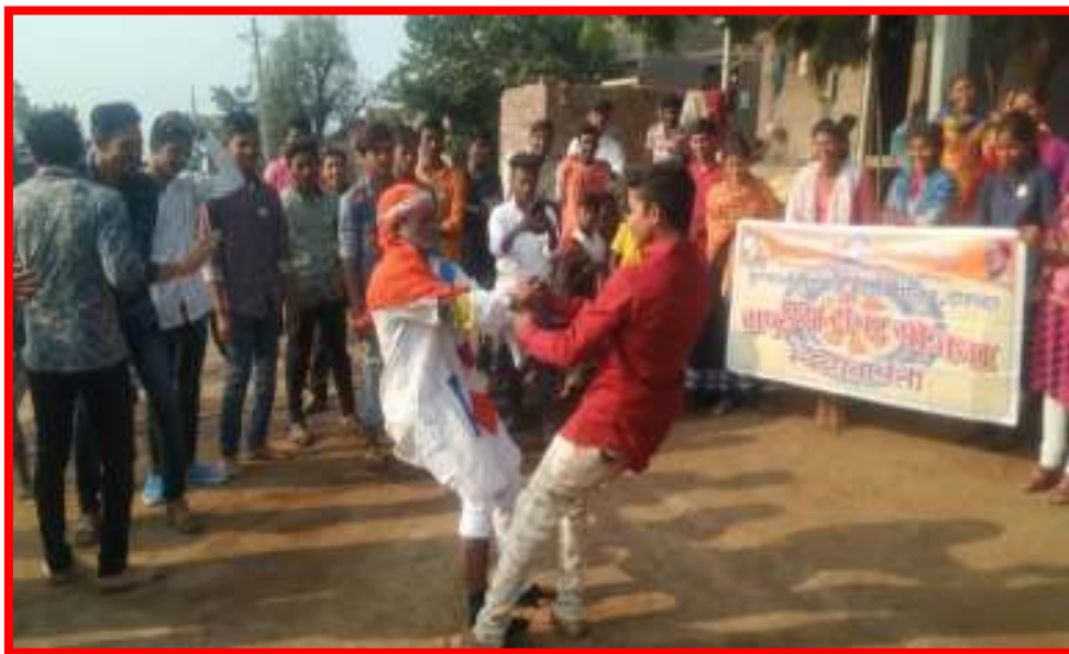
Cleanliness Awareness Rally