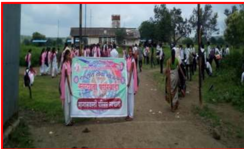
NSS Volunteers cleaning 'Railway Station Darwha'