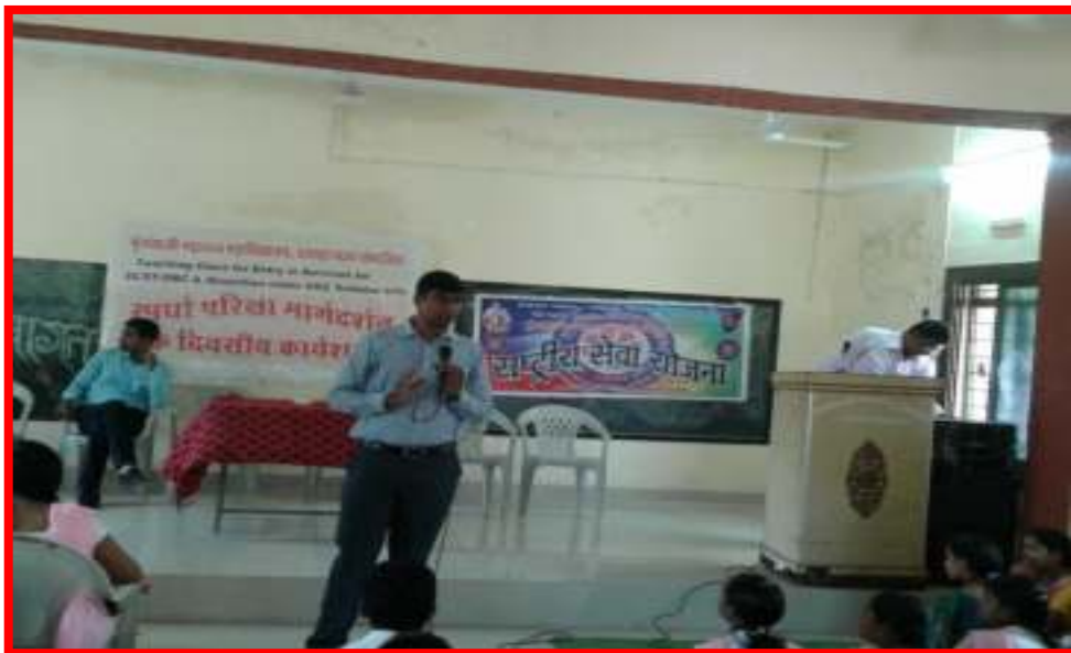
One Day Workshop on 'Career Guidance Counseling'