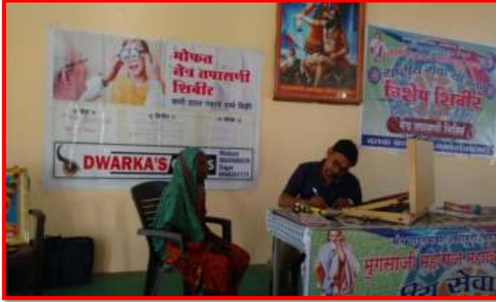
Eye Checkup Camp