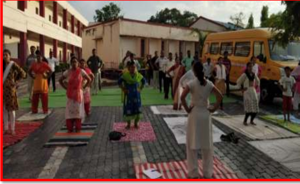
Staff doing Yoga