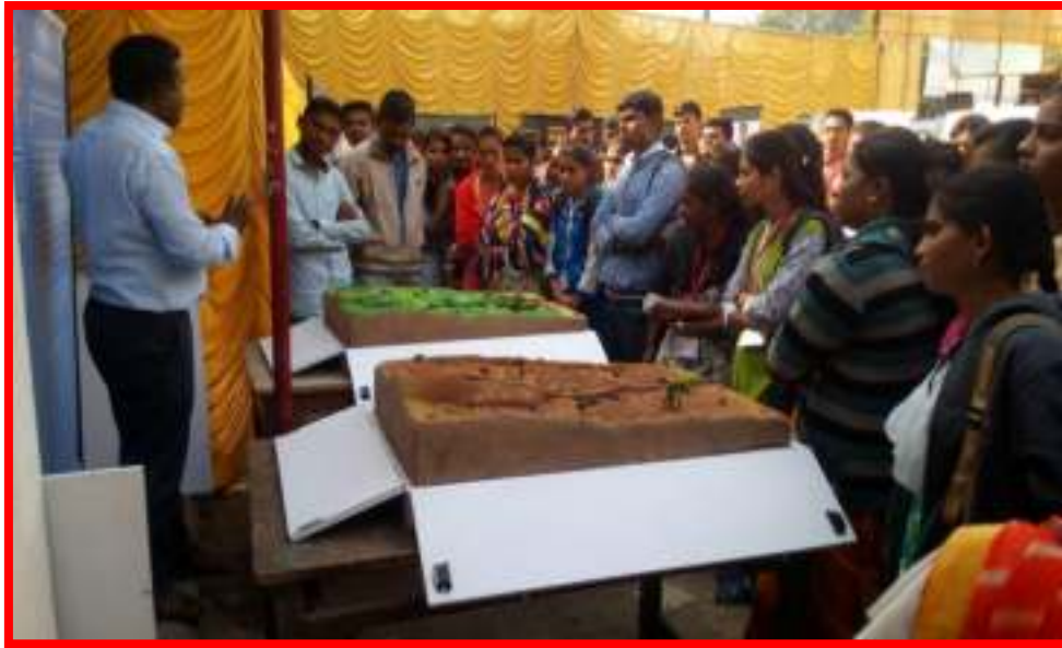
NSS Volunteers Visited to 'Water Foundation Exhibition'