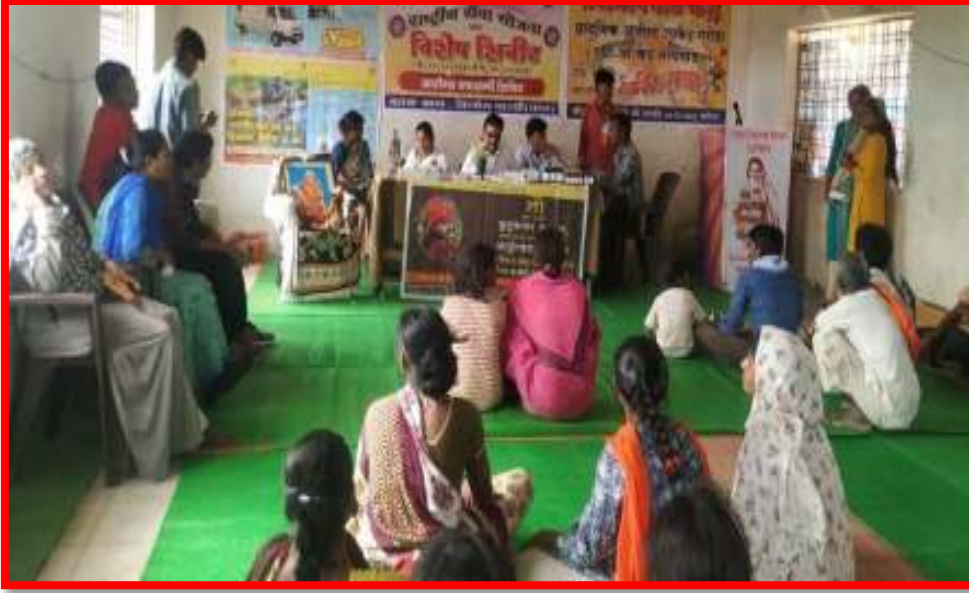
Health Checkup Camp at adopted village