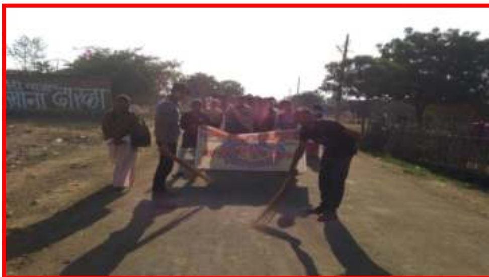
Cleanliness Awareness Rally