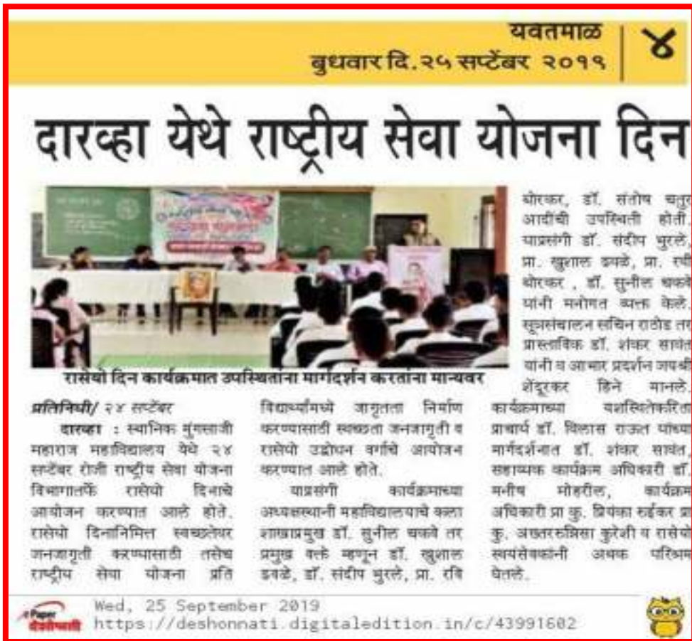
‘NSS Day’ news published by ‘Deshonnati’ newspaper