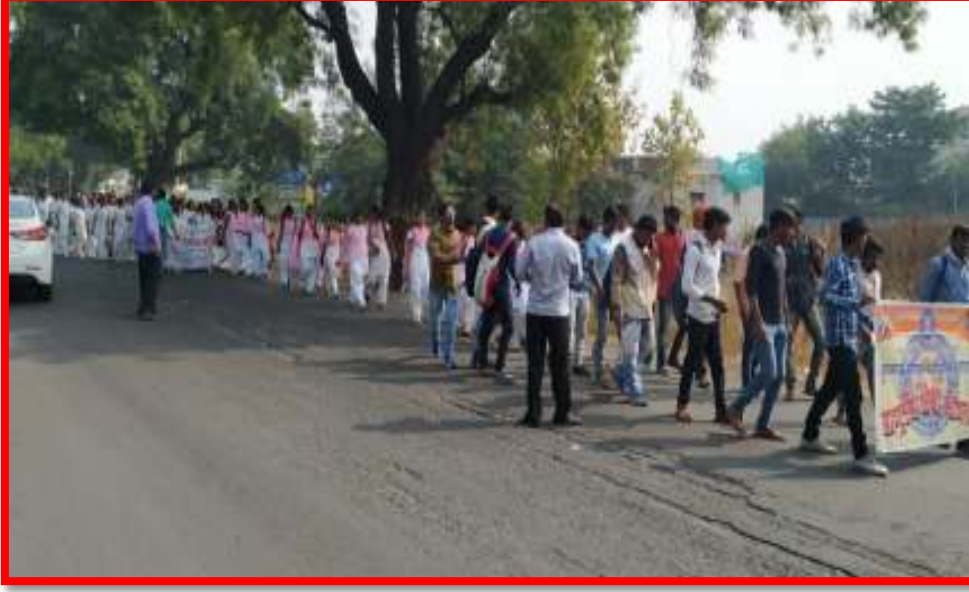
AIDS Awareness Rally