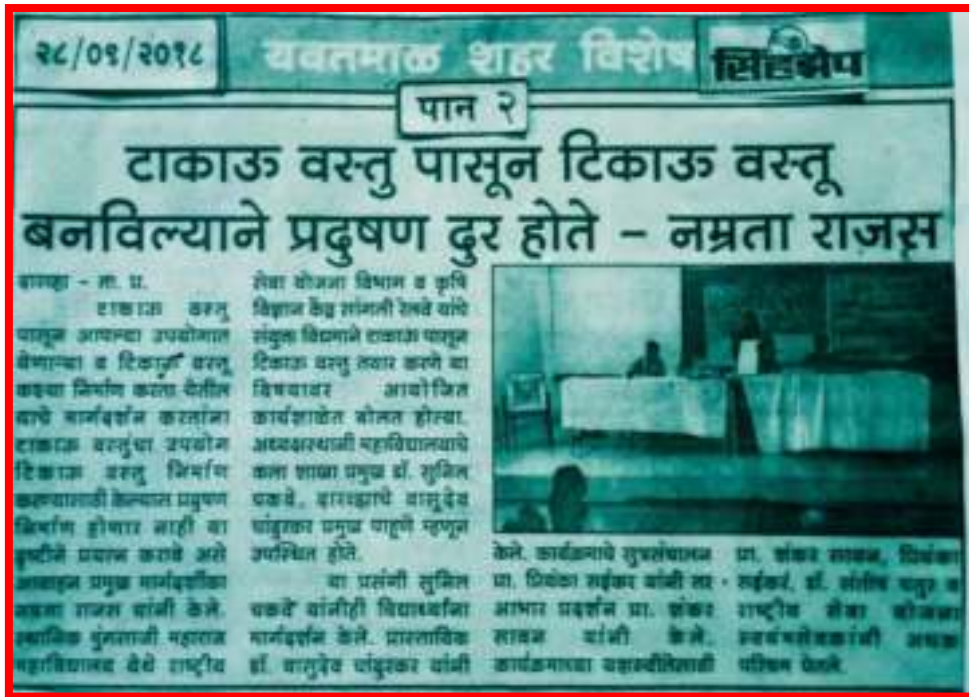
Waste From Best news published by Shihzep newspaper