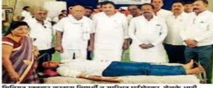
शिबिरात रक्तदान करताना विद्यार्थी व उपस्थित घुईखेडकर, शेळके आदी.