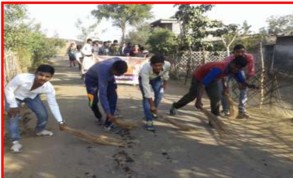
Students participating in Gram Swacchta Abhiyan (Village cleaning Campaign) & Rally