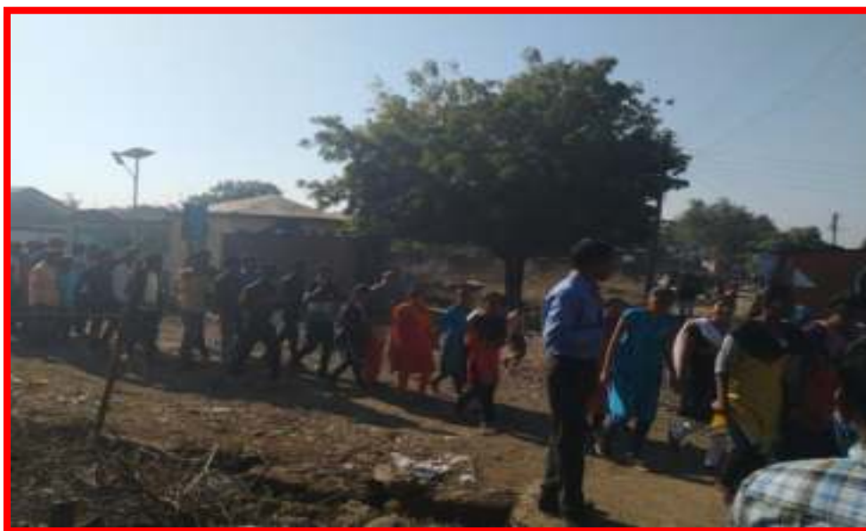
Cleanliness Awareness Rally