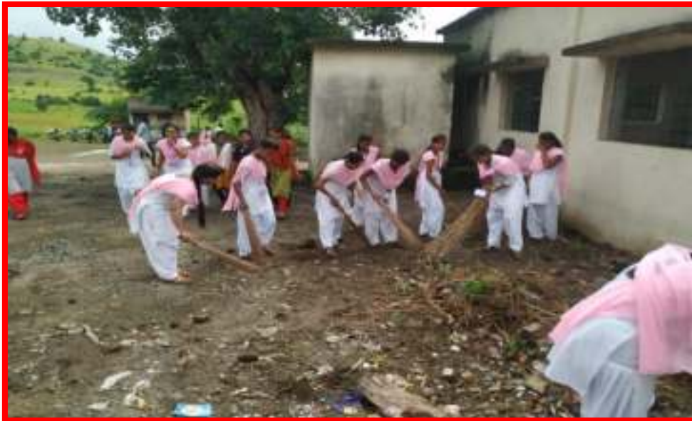
Cleanliness by NSS Volunteers at adopted village in 'One Day Camp'