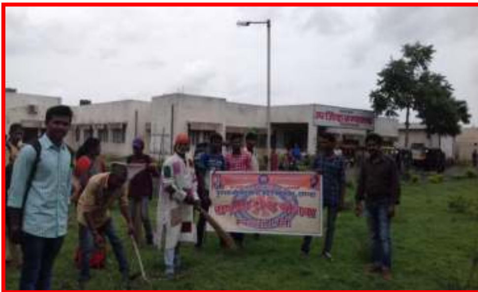
1 to 15 August 2017 Swachata Pandharwada Programme (Cleanliness Fortnight) under Student Cleaning Sub District Hospital