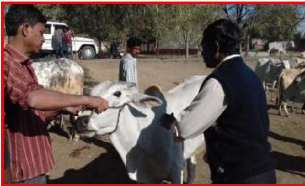
Veterinary Health Checkup Camp