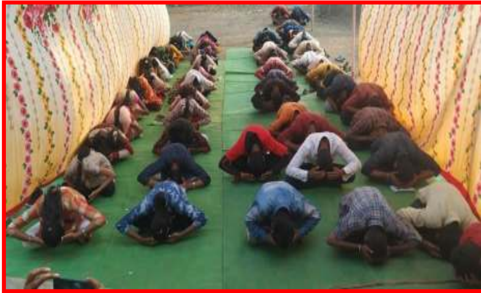
NSS volunteers is performing Yoga