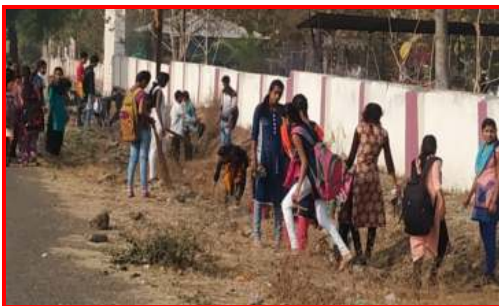
NSS volunteers cleaning camps

30/1/2020 'Swachhata (Cleanliness) Survey'