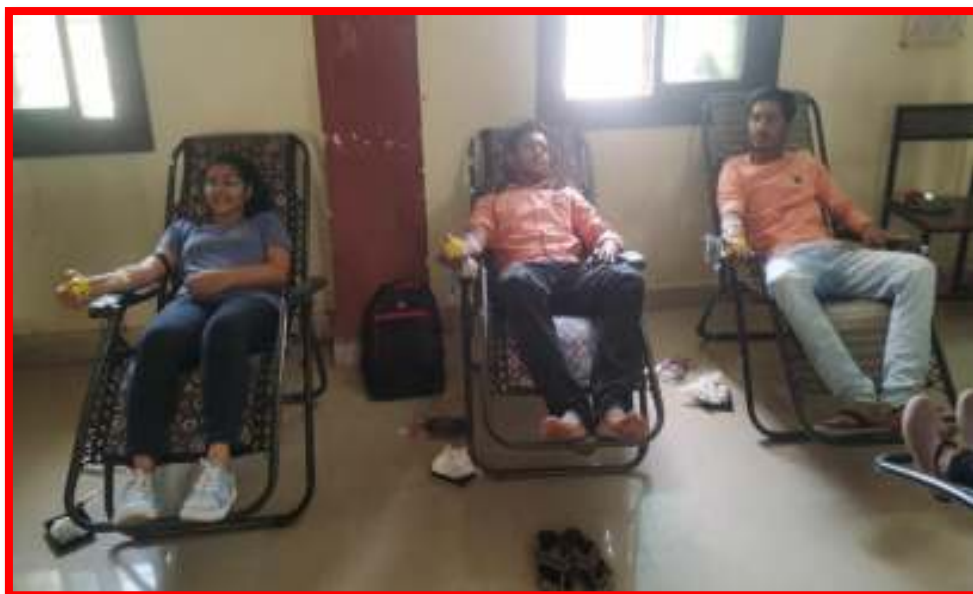
NSS Volunteers donating blood in 'Blood Donation Camp'