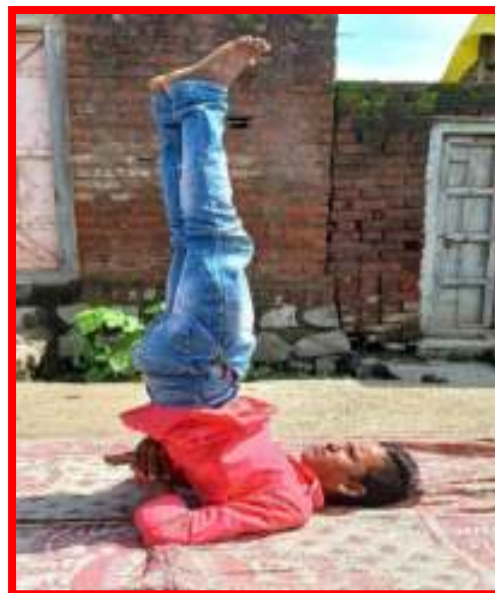
Students and Staff performing 'Yoga'