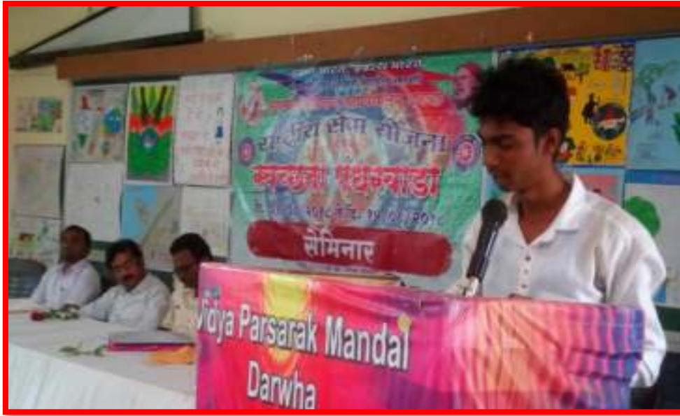
Seminar presentation by NSS Volunteers