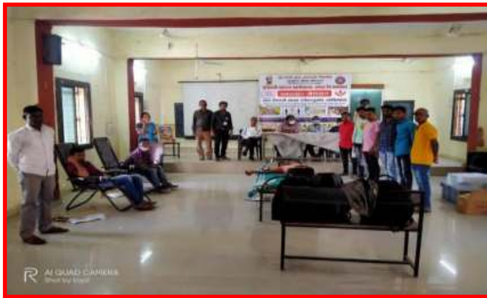
Students actively participating in 'Blood Donation Camp'