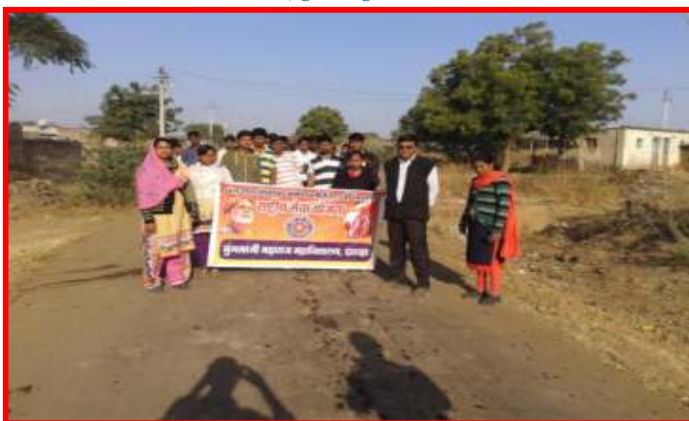
Cleaning Awareness Rally at Adopted Village