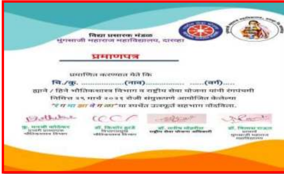
Certificate of 'Cultural Programme' (Holi Competition)