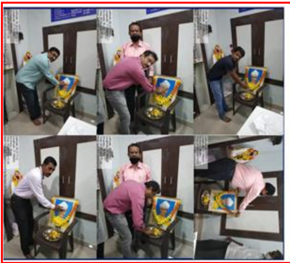
Chief guests garlanding Dr. Sarvpalli Radhakrishnan Image on the occasion of 'Teacher's Day'