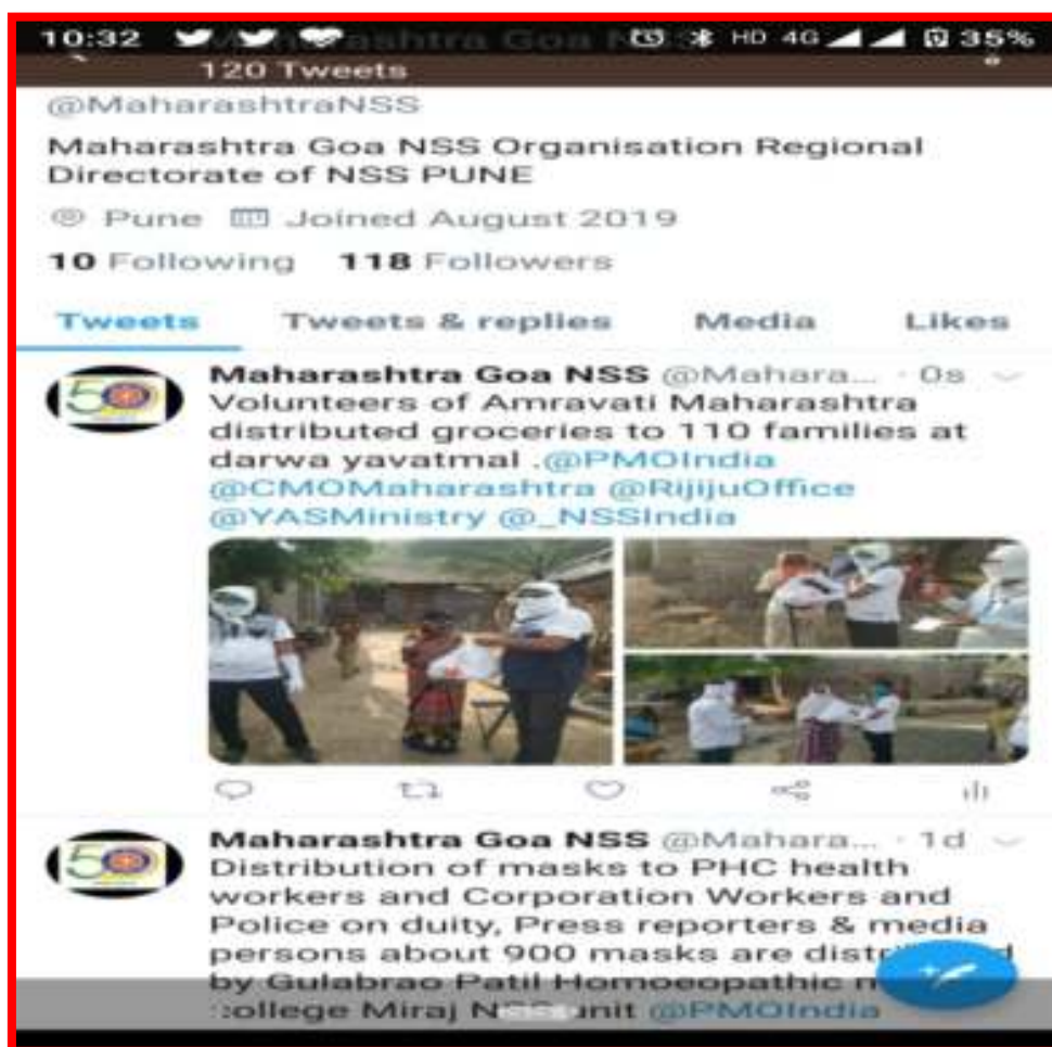
Distribution of Essential Items in covid-19 situation at adopt village Bijora Pardhi Tanda