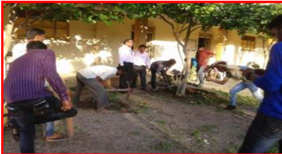
Swacchata Abhiyan on occasion of Ghandi Birth Anniversary