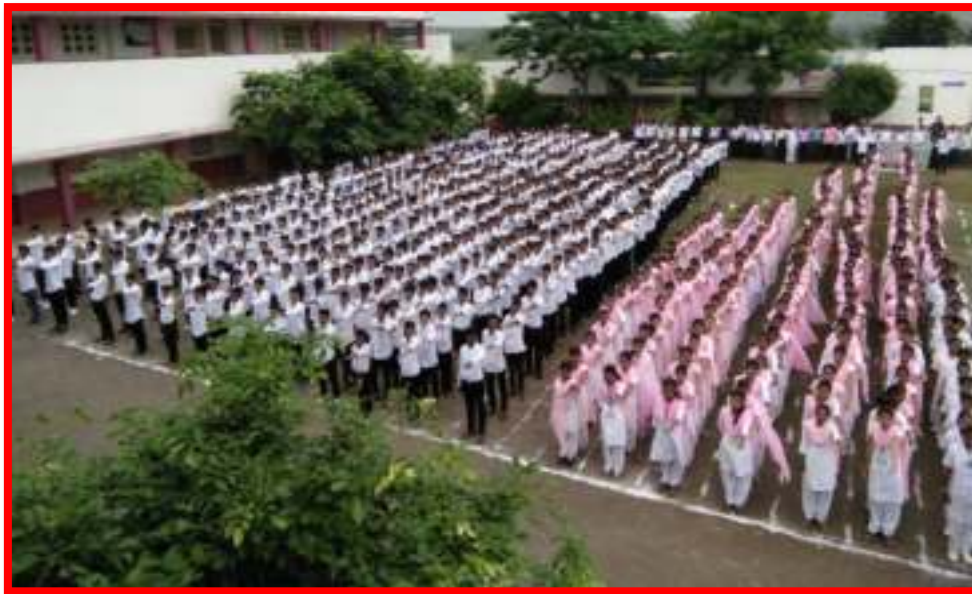
Students taking 'Cleanliness Pledge'