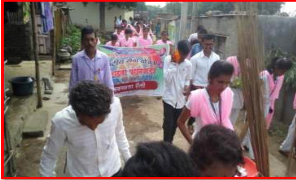
'Cleaning Awareness Rally' by NSS volunteer in adopted village in 'One Day Camp'