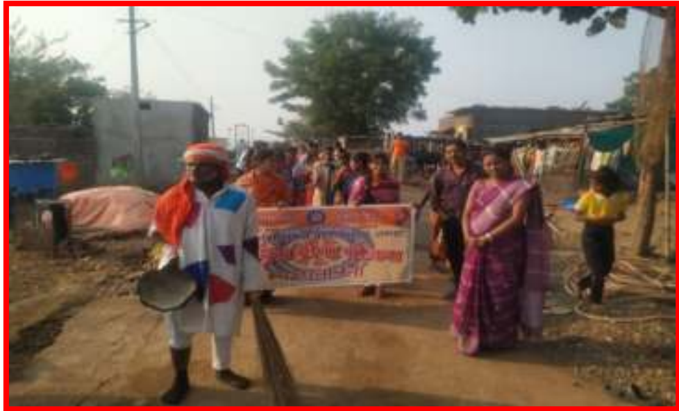
Cleanliness Awareness Rally

15 to 22/1/2020 ' Cleanliness Awareness Rally '