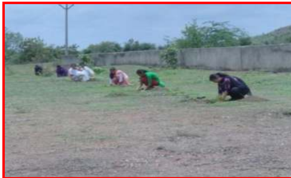
Tree Plantation by NSS volunteers'