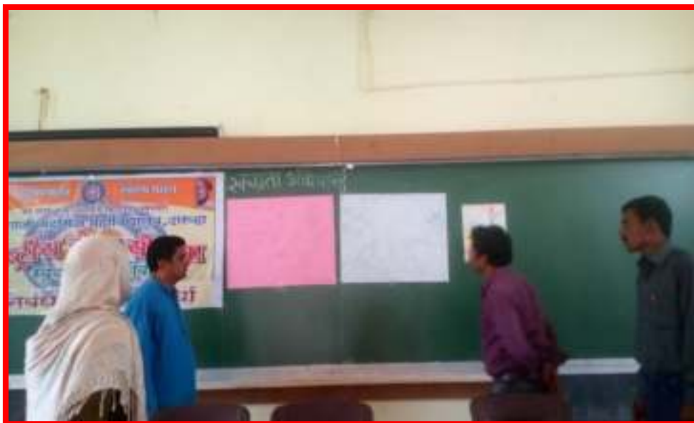
15 September to 2 October 2017 Cleanliness is the service' under fortnight programme Cleaning Awareness Camp in Adopted Village