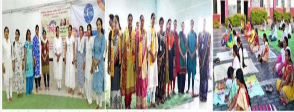
यवतमाळ : नेहरू स्टेडियमचा झालेल्या कार्यक्रमात सहभागी तनिष्का सदस्य. नेर : क्रीडा संकुलात योगासने करताना तनिष्का सदस्य व इतर.