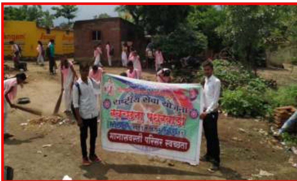
Cleanliness of 'Backward area' by NSS Volunteers