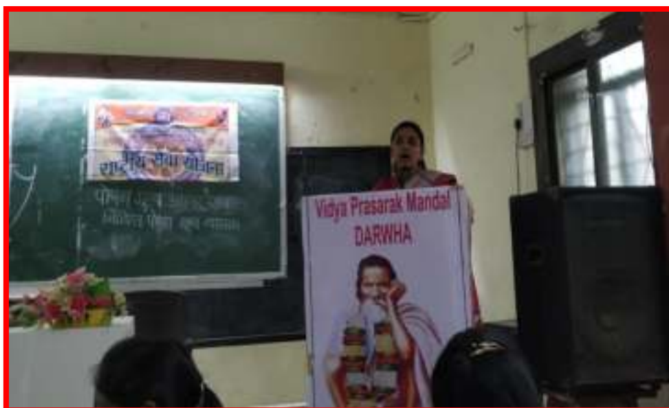
Dr. Potpate speech delivered on 'Nutrition Week'