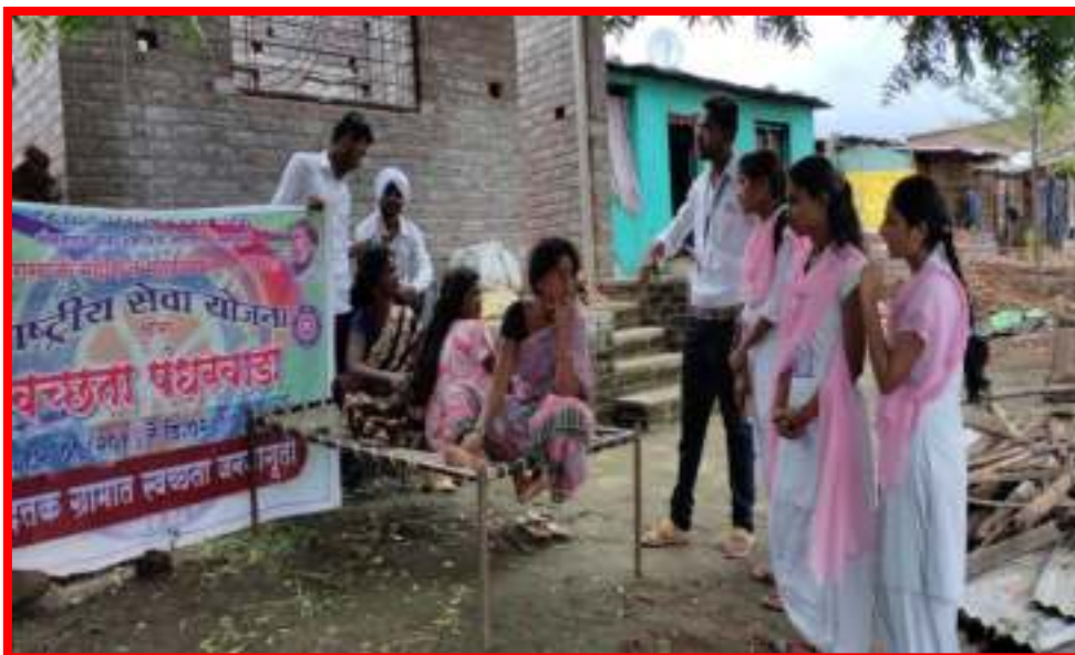
'Cleaning Awareness' by the NSS volunteer in adopted village in 'One Day Camp'