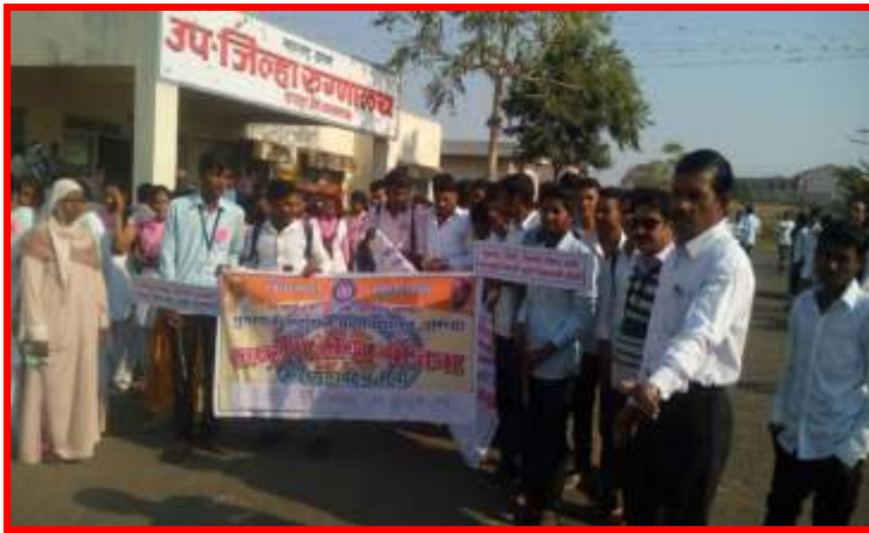
AIDS Awareness Rally