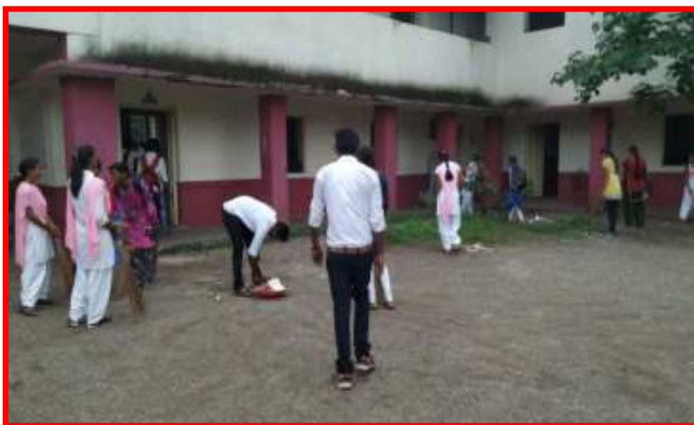
Cleanliness of Camps by NSS Volunteers