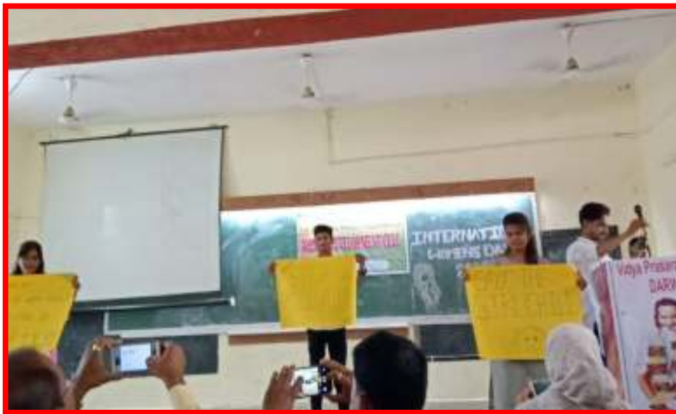
Short Play by the students on 'Save Girl Child'