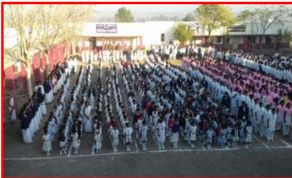
Students in 'Republic Day'