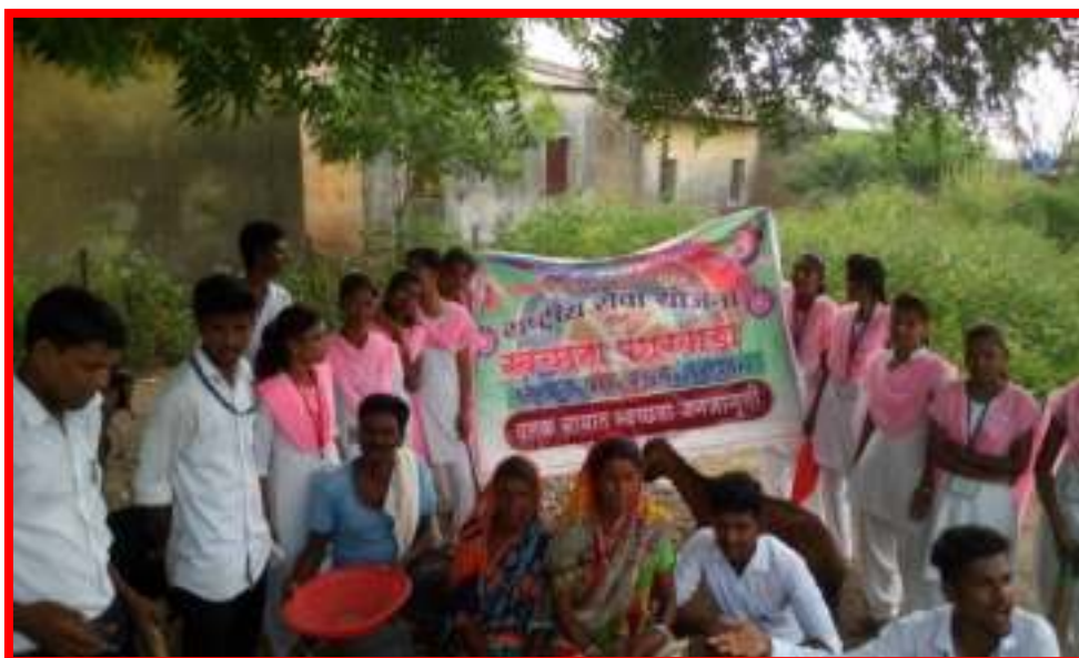
Cleaning Awareness by NSS volunteer in adopted Village in 'One Day Camp'