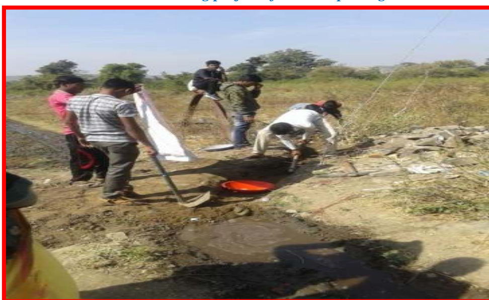
Students doing project of Digging Canal