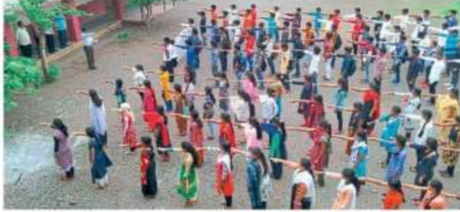
दारुणा : तंबाखूमुक्तीची शपथ घेताना महाविद्यालयीन विद्यार्थी व प्राध्यापक.