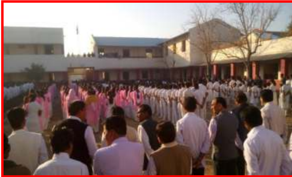
Students in 'Republic Day'