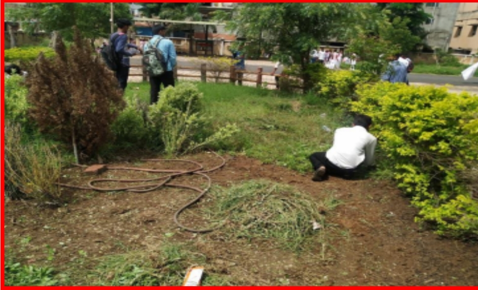
Cleanliness of Sub District Court by NSS Volunteers

News published by 'Lokmat' newspaper about cleanliness of Bus Stand, Darwha