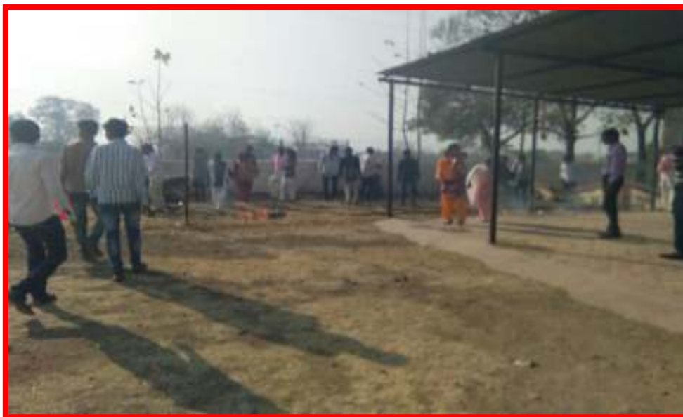
Cleanliness campaign of campus By NSS Volunteers