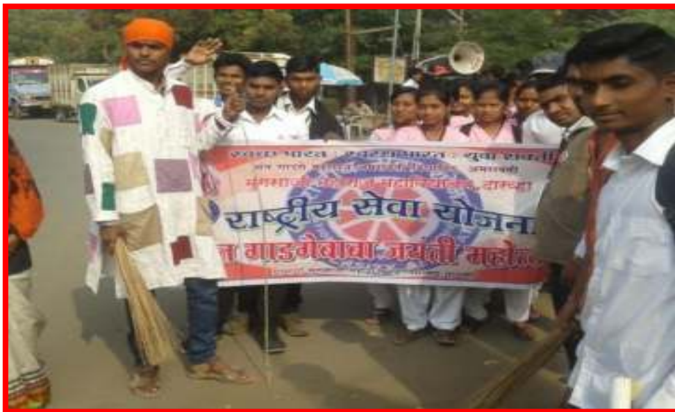
Street Play on 'Swacchta' (Cleanliness)