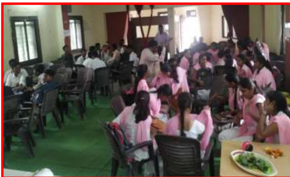
NSS Volunteers Participated in 'Group Discussion'