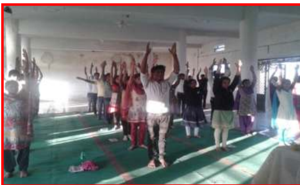
Student doing Yoga