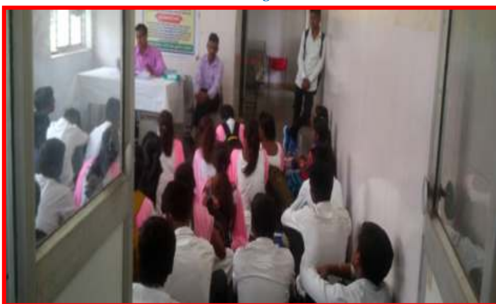
NSS Volunteers in Leprosy Survey Training