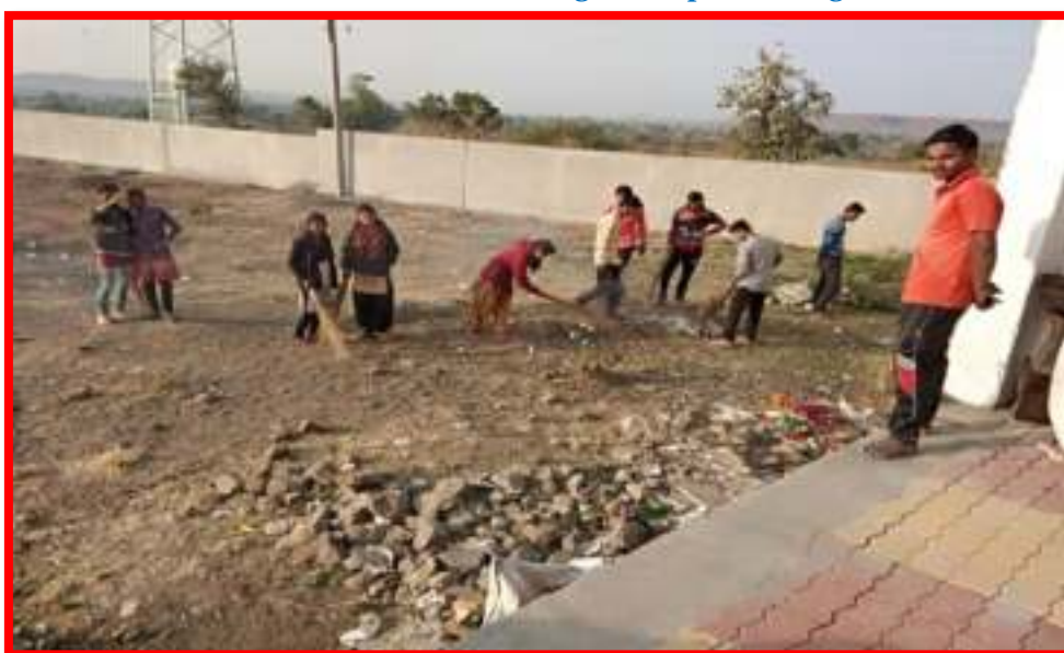
NSS Volunteers Cleaning at Adopted Village