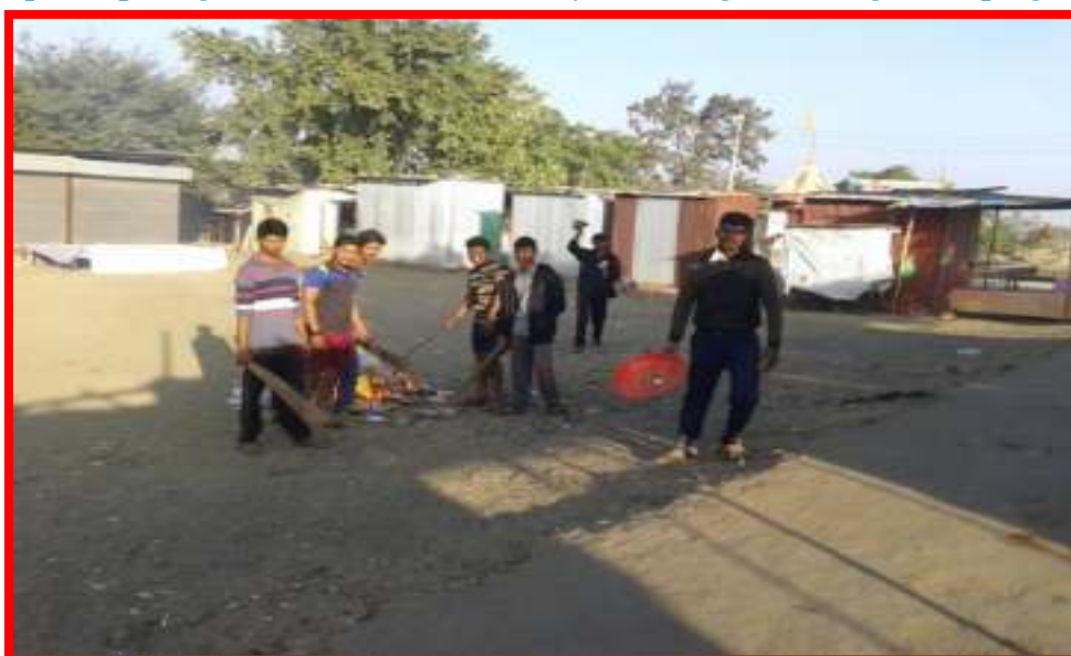
Students participating in Gram Swacchta Abhiyan (Village cleaning Campaign)