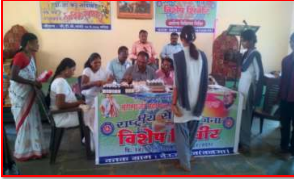
Health Checkup Camp