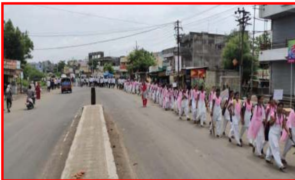
NSS Volunteer participated in ‘Plantation and Tree Conservation Rally’