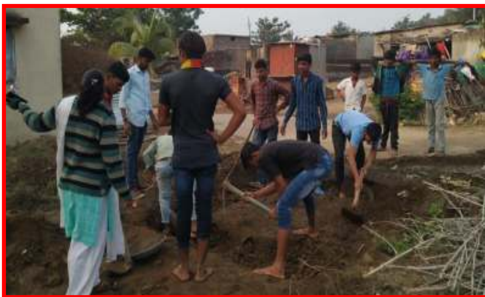
NSS volunteers working for 'Special Project'