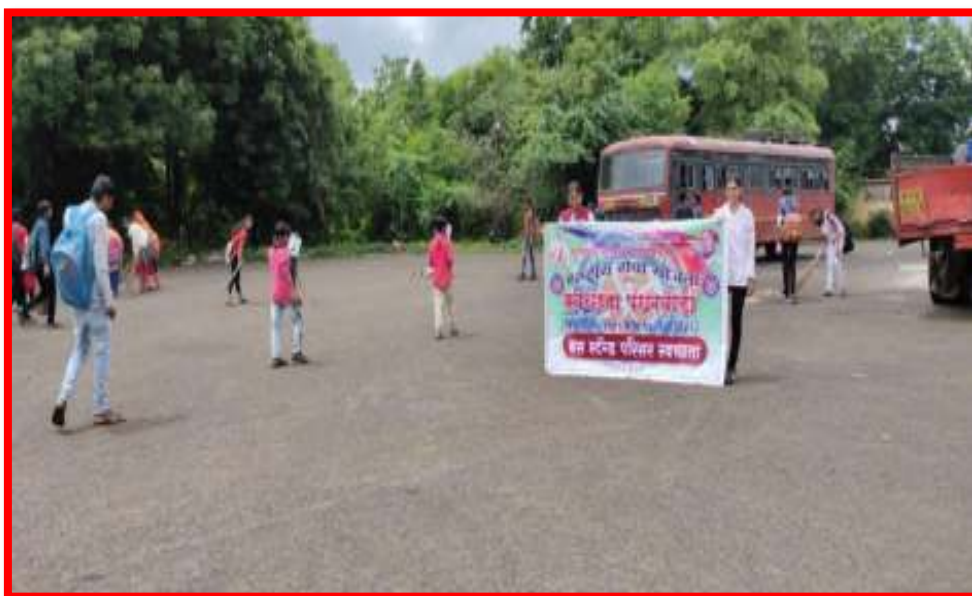
Cleanliness of 'Bus Stand' by NSS Volunteers