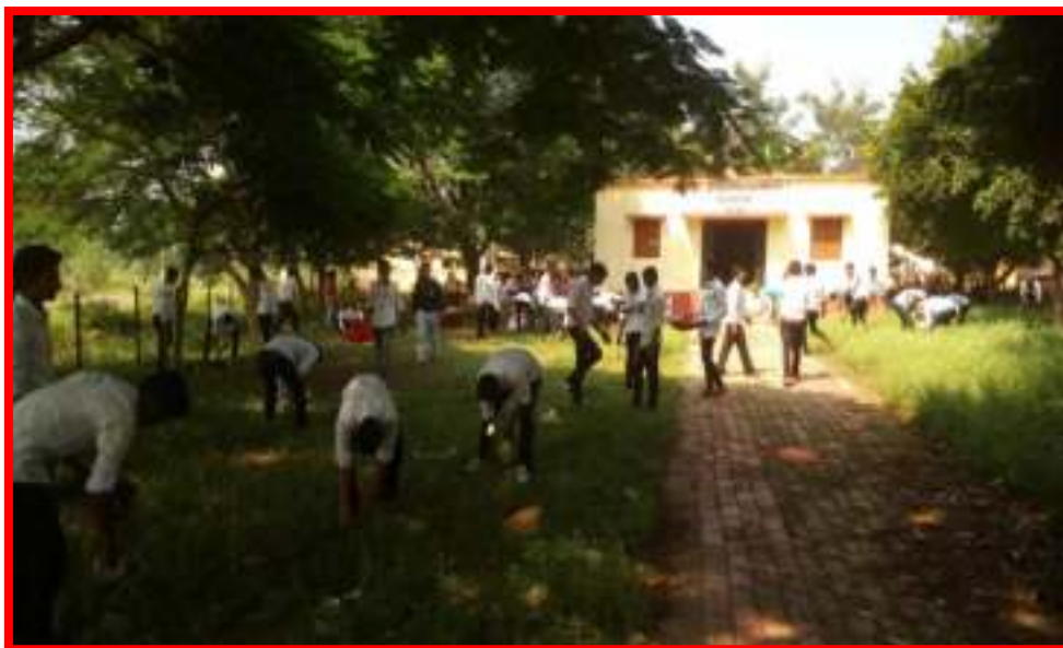
15 September to 2 October 2017 'Cleanliness is the service' under fortnight programme Cleaning Awareness Camp in Adopted Village