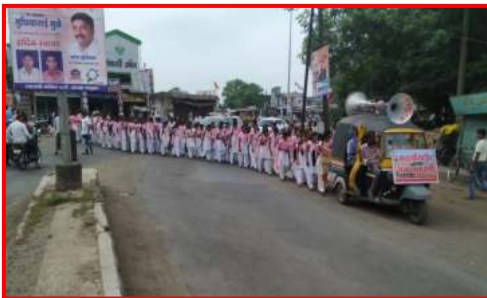
Students' participation in Sangali, Satara & Kholhapur 'Relief Fund for Flood Victims Rally'