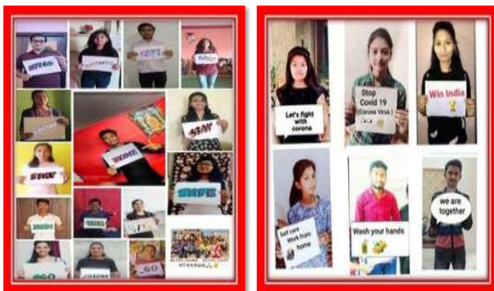
NSS volunteer doing Covid-19 Awareness