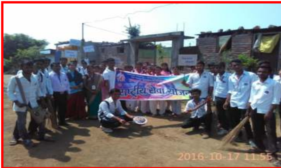
NSS Volunteers performing street play on Gram Sawachhta (Cleaning Village)