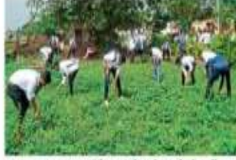
चारव्या : स्वच्छता करतच रॅलीत सहभागी महाविद्यालयीन विद्यार्थी.

दारव्हा, ता. १७ : स्थानिक मृगसाजी महाराज महाविद्यालयातील राष्ट्रीय सेवा योजनेकडून शहरात स्वच्छता व वृक्षसंवर्धन रॅलीचे आयोजन करण्यात आले. घोषवाक्य लिहिलेल्या फलकाद्वारे स्वच्छतेसह वृक्षसंवर्धनाचा शहरभर जागर करीत विद्यार्थ्यांच्या रॅलीने शहरवासींची मने जिंकली.