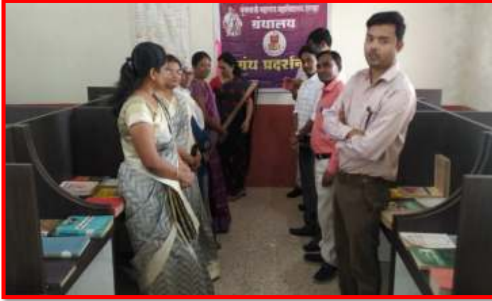
'Book Exhibition' on 'Reading Inspiration Day & A.P.J Kalam Birth Anniversary'