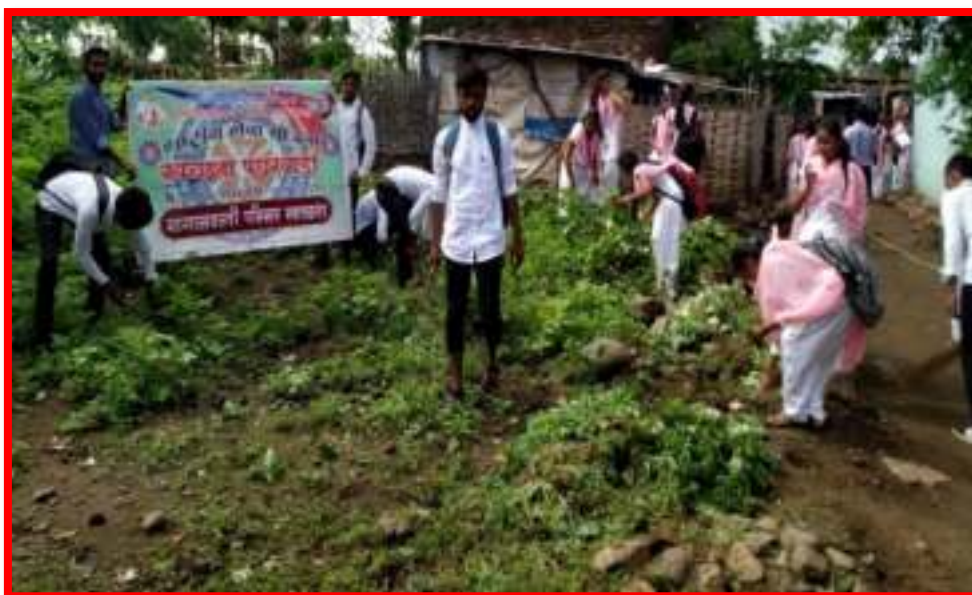
Cleanliness of Backward Settlements of city by NSS Volunteers