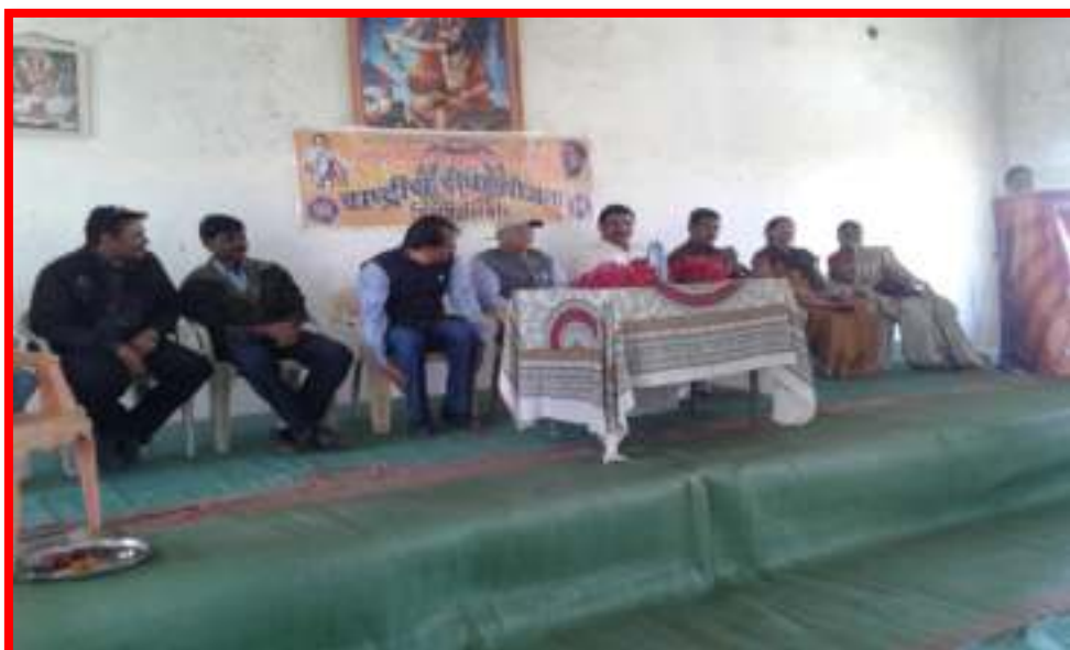
NSS volunteer giving feedback in concluding ceremony