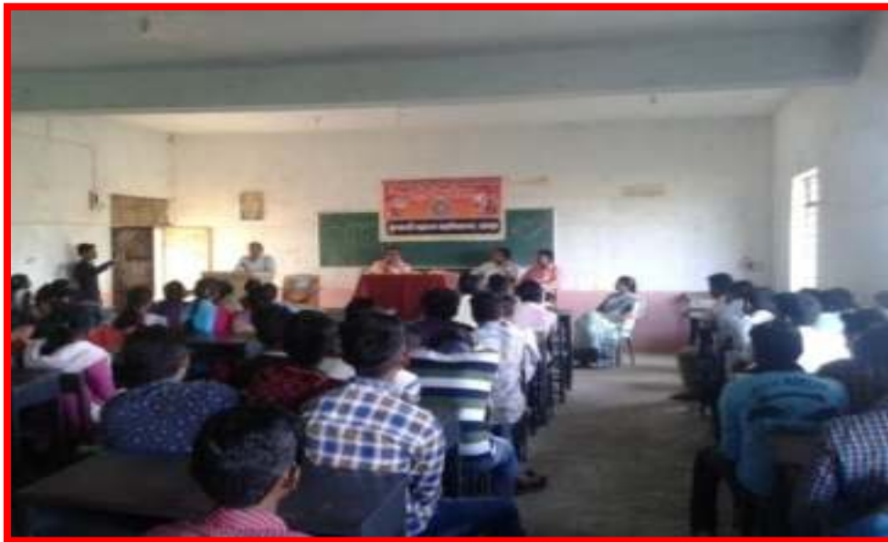
Guidance by Teacher on occasion of Teacher's Day