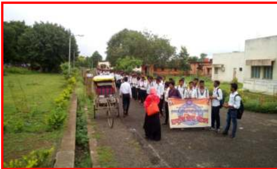
Organ Donation & Vocal Health Awareness Rally