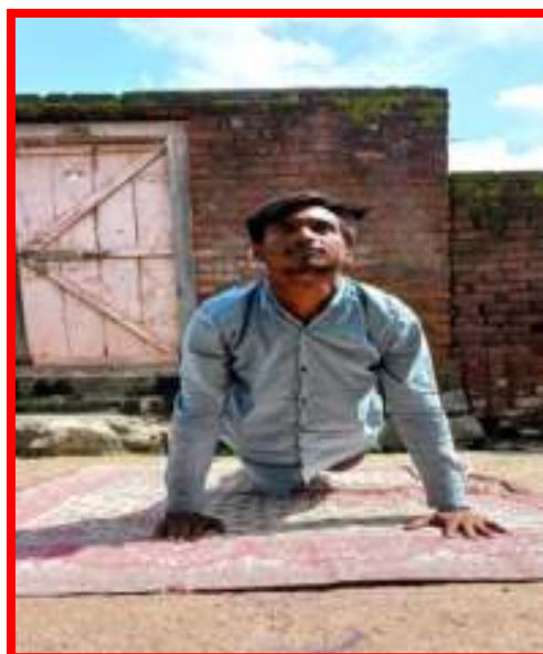
Staff performing Yoga on the occasion of 'International Yoga Day'