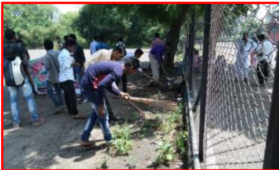
NSS Volunteers cleaning Bus Stand Darwha