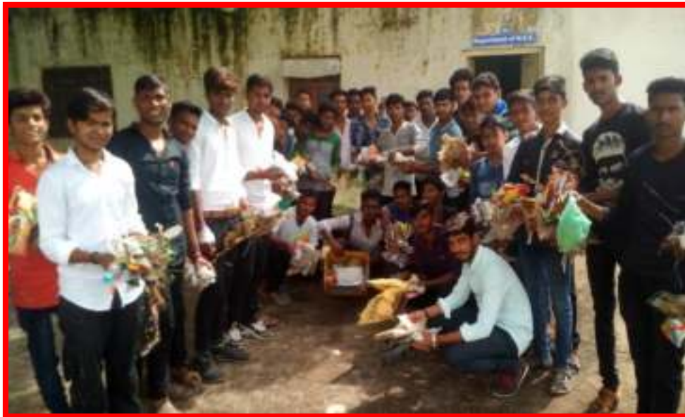
NSS Volunteers cleaning campus