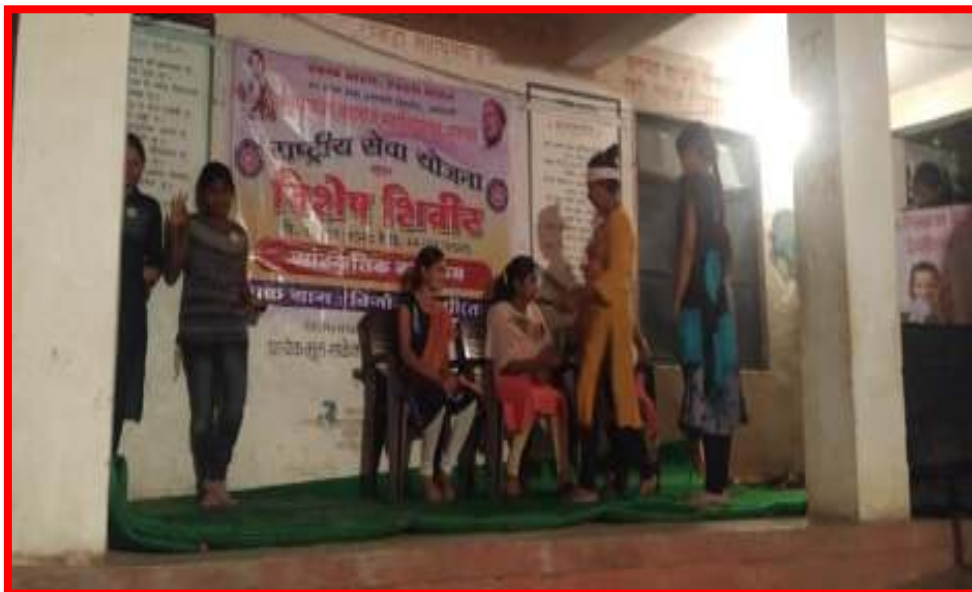
NSS volunteers performing short play in 'Cultural Programme'