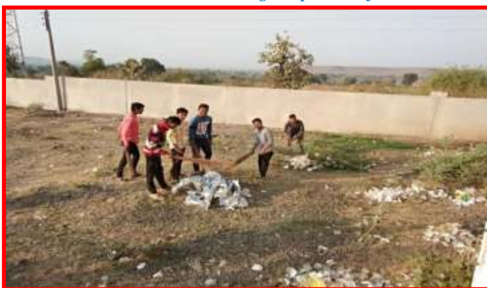
NSS Volunteers Cleaning at adopted Village