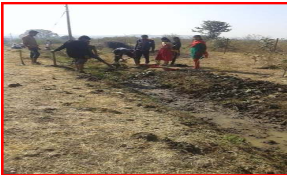
Students while making Canal