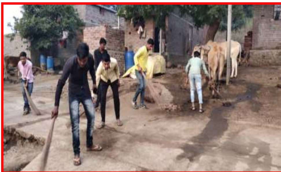
NSS volunteers doing Swachhata (Cleanliness) at adopted village