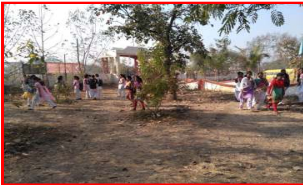
1 To 15 August 2017 Swachata Pandharwada (Cleanliness Fortnight) programme under Student Cleaning Camp