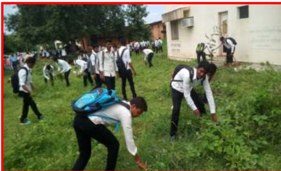
NSS Volunteers cleaning 'Sub District Health Centre Darwha'