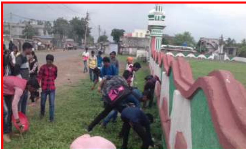
1 to 15 August 2017 Swachata Pandharwada Programme (Cleanliness Fortnight) of backward area