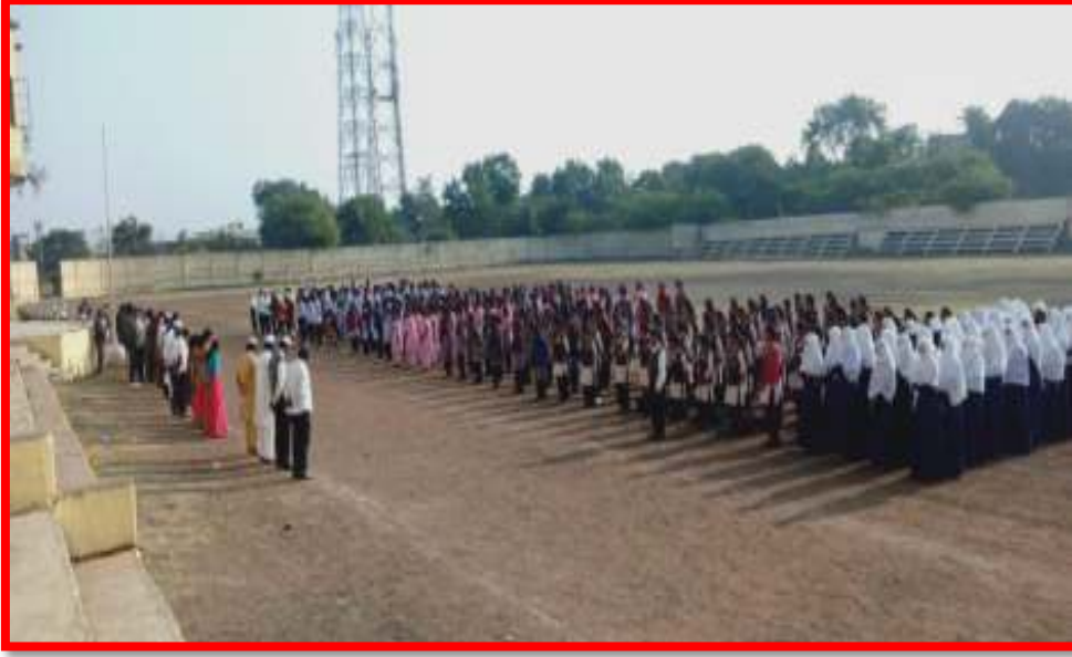
'Tribute to the victim of Higanghat's woman'