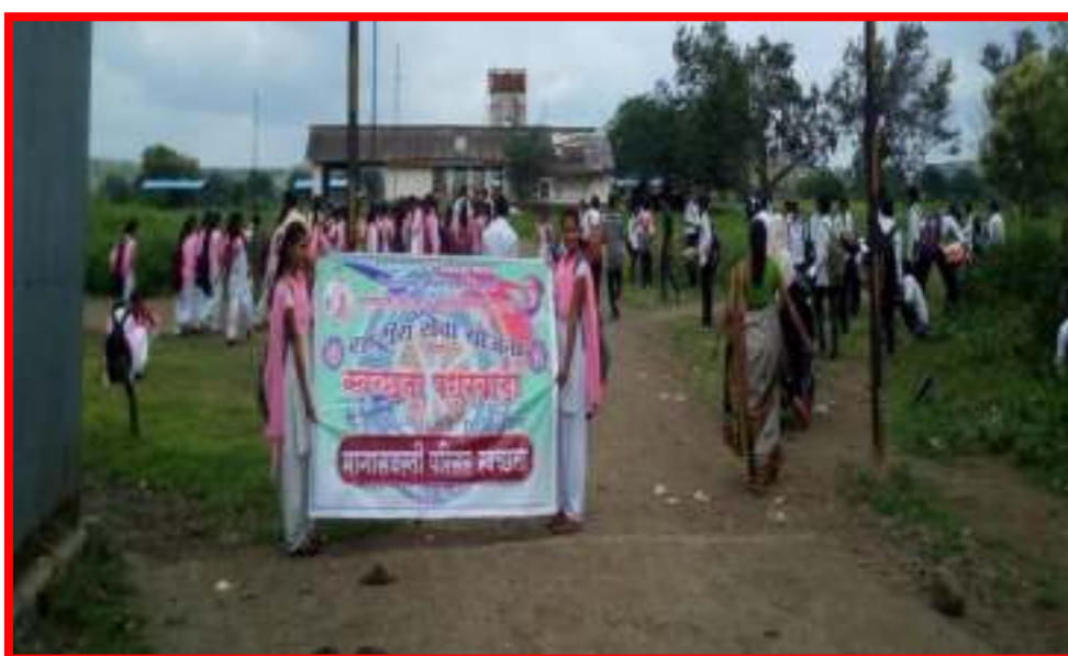
NSS Volunteers Cleaning Backward Area of Darwha