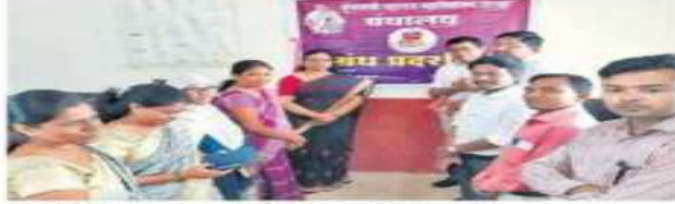
ग्रंथ प्रदर्शनाच उद्घाटन कार्यक्रमाला उपस्थित मानववर.