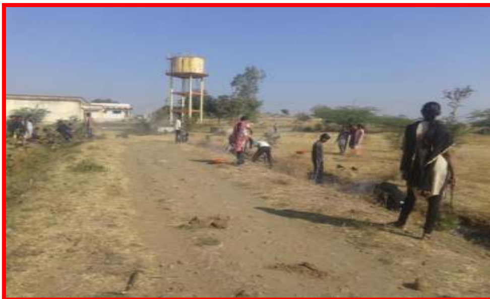
Students doing project of Road Repairing