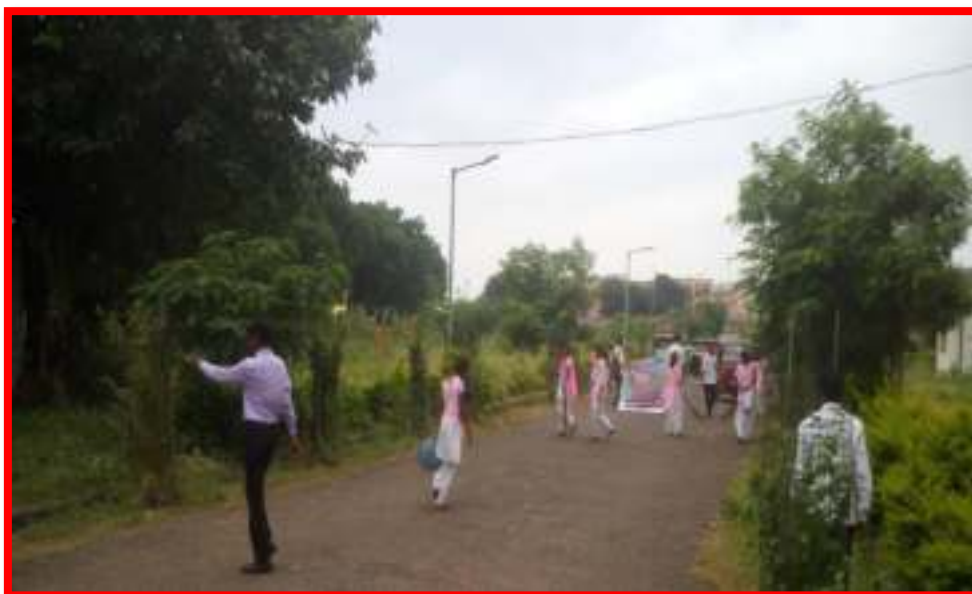
NSS Volunteers Cleaning 'Sub District Health Centre', Darwha