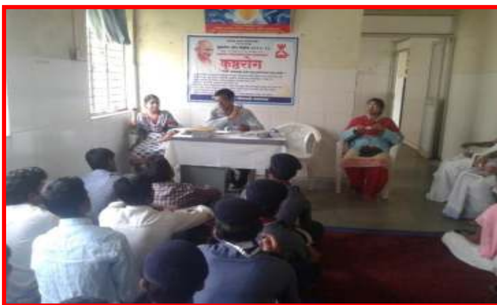
Training for the Survey for Leprosy