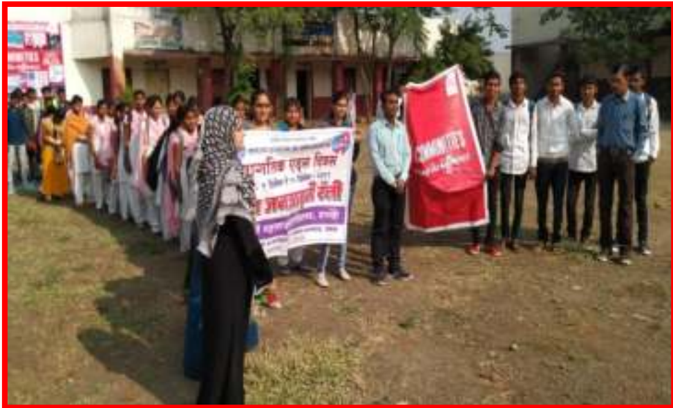
AIDS Awareness Rally