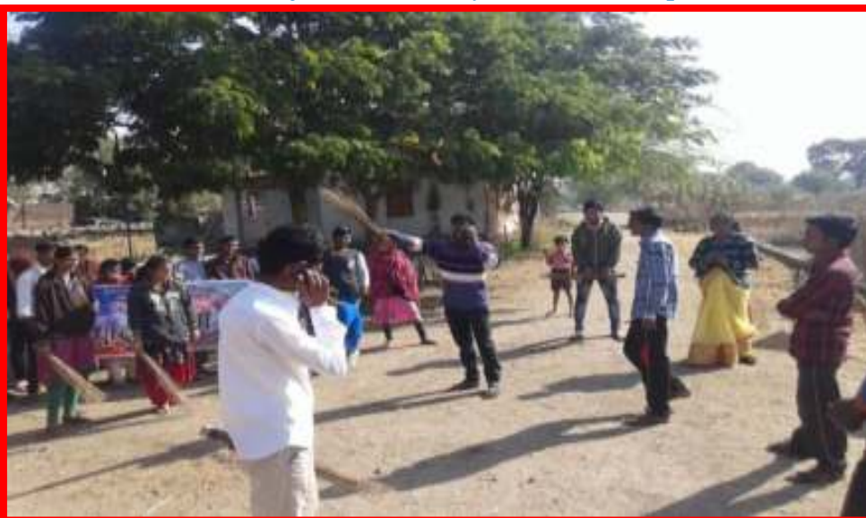
NSS volunteers performing Street play at Adopted Village